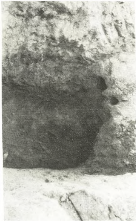
α. Όλοι εντός της επιχώσεως τοῦ τύμβου ἐγγὺς τοῦ τάφου.