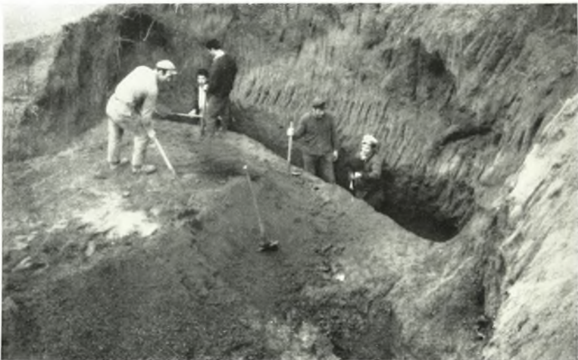
β. Ἡ ἔρευνα τοῦ ΝΔ. τομῆος τοῦ τύμβου Νικησιάνης.