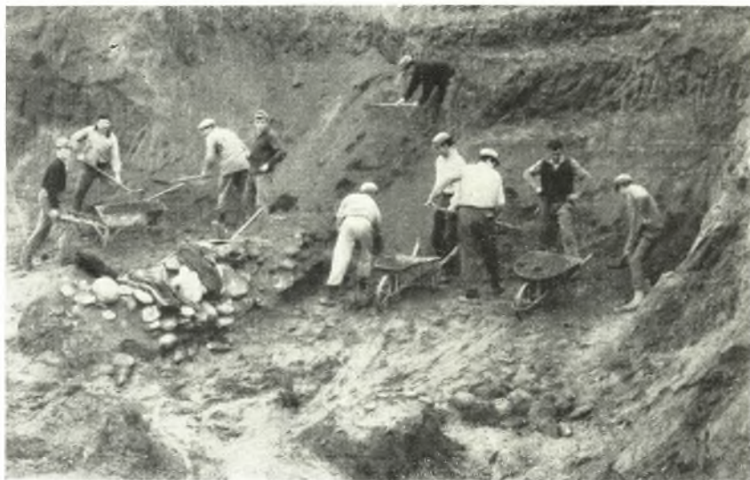
α. Ἡ ἀνασκαφή τοῦ βορείου τομέως τοῦ τύμβου Νικησιάνης Παγγαίου.