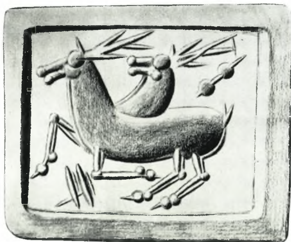
β. Σχέδιον τοῦ ἐκτύπου τῆς σφραγίδος ἐξ ἀγάλτου με παρὰστασιν ζεύγους ἐλάφων ἐν καλπασμῶ καὶ βέλους κυνηγοῦ. (Σχέδιον Θ. Φανουράκη)