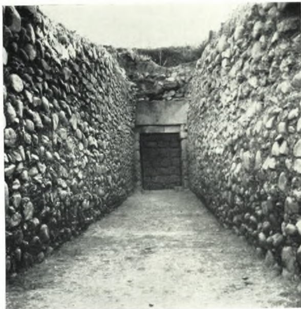
α. Ὁ δρόμος καὶ ἡ εἴσοδος τοῦ τάφου μετὰ τὴν ἀνασκαφὴν.