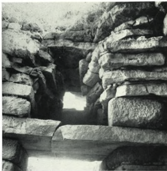
α. Τὸ ὑπέρθυρον καὶ τὸ ἀνακουφιστικὸν τρίγωνον ἐκ τῶν ἔσω.