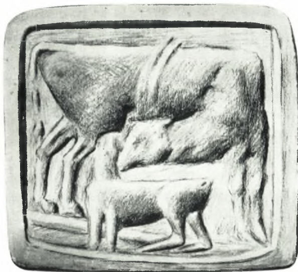
α. Σχέδιον τοῦ ἐκτύπου τῆς χαλκῆς σφραγίδος, με παρὰστασιν ἀγελάδος λειχούσης τὸν θηλάζοντα μόσχον. (Σχέδιον Θ. Φανουράκη)