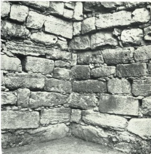
β. Ἡ ΝΑ. γωνία τῆς θόλου.