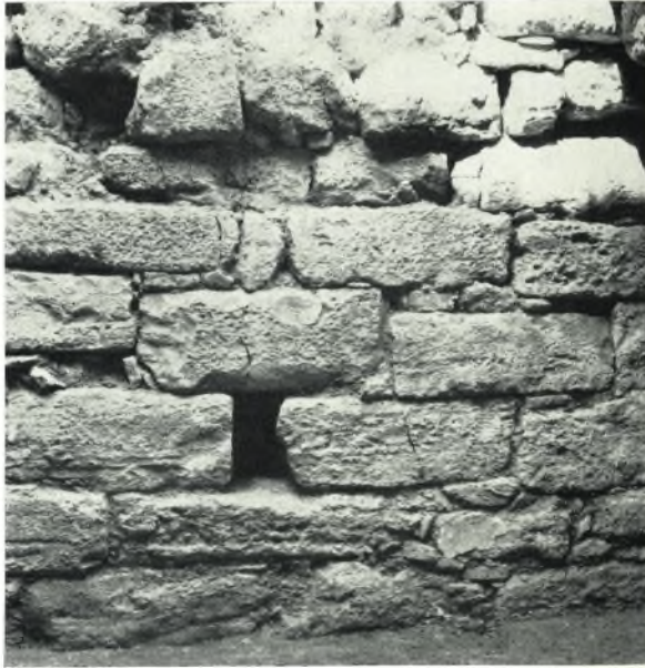
α. Ἡ δυτική πλευρὰ τῆς θόλου. Ἐνιαχοῦ διακρίνεται ἡ ἐκ κονιάματος ἐπίχρσις.