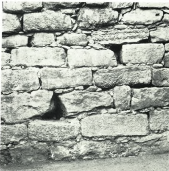
β. Ἡ ἀνατολικὴ πλευρὰ τῆς θόλου. Ἐπὶ τοῦ κατωτάτου δόμου διακρίνεται ἔνιαγού ἢ ἐκ κονιάματος ἐπίχρσις.