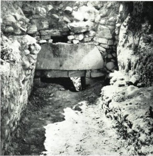
α. Ἡ εἴσοδος τοῦ τάφου καὶ ἡ ἀρχὴ τοῦ δρόμου μετὰ τὴν ἔναρξιν τῆς ἀνασκαφῆς.