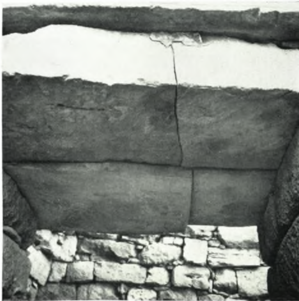
β. Τὸ ὑπέρθυρον ἐκ τῶν ἔξω.