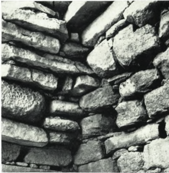
α. Ἡ ΒΑ. γωνία τῆς θόλου. Λεπτομέρεια δομῆς τῆς πυραμιδοειδοῦς ὀροφῆς.