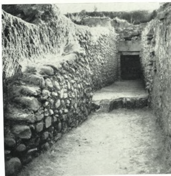
β. Ὁ τάφος μετὰ τὴν ἀνασκαφὴν. Ἐμπροσθεν, ὁ πρὸ τοῦ δρόμου χώρος καὶ ὁ τοῖχος Α.