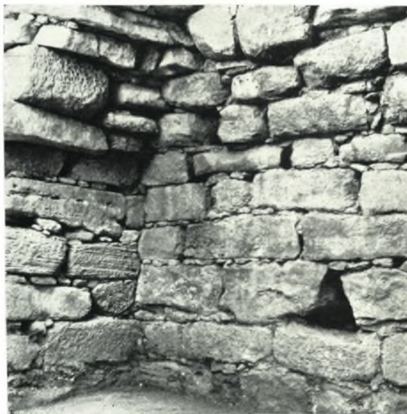
β. Ἡ ΒΑ. γωνία τῆς θόλου.