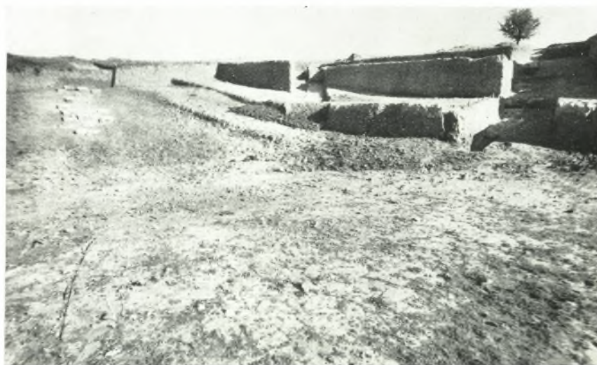
β. Ἀποψις ἐκ τῆς ὀρχήστρας τῶν ἀκτινωτῶν τάφων τοῦ ἀνατολικοῦ τμήματος τοῦ κοίλου τοῦ θεάτρου τῆς Ἡλίδος.