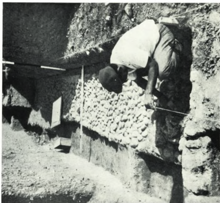
β. Τμήμα χαλικοστρώτου κερκίδος τοῦ κοίλου τοῦ θεάτρου τῆς Ἡλίδος.