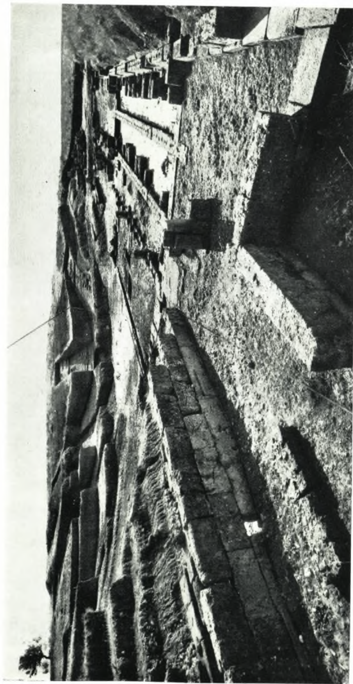
Γενική άποψις τοῦ θεάτρου τῆς Ἡλίδος ἐξ Ἀνατολῶν· εἰς τὸ κοίλον φαίνονται αἱ ἀνοιγέισαι τάρροι.