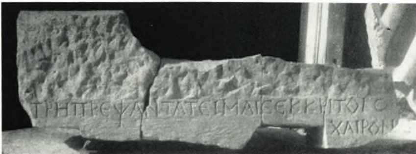
γ. Συγκολληθεῖσα ἐπιγραφή.