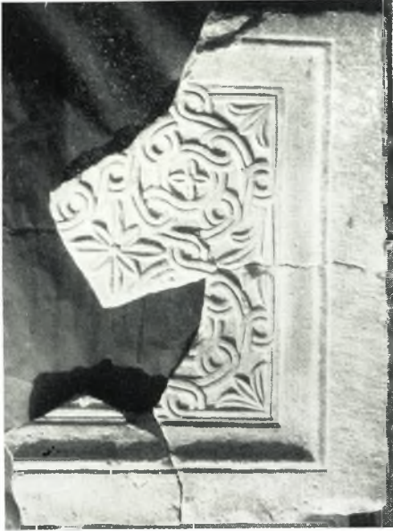
α. Συγκολληθὲν θωράκιον.