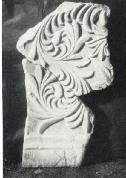
β. Συγκολληθὲν θωράκιον.