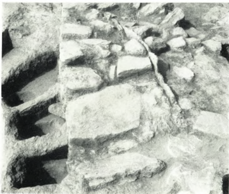
β. Οἱ λουτήρες καὶ ὁ τοῖχος 66 - 11.