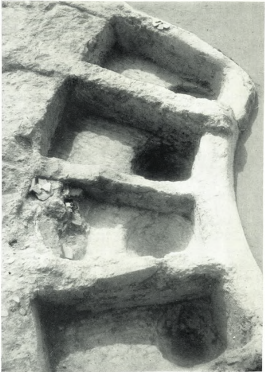
Οι σκαφωτοί λουτήρες.