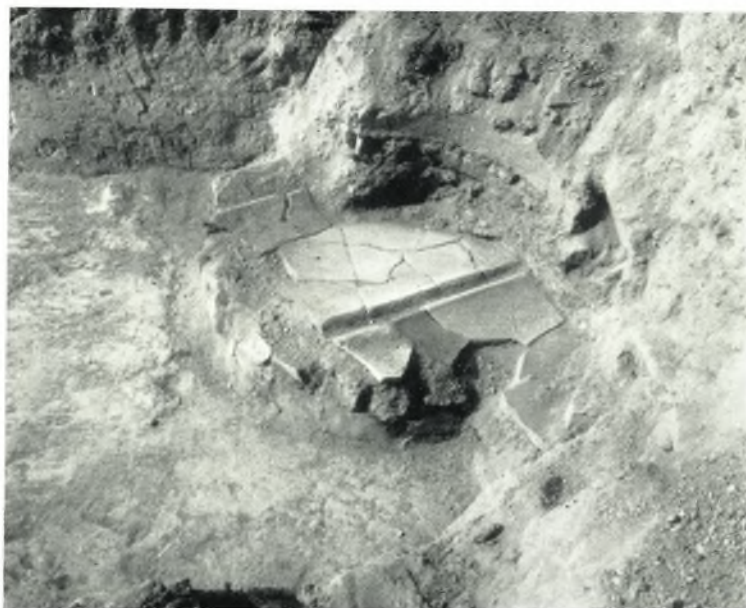
β. Ἡ ἐστία.