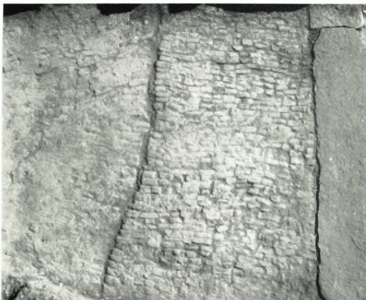
α. Τὸ δάπεδον.