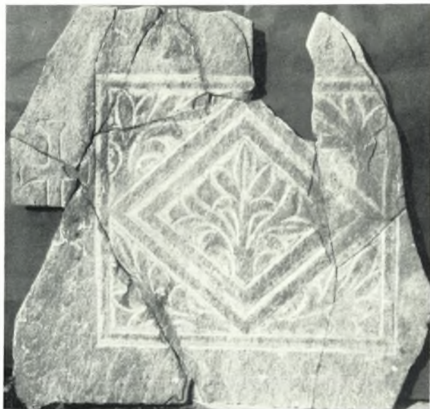
α. Συγκολληθέν θοράκιον.