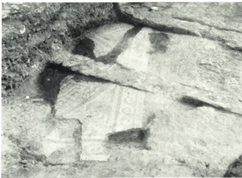
β. Τὸ ψηφιδωτὸν δάπεδον.