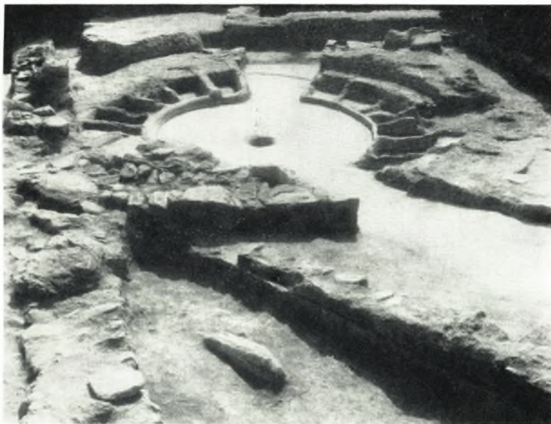
α. Τὸ κυκλικὸν χτίσμα.