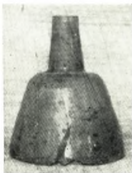
β. Ἄγγειον ἐξ ὑάλου ἐκ τῶν ρωμαϊκῶν τάφων.