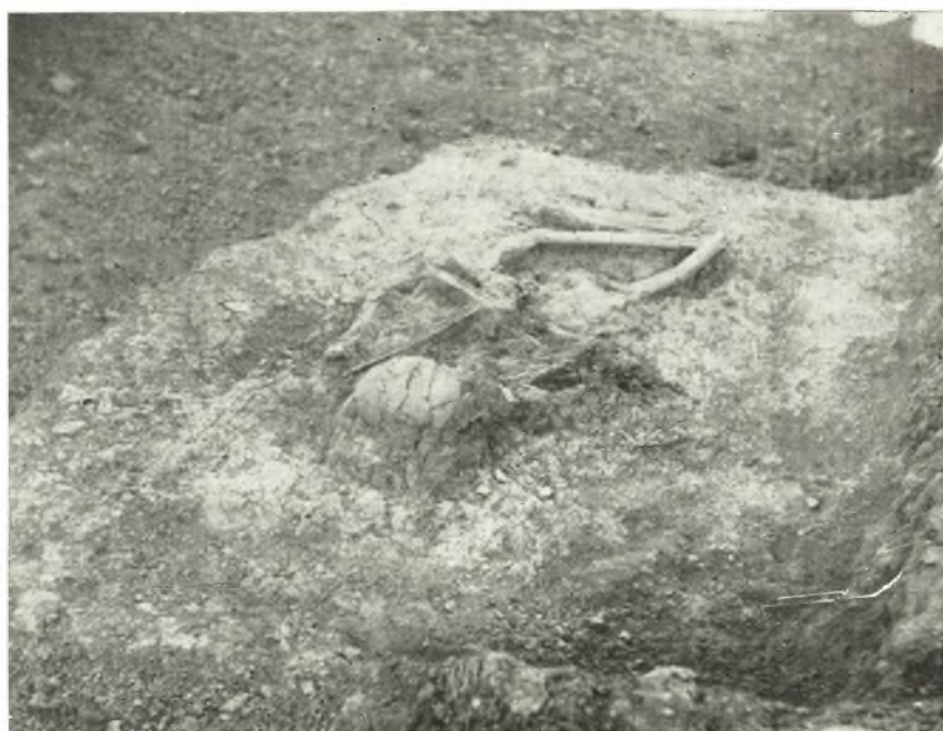
α. *Υπομυκηναϊκός τάφος πρὸ τοῦ δυτικοῦ παρασηνίου.