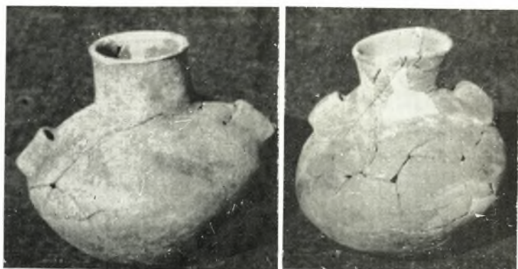
γ. Πρωτοελλαδικὰ ἀγγεῖα θηροειδοῦς τάφου παρὰ τὸ θέατρον τῆς Ἀρχαίας Ἡλίδος.