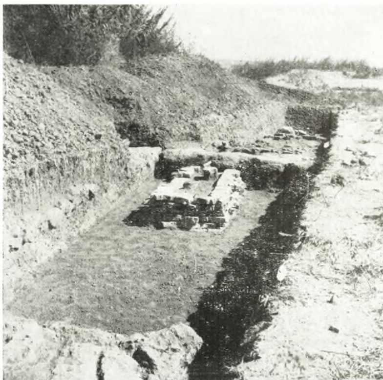
α. Ρωμαϊκοί τάφοι ἐκ τῆς ἐντὸς τετραπλευροῦ κτίσματος δοκιμαστικῆς τάφρου τοῦ ἀνασκαφῆς τοῦ θεάτρου τῆς Ἡλίδος.