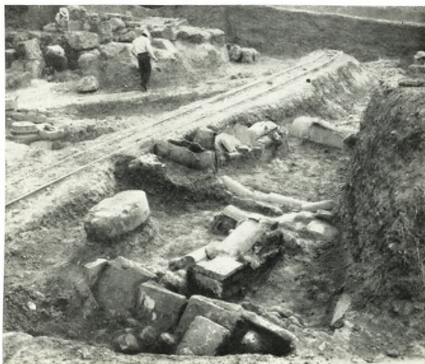
α - β. Σαμαρωτοί τάφοι τοῦ θεάτρου τῆς Ἡλίδος εὐθὺς μετὰ τὴν ἀποκάλυψίν των.