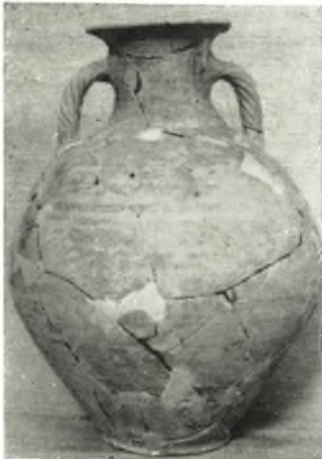
α. Ἀγγεῖον ἐκ τοῦ τάφου 6 πρὸ τοῦ δυτικοῦ παρασκηπίου.