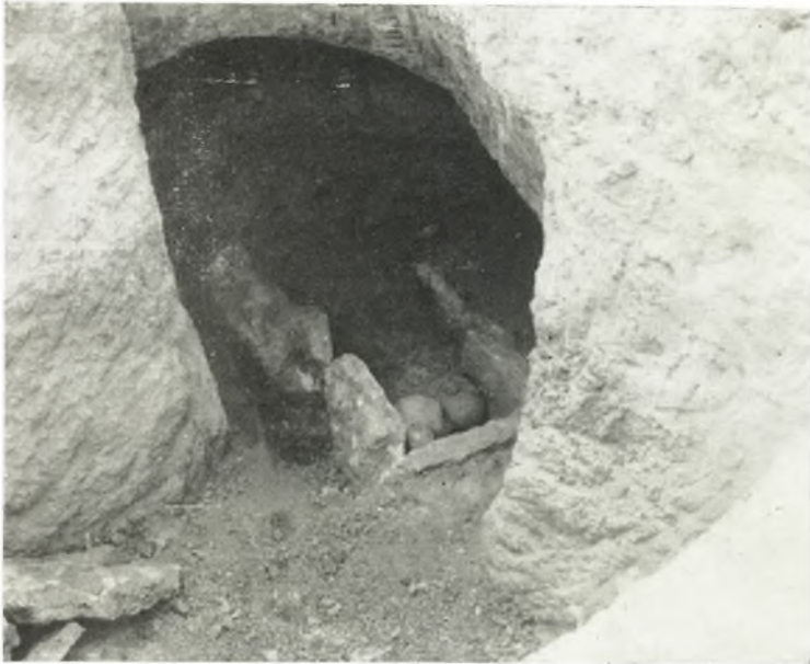
α. Θηκοειδής πρωτοελλαδικός τάφος ἐκ τῆς δοκιμαστικῆς τάφρου τοῦ θεάτρου τῆς Ἡλίδος.