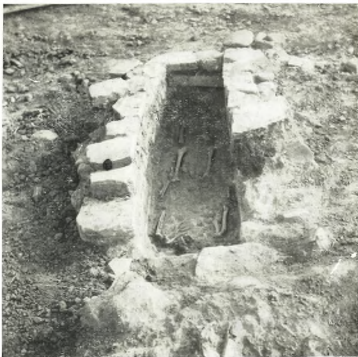
α. Κιβωτιόσχημος ρωμαϊκός τάφος ἐκ τοῦ μεταξύ τοῦ ρωμαϊκοῦ κτίσματος καὶ τοῦ παρασκηνίου τοῦ θεάτρου χώρου.