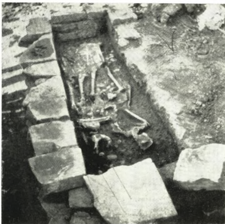
β. Κιβωτιόσχημοι κτιστοὶ τάφοι μετὰ δύο σκελετῶν τῆς δοκιμαστικῆς τάφρου τοῦ θεάτρου.