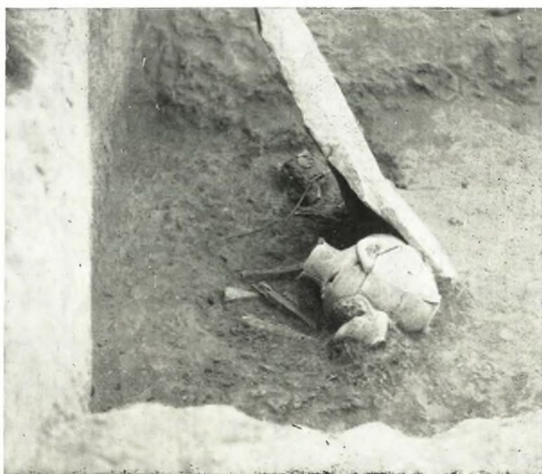
β. *Υπομνηναϊκός τάφος 13α ἐκ τοῦ κοίλου τοῦ θεάτρου τῆς ἀρχαίας Ἡλίδος.