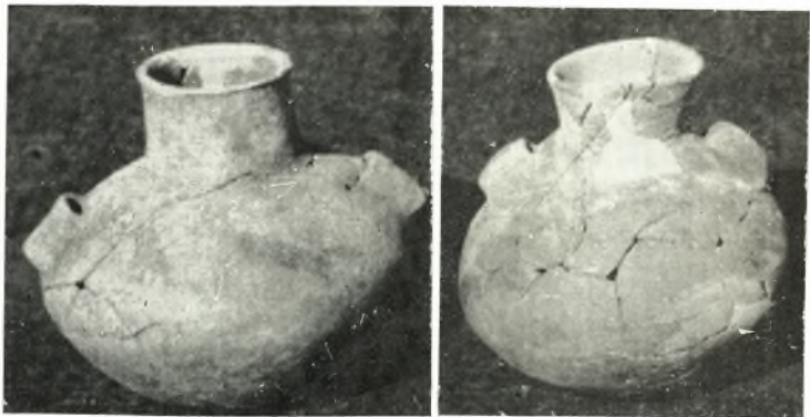
γ. Πρωτοελλαδικὰ ἀγγεῖα θηροειδοῦς τάφου παρὰ τὸ θέατρον τῆς Ἀρχαίας Ἡλίδος.