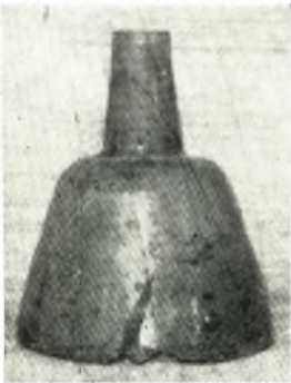
β. Ἄγγειον ἐξ ὕαλου ἐκ τῶν ρωμαϊκῶν τάφων.