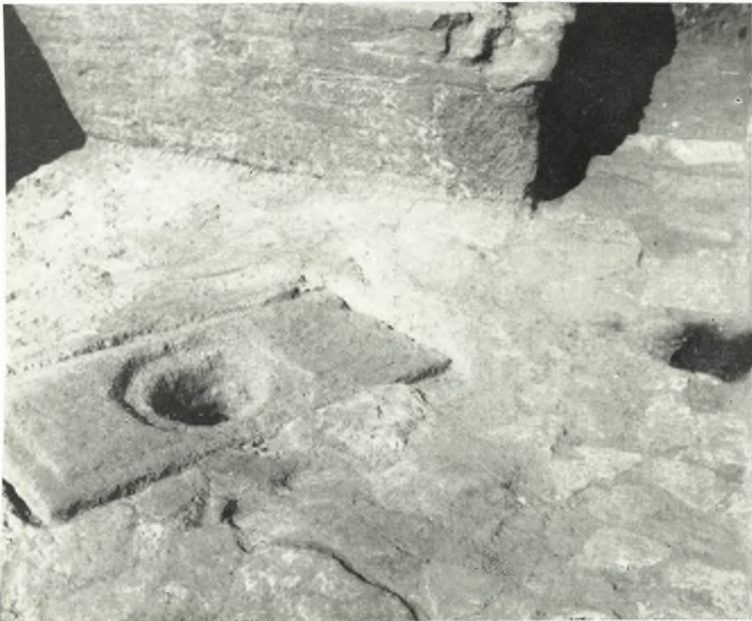
β. Τὸ δάπεδον τῆς δεξαμενῆς τῆς ὀρχήστρας τοῦ θεάτρου τῆς Ἡλίδος.