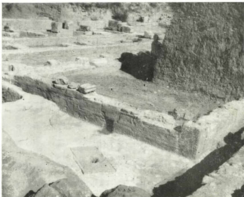
β. Τὸ ρωμαϊκὸν κτίσμα (δεξαμενή) μετὰ τῶν δύο ἀγωγῶν αὐτοῦ.