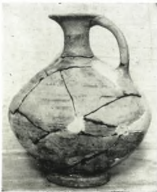
γ. Οἰνοχόη ἐκ τοῦ τάφου 4 τοῦ θεάτρου τῆς Ἡλίδος.