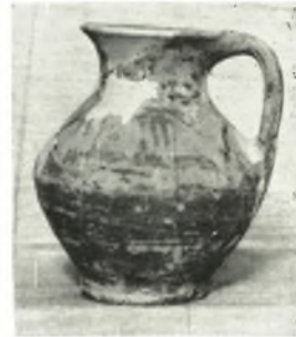
β. Ἐκ τοῦ τάφου ἀρ. 13 τοῦ θεάτρου τῆς Ἡλίδος.