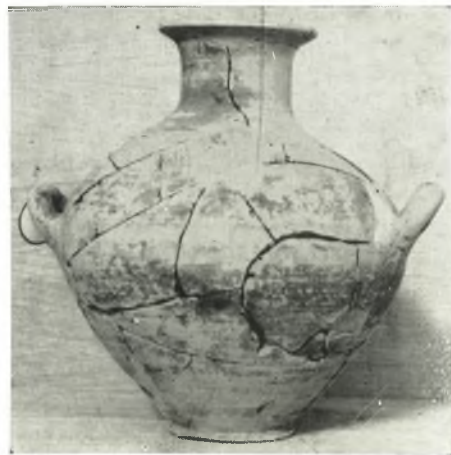
δ. Ἐκ τοῦ τάφου ἀρ. 13α τοῦ κοίλου τοῦ θεάτρου.