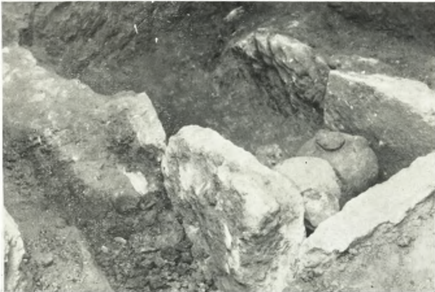
β. Θηκοειδής πρωτοελλαδικός τάφος ἐκ τῆς δοκιμαστικῆς τάφρου τοῦ θεάτρου τῆς Ἀρχαίας Ἡλίδος.