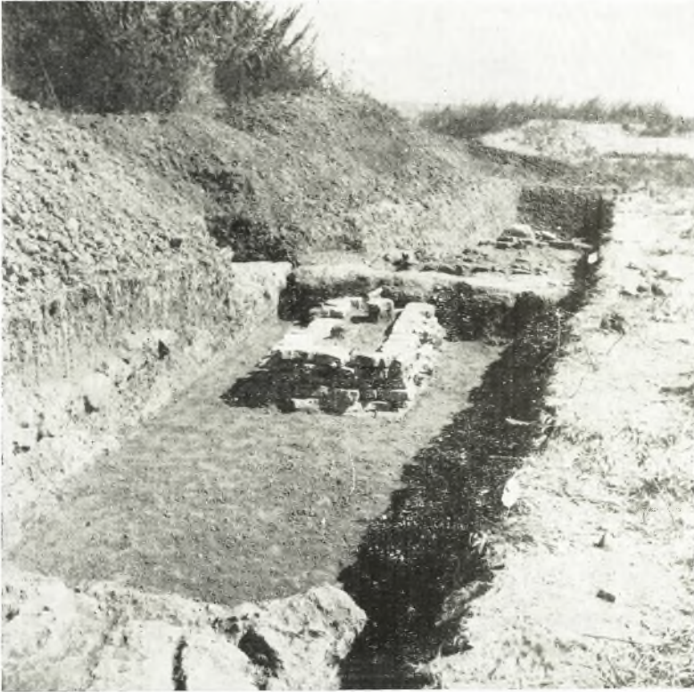
α. Ρωμαϊκοί τάφοι ἐκ τῆς ἐντὸς τετραπλευροῦ κτίσματος δοκιμαστικῆς τάφου τῆς ἀνασκαφῆς τοῦ θεάτρου τῆς Ἡλίδος.