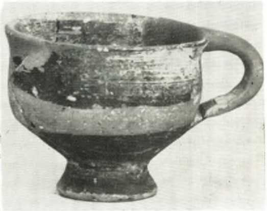
Πρωτογεωμετρικά κύπελλα α. ύψ. 0.056 μ. β. ύψ. 0.045 μ. ἐκ τοῦ συνοικισμού Ἰωλκοῦ.