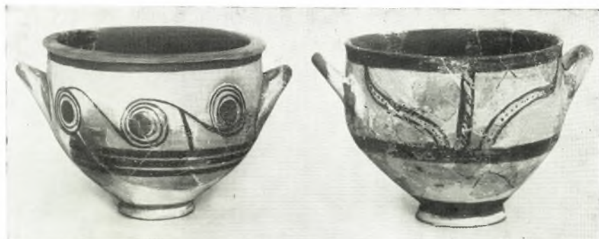
α. Γραπτά μυκηναϊκά ἀγγεία ἐκ τοῦ συνοικισμοῦ (συμπληρωθέντα).