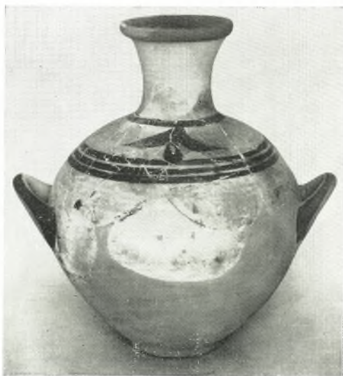
β. Μυκηναϊκὸς κρατὴρ μετὰ προχοῆς (ὑψ. 0.26 μ.). γ. Μυκηναϊκὴ ὑδρία (ὑψ. 0.405 μ.).