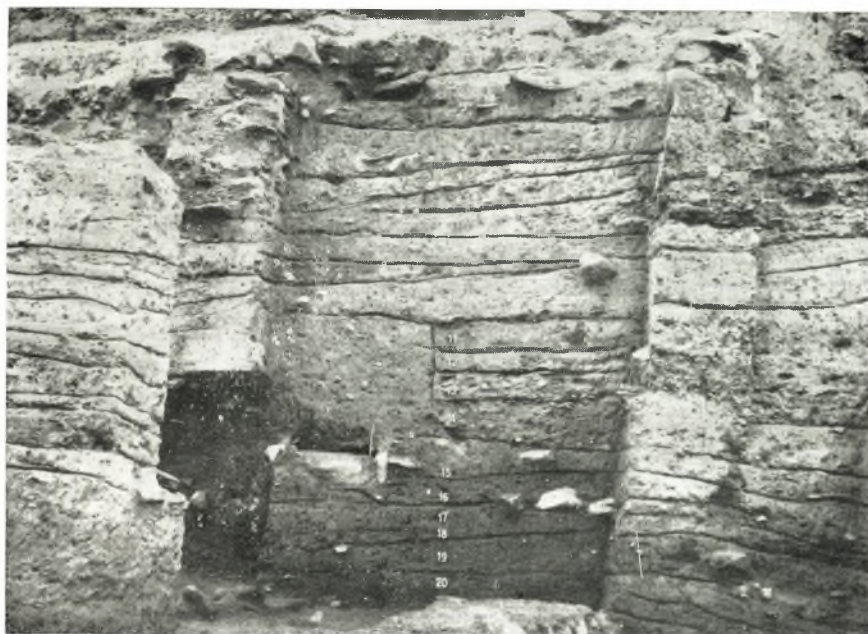
α. Όψις τμήματος της στρωματογραφίας.