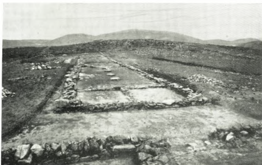
β. Ἀποψις ἀπὸ Νότου τῶν ὑποστυλῶν αἰθουσῶν τοῦ συγκροτήματος Β καὶ τῆς κατὰ μῆκος τῆς πλατείας τάφρου.