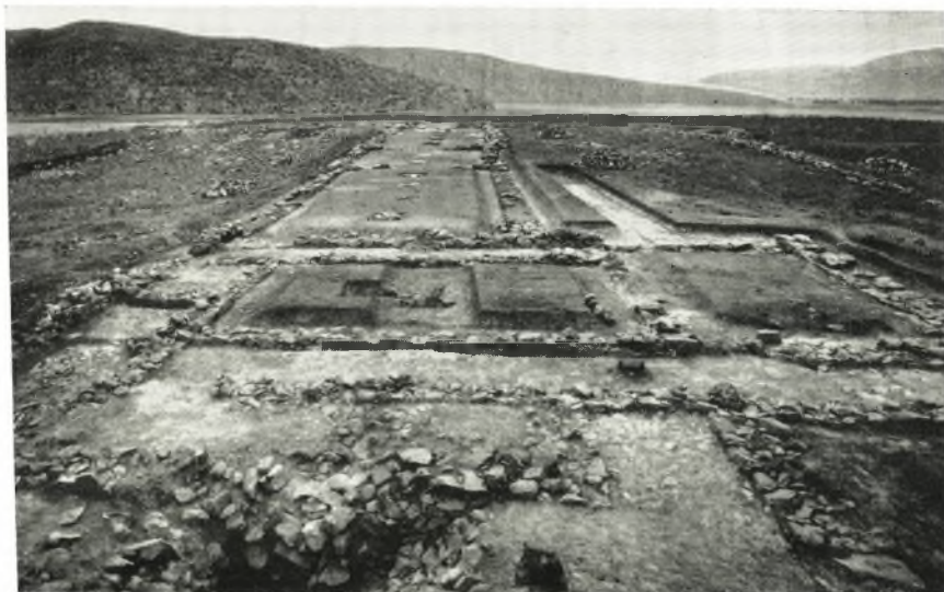
α. Τὸ μέγαρον Ε μετὰ τοῦ πρὸς Δυσμᾶς αὐτοῦ προδόμου καὶ τοῦ εἰς αὐτὸν καταλήγοντος πλακοστρώτου δρόμου.