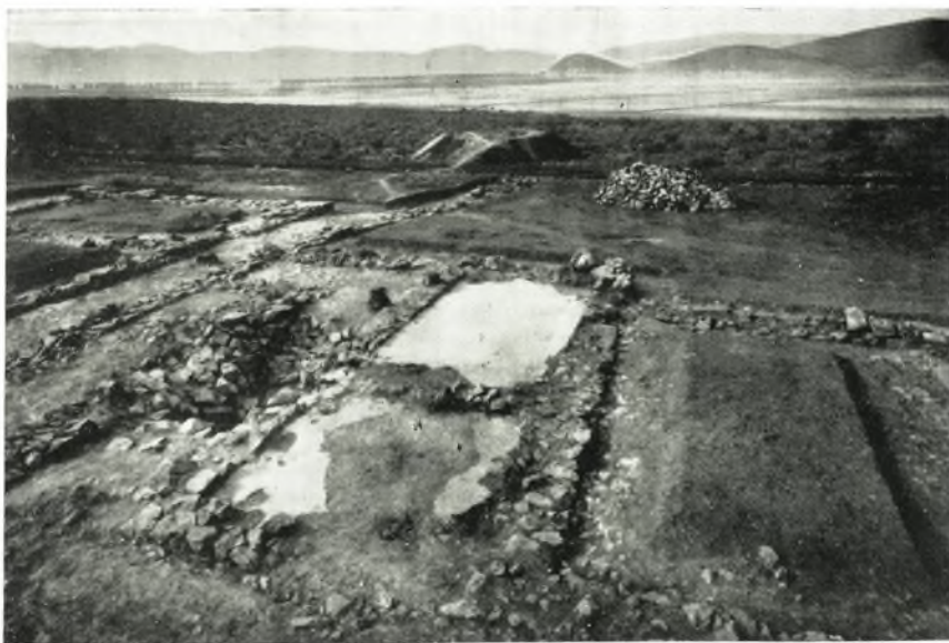
β. Τὸ μέγαρον τοῦ συγκροτήματος Ζ μετὰ τοῦ πρὸς Ἀνατολᾶς αὐτοῦ προδόμου καὶ τὰ σωζόμενα δάπεδα αὐτῶν.