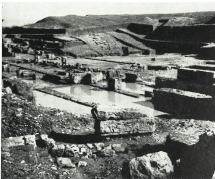
α. Ἀποψις τῆς σκηνῆς, τῆς ὀρχήστρας καὶ τοῦ ἀνατολικοῦ τμήματος τοῦ κοίλου τοῦ θεάτρου τῆς Ἡλίδος.