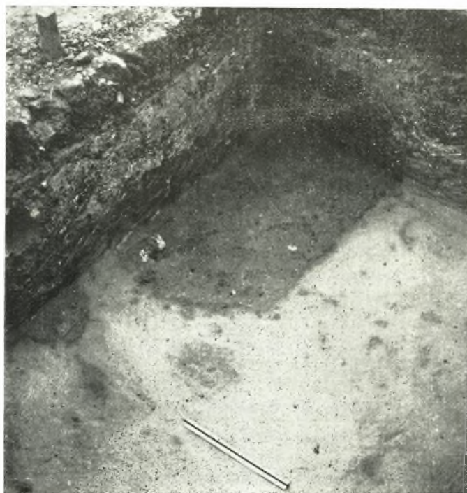
β. Λεπτομέρεια τῆς ἄνω εἰκόνας.