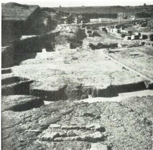
α. Ἀποψις τῆς ὀρχήστρας τοῦ θεάτρου τῆς Ἡλίδος ἐκ τοῦ ἀνατολικοῦ τμήματος τοῦ κοίλου, ἐνθα ἐμφανῇ τὰ λείψανα λιθίνων βαθμίδων (;).