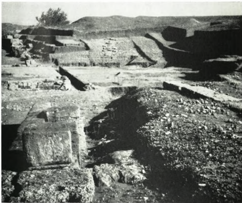
β. Ἀποψις ἐκ Δ. τοῦ θεάτρου τῆς Ἡλίδος μετὰ τοῦ ἀνατολικοῦ τμήματος τοῦ κοίλου, ἐφ' ᾧ τὰ ὑπολείμματα θεμελίων λιθίνων βαθμίδων (;).