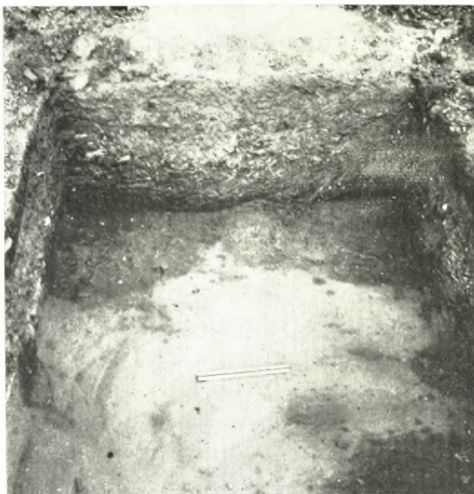
α. Κάτωπις τομῆς ἀρ. 3 πρὸ τοῦ προσκηνίου τοῦ θεάτρου τῆς Ἡλιδος, ἐφ' ἣς σαφῆ τὰ ἴχνη ἀρχαιοτέρων κατακεχωσμένων τάφρων.