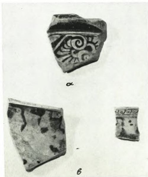
β. αβ τεμάχια ἐρυθρομόρφων κρατῆρων, ἐκ τῆς τάφρου παρὰ τὴν ΒΔ. γωνίαν τῆς δυτικῆς παρόδου τοῦ θεάτρου τῆς Ἡλίδος.