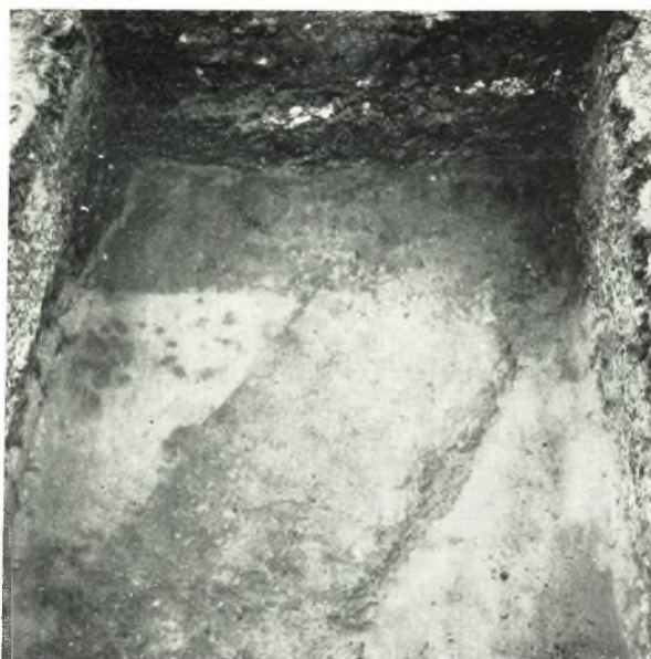
α. Κάτοψις τομῆς ἀρ. 2 πρὸ τοῦ προσκηνίου τοῦ θεάτρου τῆς Ἡλίδος, ἐφ' ἣς σαφῆ τὰ ἴχνη ἀρχαιοτέρων κατακεχωσμένων τάφρων.