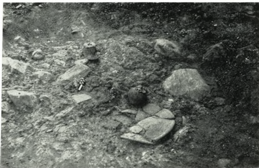
β. Πρόχους και ἀνεστραμμένα ἀγγεῖα.