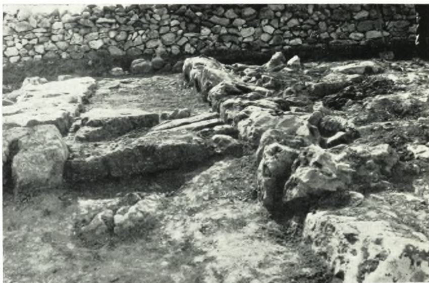
α. Διάδρομος ΥΜ Ι οικίας παρά τὸ Γάζι.