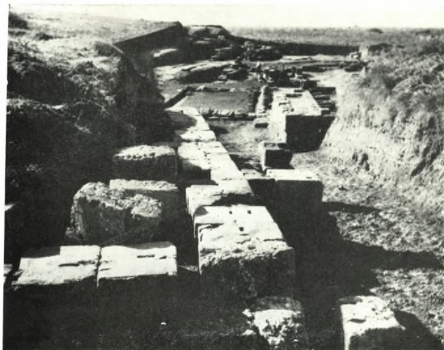
α. Τὸ ἀνάλημμα τῆς Α. παρόδου τοῦ θεάτρου τῆς Ἑλιδος, μετὰ τὴν ἀποκατάστασιν αὐτοῦ.