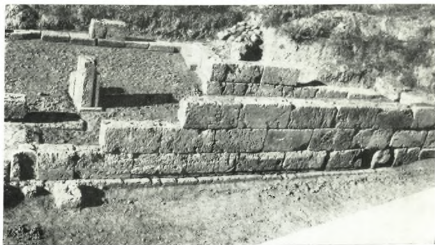
β. Τὸ ἀνατολικὸν παρασκήνιον τοῦ θεάτρου τῆς Ἑλιδος μετὰ τὴν ἐπανατοποθέτησιν τῶν δόμων.