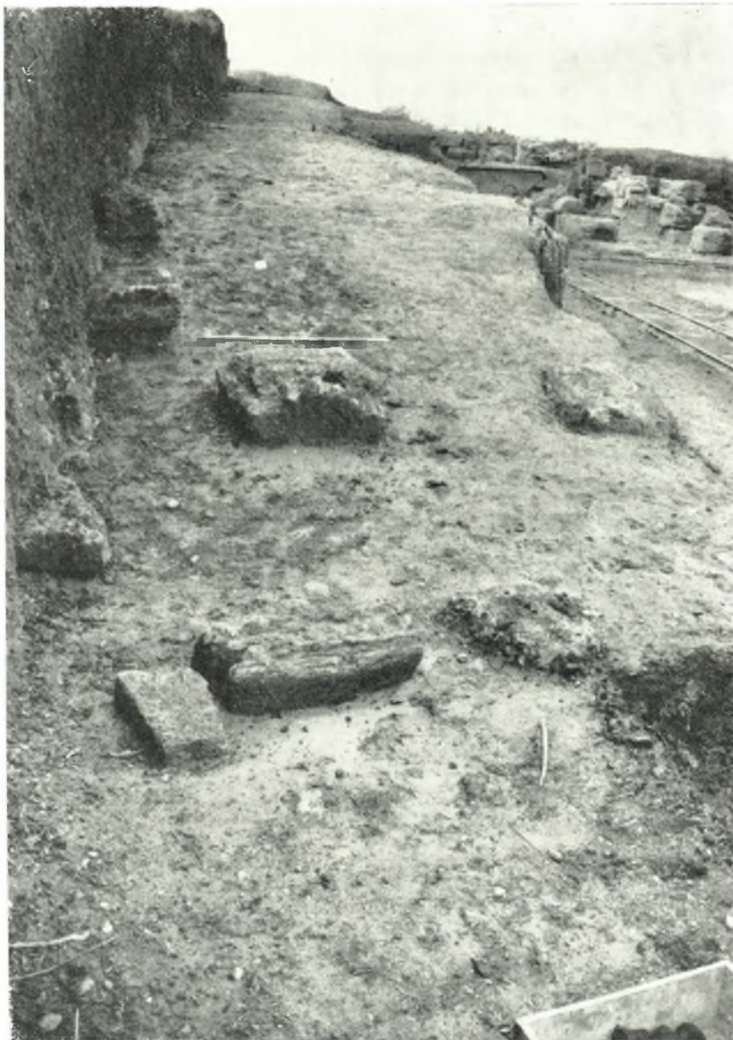
Τὰ θεμέλια ἐδωλίων τοῦ κοίλου.