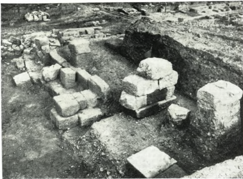
α. Τὰ ἀναλήμματα α' και β' φάσεως τῆς δυτικῆς πλευρᾶς τοῦ κοίλου τοῦ θεάτρου τῆς Ἡλίδος.