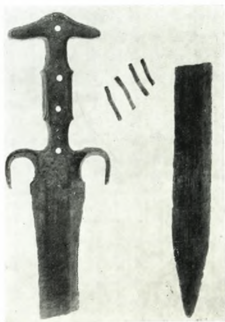
γ. Χαλκοῦν ξίφος ἐκ τοῦ τάφου 4.