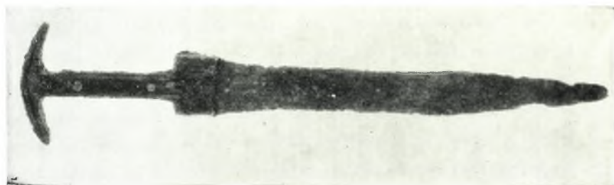
β. Χαλκοῦν ἐγχειρίδιον ἐκ τοῦ τάφου 1.