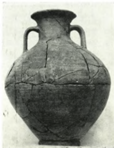
δ. Ἀμφορεὺς ἐκ τοῦ τάφου 2.