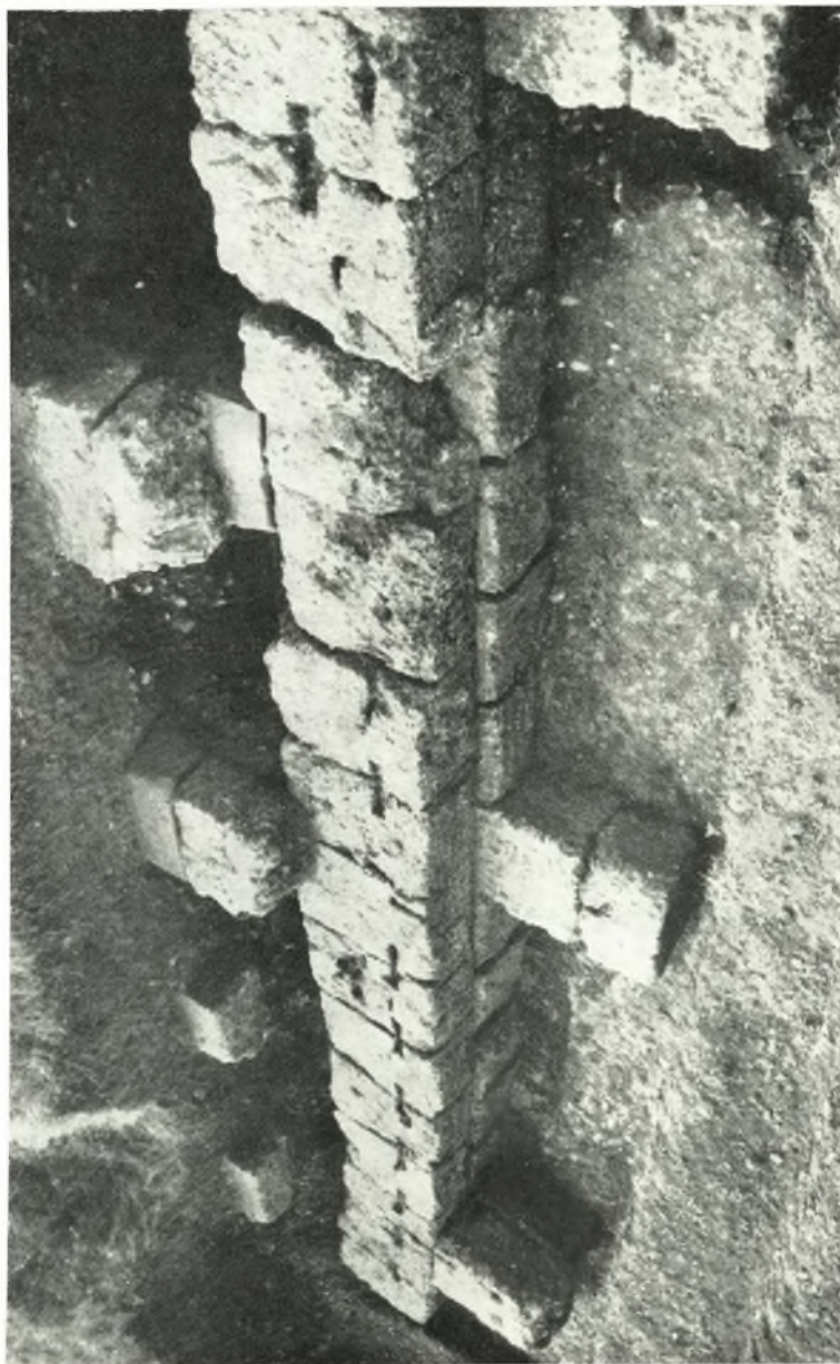
‘ΙΙ ΝΔ. άκρα τοῦ ἀνατολικοῦ ἀναλήμματος τοῦ κοίλου.