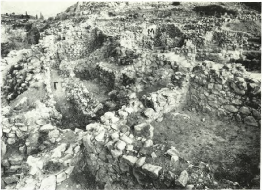
α. Ἡ ἀνασκαφεῖσα ἑκτασίς νοτίως τοῦ βορείου κυκλωπέου τείχους.