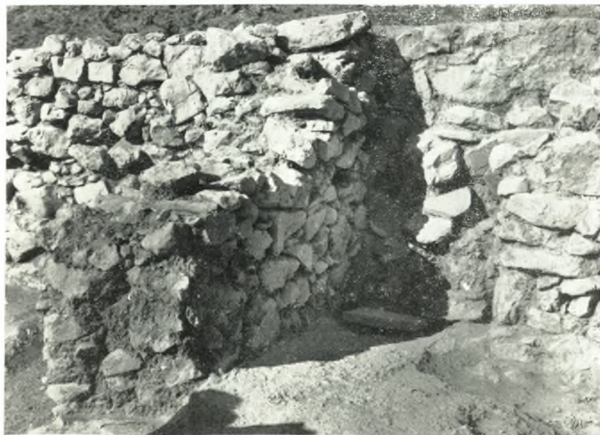
β. Ὑπολείμματα κλίμακος εἰς τὴν ΒΔ. γωνίαν τοῦ δωματίου Μ-3.