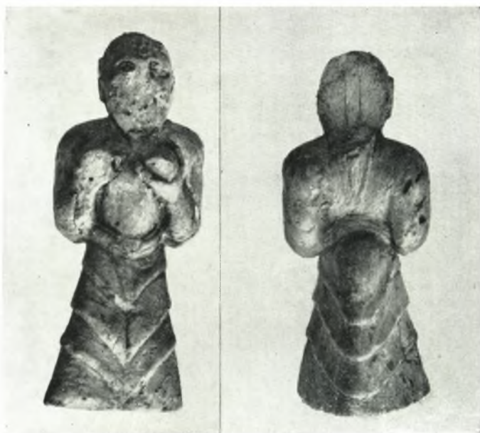
β. Ειδώλιον ἐξ ἐλεφαντοστοῦ· α. προσθία ὄψις, β. ὀπισθία ὄψις.