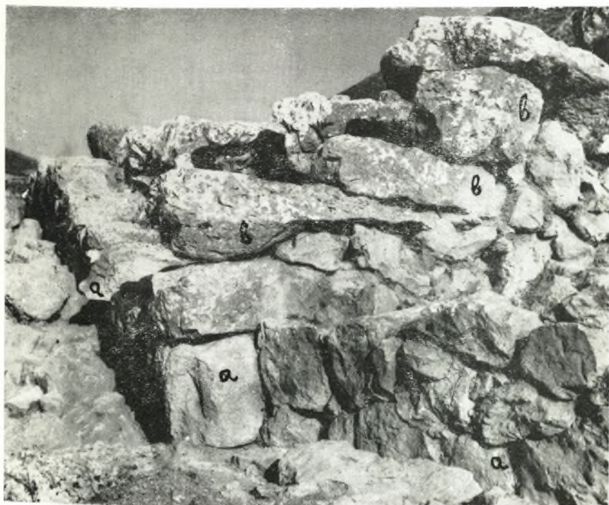
β. Ἡ ΒΔ. γωνία τοῦ ἀναλημματικοῦ τοίχου (α - α) τῆς ἀρχαῖκῆς ἐποχῆς. β - β. θεμέλια ἐλληνιστικοῦ ναοῦ.