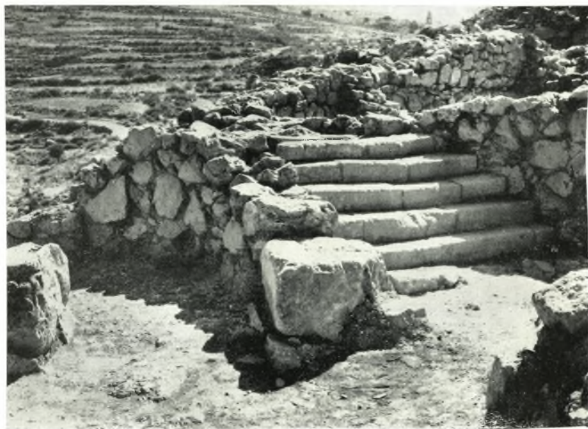
β. Κλίμαξ καὶ κυκλικὸς διάδρομος.