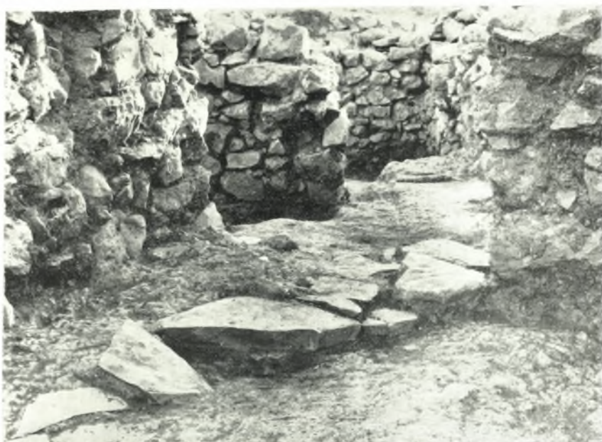
α. Ἐξωτερικὴ εἴσοδος εἰς τὸ δωμάτιον Μ-3 (β).