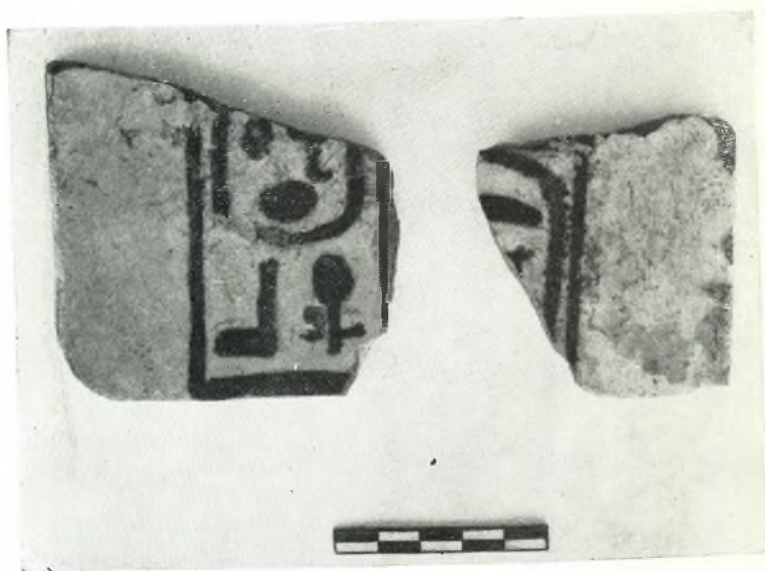
β. Τεμάχια αἰγυπτιακῆς ἐνεπιγράφου πινακίδος.