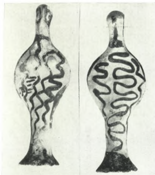
α. Ειδώλιον τύπου Φ.