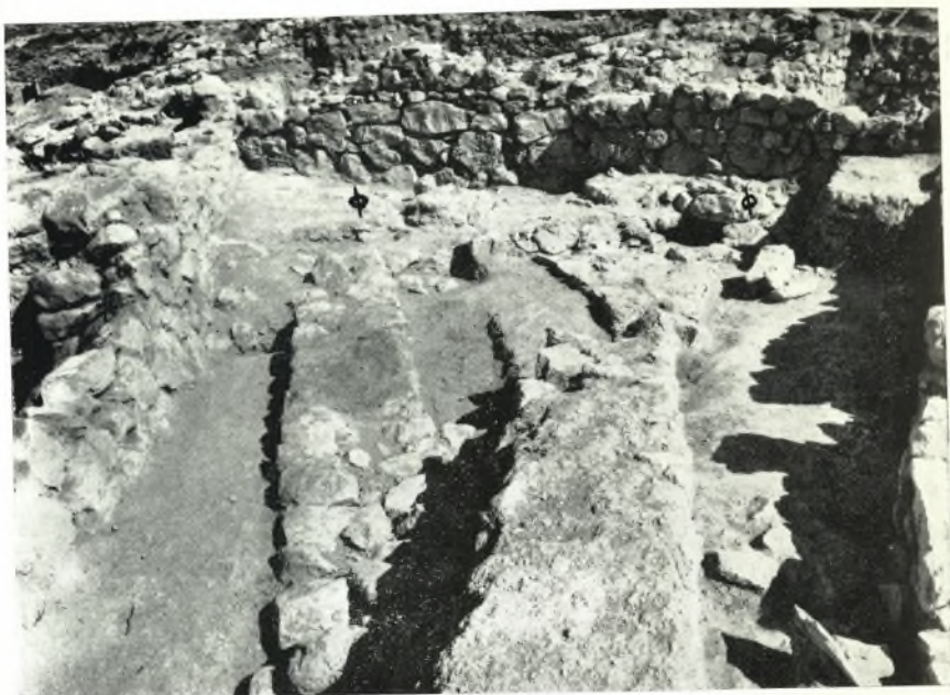
α. Ὑπαίθριος τριγωνικὸς χώρος ἢ αὐλὴ πρὸς Ἀνατολὰς τοῦ κτηρίου Μ. Φρεάτια ὀχετῶν, Φ.