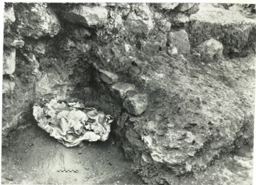
α. Μολύβδινον σκεῦος ἐκ τοῦ Μ-3.