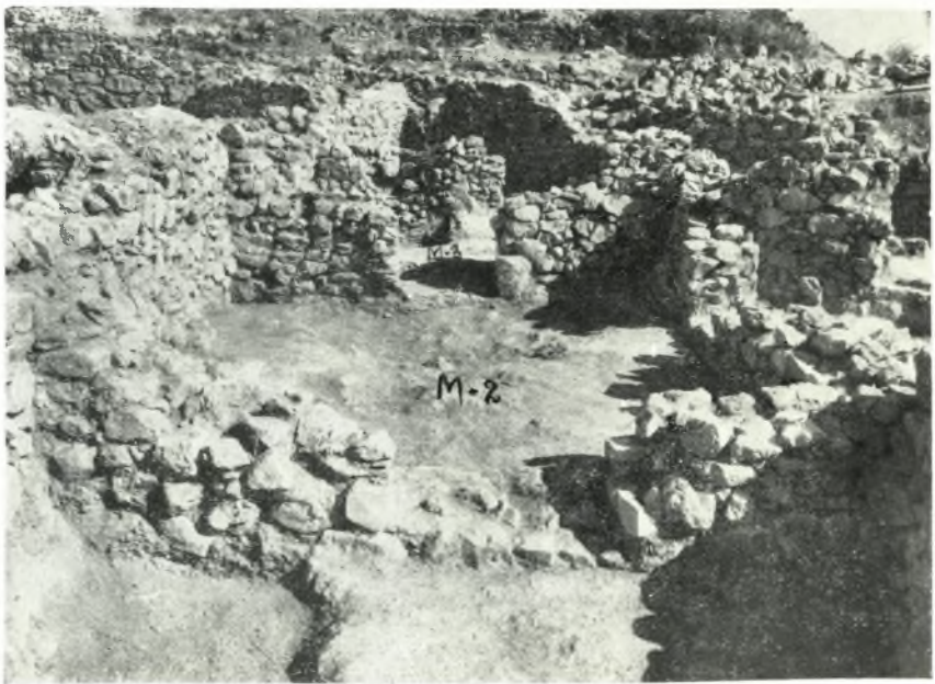
β. Κτήριο Μ. Κεντρικὸν δωμάτιον Μ-2 καὶ πρὸς Ἀνατολὰς δωμάτιον Μ-3.