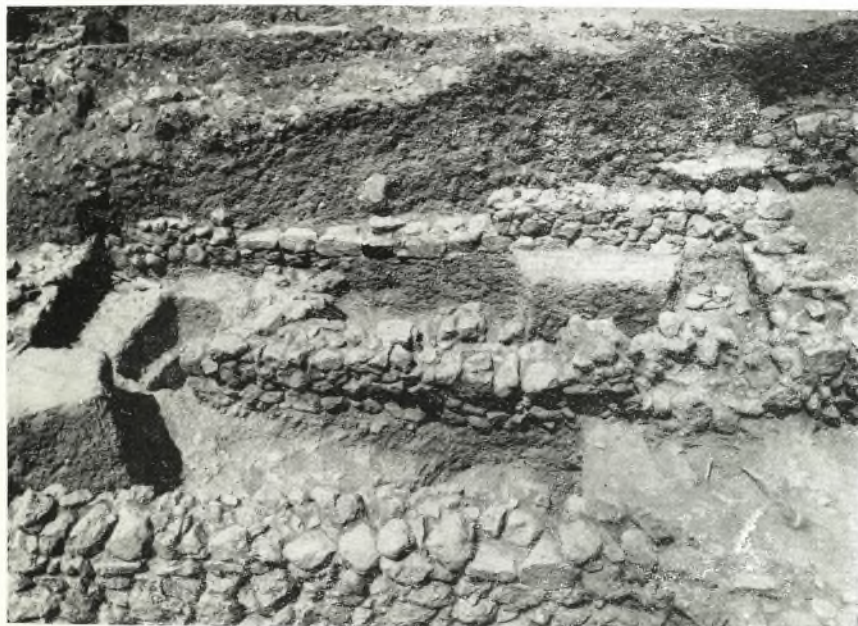
α. Τοῖχοι καὶ τάφος τοῦ δαπέδου τοῦ οἰκήματος I-2.