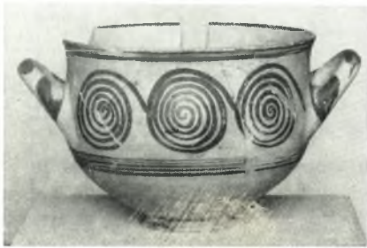
β. ΥΕ ΙΙΙ σκύφος.