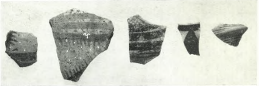
α. Θραύσματα νεολιθικών αγγείων.