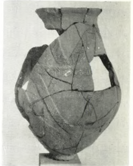
β. Προϊστορικός πτεῖθος ἐκ τοῦ βωμοῦ.