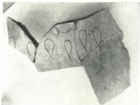
α. Ἀπόσπλημα πίθου.