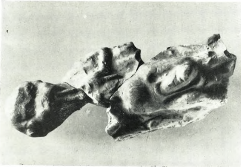
α. Πήλινον εἰδώλιον Πανός ἀλιητοῦ.