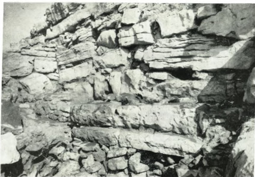
β. Ό πρὸ τῆς κυρίας πύλης τοῦ τείχους Δυμαίων βωμὸς ἀπὸ Ν.