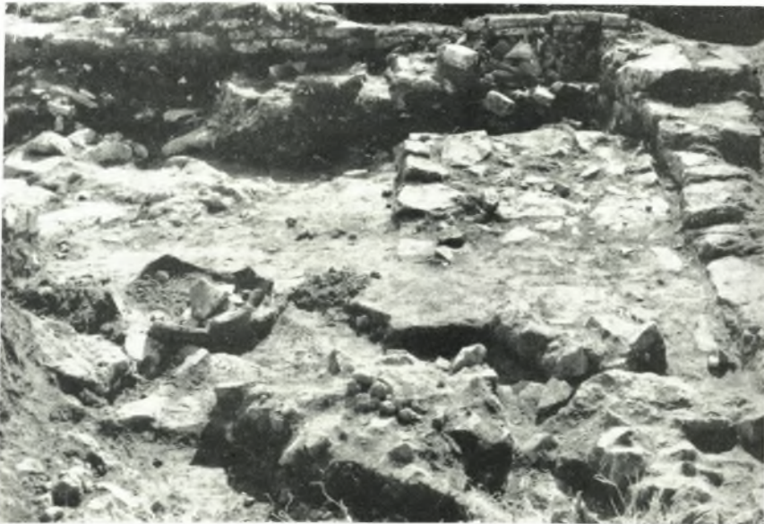
β. 'Η μυκηναϊκή οικία από Α.