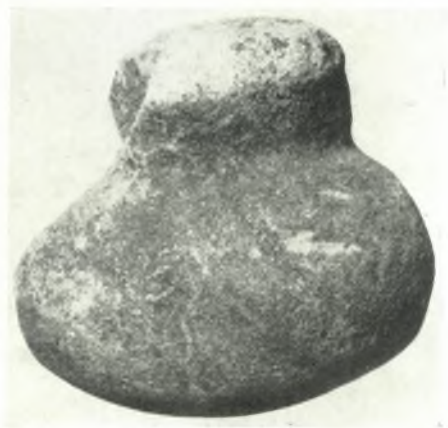
ε. Λίθινον ΠΕ ειδώλιον.