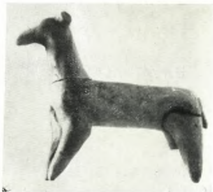
β. Πήλινον ειδώλιον κυνός.