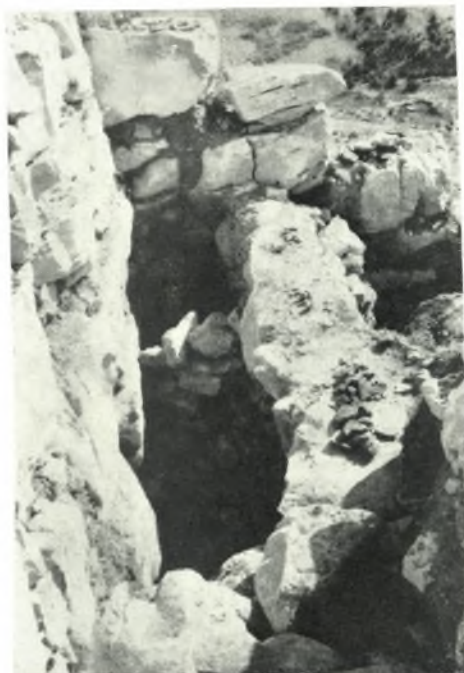
α. Ό βωμὸς κατὰ τὴν ἀνασκαφὴν ἀπὸ ΝΑ.