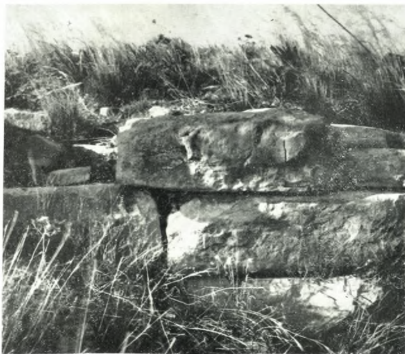
γ. Ἐρείπια τοῦ τείχους τῆς Δύμης ἐν θέσει Καραβοστάσι.