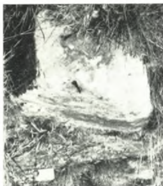
β. Ἡ Β. πλευρὰ τοῦ ναοῦ ἐκ λιθοπλίνθων μετὰ συνδέσμων διπλοῦ πελέκεως.