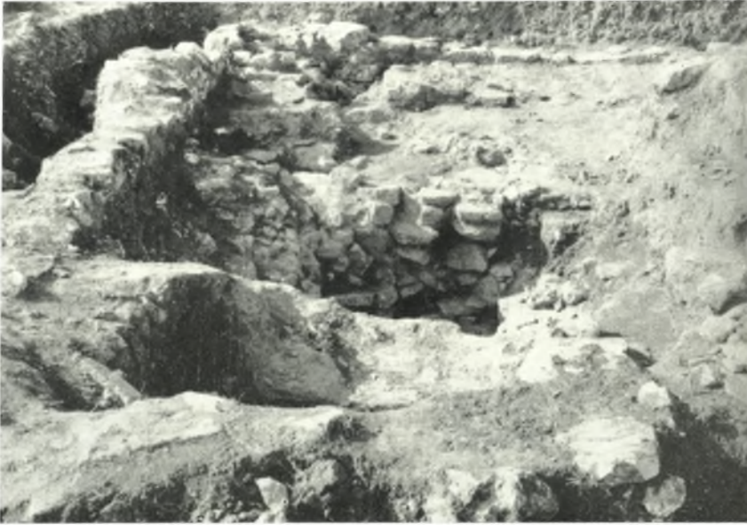
α. 'Η μυκηναϊκή οικία από Ν.