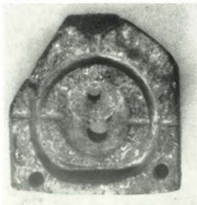
δ. Λιθίνη μήτρα δακτυλίου.