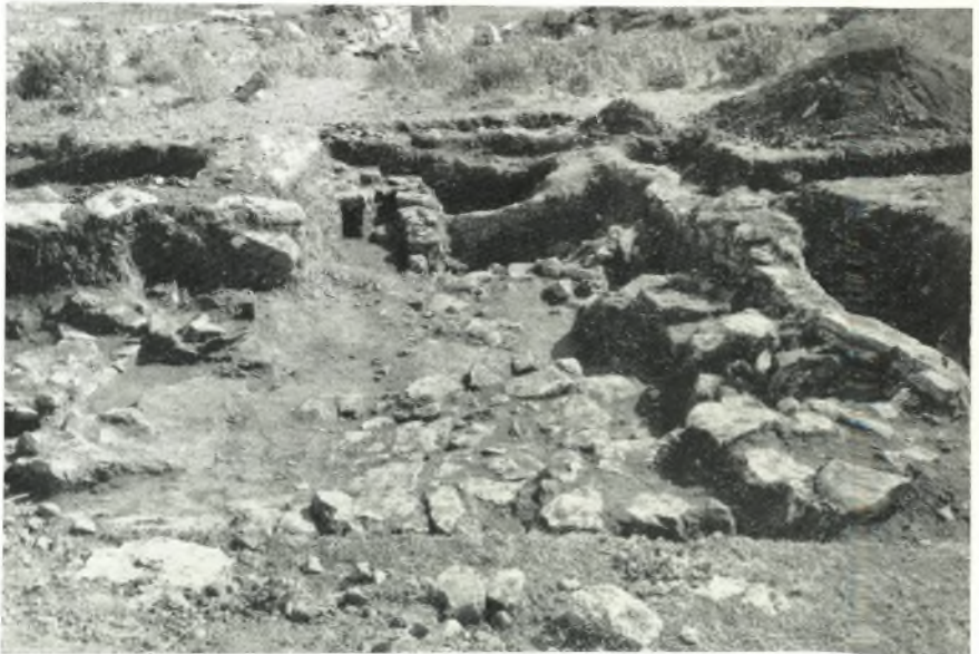
γ. Ἡ μυκηναϊκή οἰκία ἀπὸ Β.