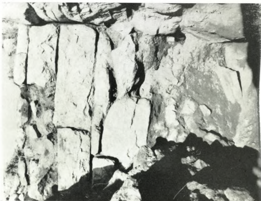
α. Ἡ ἐξω παρεπὶ τοῦ ἐξωτερικοῦ ἐγκαρσίου τοίχου.