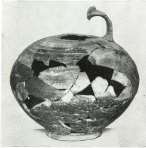
α. Ύπομυκηναϊκή (?) οίνοχόη ἐκ τοῦ βωμοῦ.