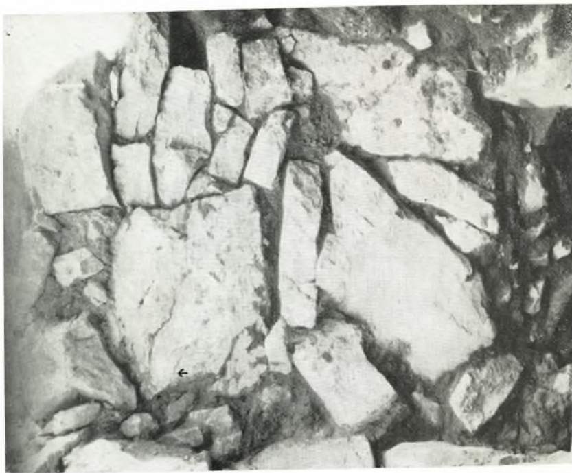
β. Ἡ ἔσω παρεπὶ τοῦ ἐξωτερικοῦ ἐγκαρσίου τοίχου (τὸ βέλος δεικνύει τὴν θέσιν πῆς ἐγγυράτου πριάντης).