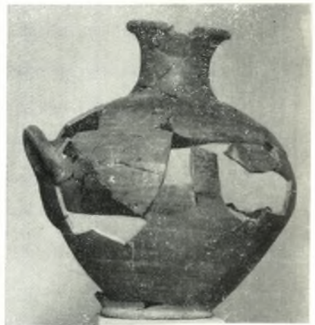
ε. ΥΕ ΙΙΙ ύδρία.