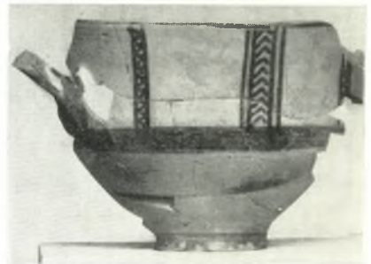
γ. ΥΕ ΙΙΙ σκύφος.