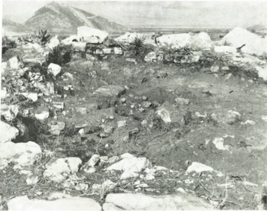
β. Τὸ πρὸς Α. ἐπὶ τοῦ πάχους τοῦ τείχους δοματίων τῆς οἰκίας ἱστορικῶν χρόνων.