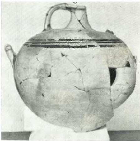
δ. ΥΕ ΙΙΙΓ ψευδόστομος άμφορεύς.