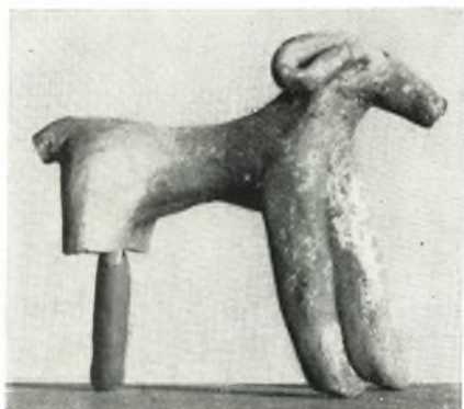
α. Πήλινον ειδώλιον κριοῦ ἐκ τοῦ βωμοῦ.