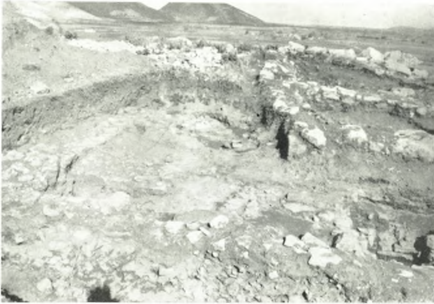
α. Ή ἐκ δύο δοματίων οἰκία ἱστορικῶν χρόνων ἀπὸ Δ.