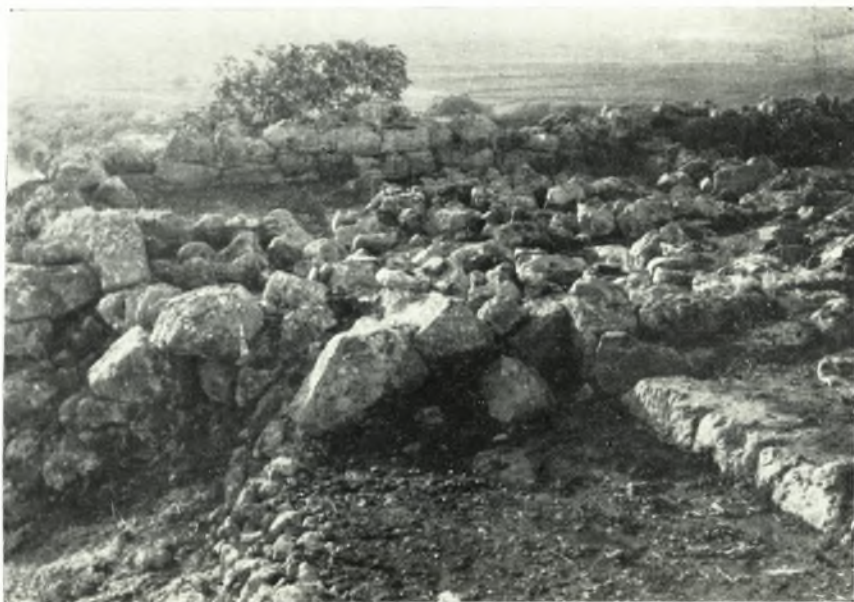
α. Οἱ χώροι λ, μ, ν, νοτίως τῆς αὐλῆς, δρώμενοι ἀπὸ Ἀνατολῶν.