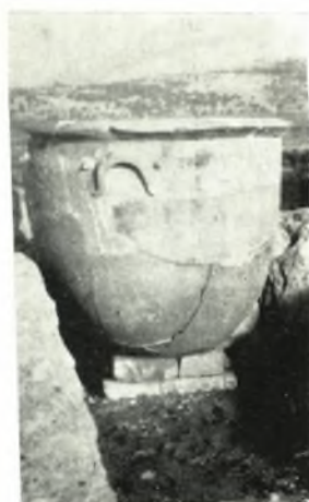
γ. Λουτήριον πρὸ τῆς εἰσόδου Ζ.