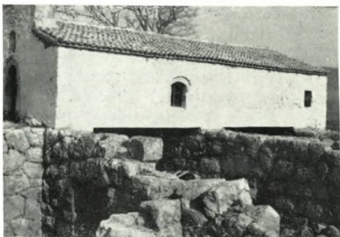
β. Ὁ ὑπεράνω τῶν ἐρείπων τοῦ νεκρομαντείου χριστιανικὸς ναὸς μετὰ τὴν ὑποστύλωσίν του.