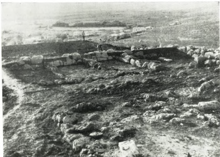
α. Δυτική πλευρά τοῦ τεμένους.