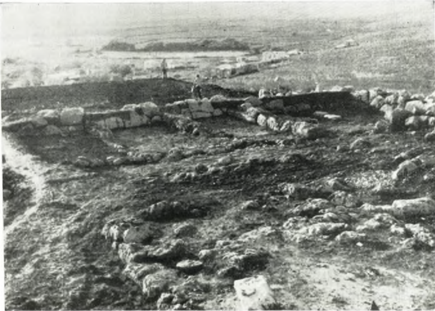
α. Δυτική πλευρά τοῦ τεμένους.