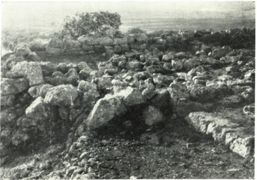
α. Οἱ χῶροι λ, μ, ν, νοτίως τῆς αὐλῆς, δρώμενοι ἀπὸ Ἐνατολῶν.