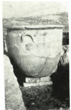
γ. Λουτήριον πρὸ τῆς εἰσόδου Ζ.