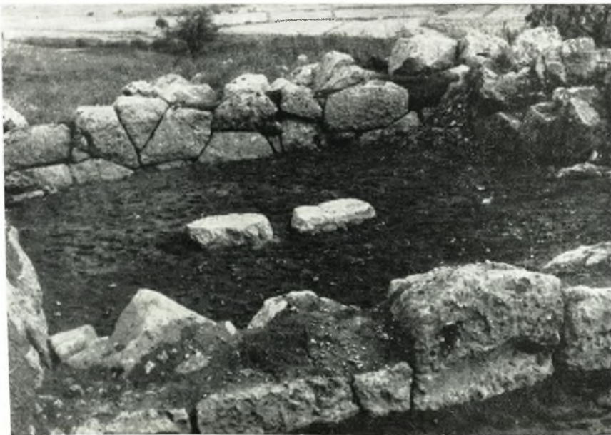
β. Τὸ δωμάτιον κ, δρώμενον ἀπὸ Νότου.