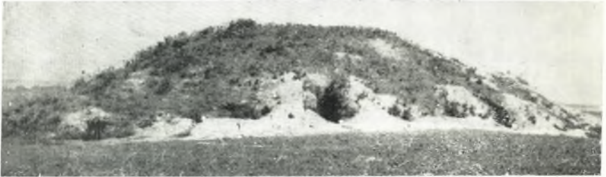
α. Τύμβος Νικησιάνης, νοτία πλευρά, κατά τήν ἔναρξιν τῆς ἀνασκαφῆς.