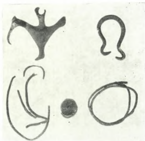
α. Χαλκοῦν ἔλασμα με μορφήν πτηνοῦ, ἐλάσματα ἐκ ψελίων καὶ πόρπης καὶ λαβὴ ἀγγείου ἐκ χαλκοῦ.