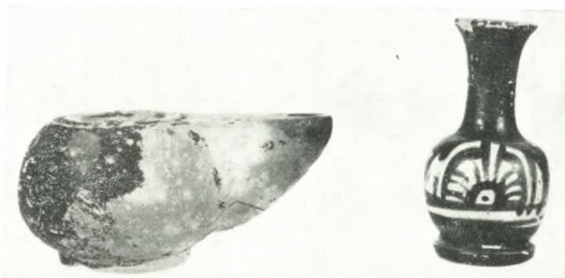
β. Μελαμβαφῆς λύχνος καὶ ἀρυβαλλοειδὲς ληκύθιον τοῦ 4ου π.Χ. αἰῶνος ἐκ τῆς ἐπιχώσεως τοῦ τύμβου Νικησιάνης-Παγγαίου.