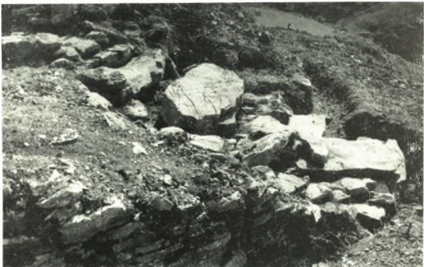
β. Δρόμος τοῦ θολοῦ τῆς τάφου Β.