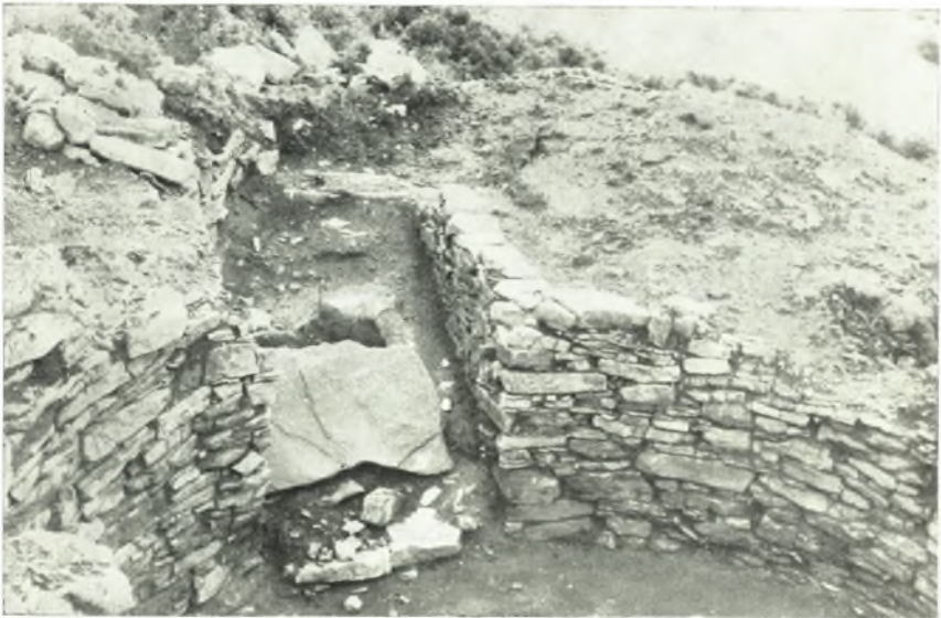
α. Θολωτός τάφος Α, Φαρῶν Ἀγαίης.