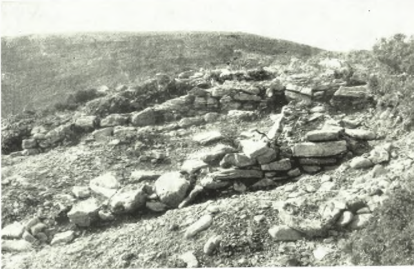
α. Λείψανα προϊστορικῶν οἰκιῶν εἰς Καταρράχτην Φαρῶν.