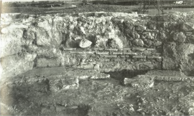
α. Δάπεδον τῆς κόγχης τοῦ βήματος (ἐκ Β.).