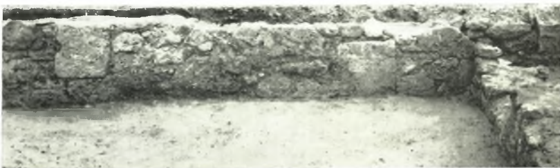
β. Τοιχοδομία τοῦ ἐξωτερικοῦ μακροῦ τοίχου τῆς κατοικίας. *Ὅφιν ἐσωτερική (ἐκ Β.).