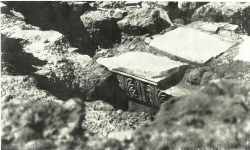
β. Γεῖσον ἐντειχισμένον εἰς τὴν κόγχην μεταγενεστέρας ἐκκλησίας.