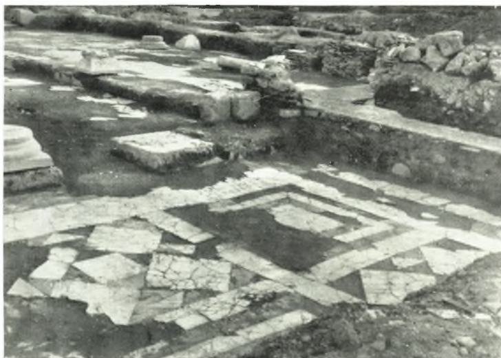
α. Ἀπομῆς τοῦ νοτίου περσοῦ (ἐκ τοῦ νοτίου κλίτους).