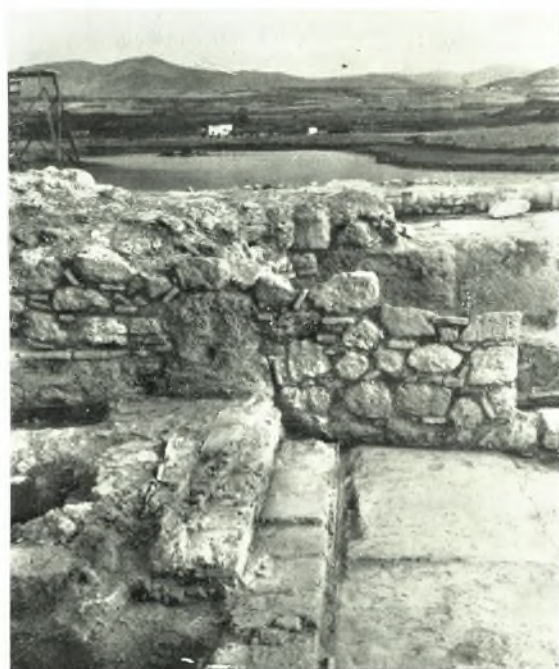
β. Βαθμῆς πρὸ τῆς κόγχης τοῦ βήματος. Νότιον ἄκρον (ἀπομῆς ἐκ Β.).