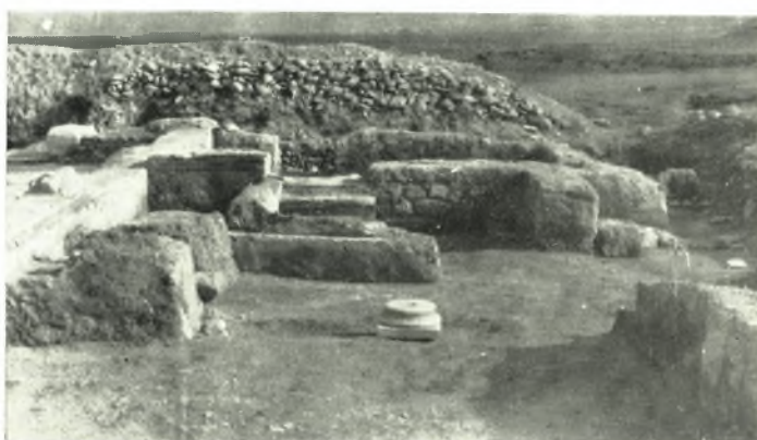
β. Χῶροι τῆς κατοικίας (ἐκ Δ).