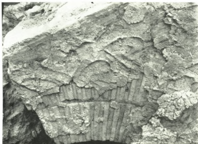
β. Λεπτομέρεια τῆς μάζης ἐκ τοῦ τεταρτοσφαιρίου τῆς κόγχης.