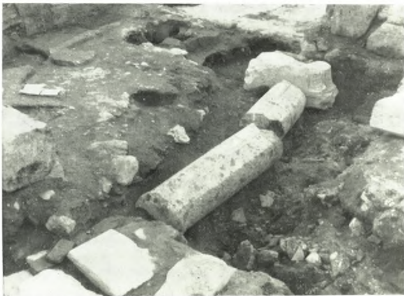
α. Ἡμισκίον καὶ προβολοειδές κιονόκρανον (ἐκ ΒΑ.).