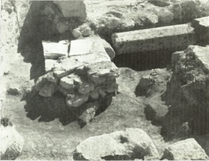
α. Λείψανα κογχῶν μεταγενεστέρων ἐκκλησιῶν ἐντὸς τῆς κόγχης τοῦ βήματος (ἐκ Β.).