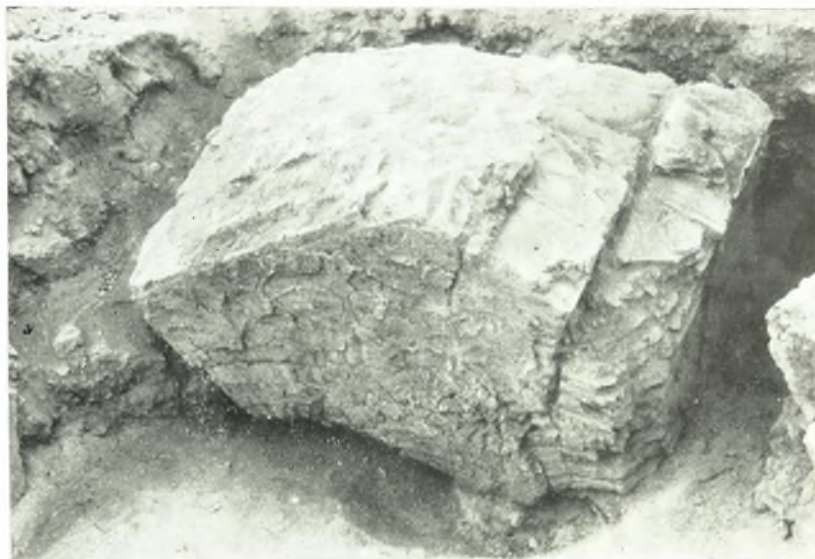
α. Μάζα ἐκ τοῦ τεταρτοσφαιρίου τῆς κόγχης τοῦ ἱεροῦ.