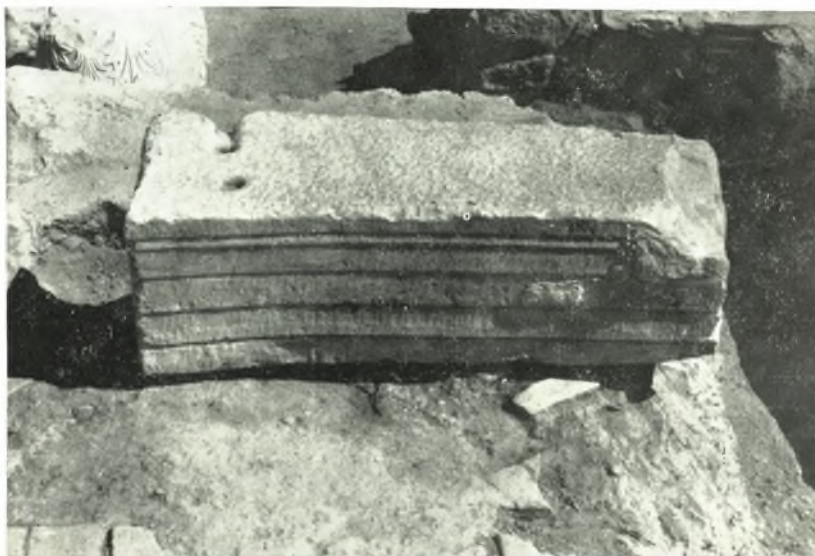
β. Τεμάχιον καμπύλου ἐπιστυλίου.