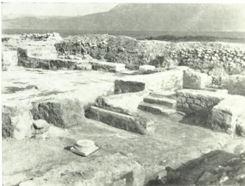
α. Χῶροι τῆς κατοικίας (ἐκ ΝΔ).