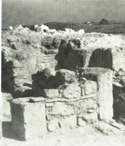
α. Τὸ νότιον ἥμισυ τοῦ δυτικοῦ τοίχου μεταγενεστέρου οἰκοδομήματος ἐντὸς τοῦ βήματος τῆς βασιλικῆς (ἐκ ΒΔ.).