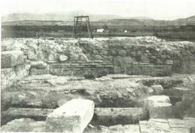
β. Μαριμίρινα μέλη ἐντὸς τῆς κόγχης τοῦ βήματος (ἐκ Β.)