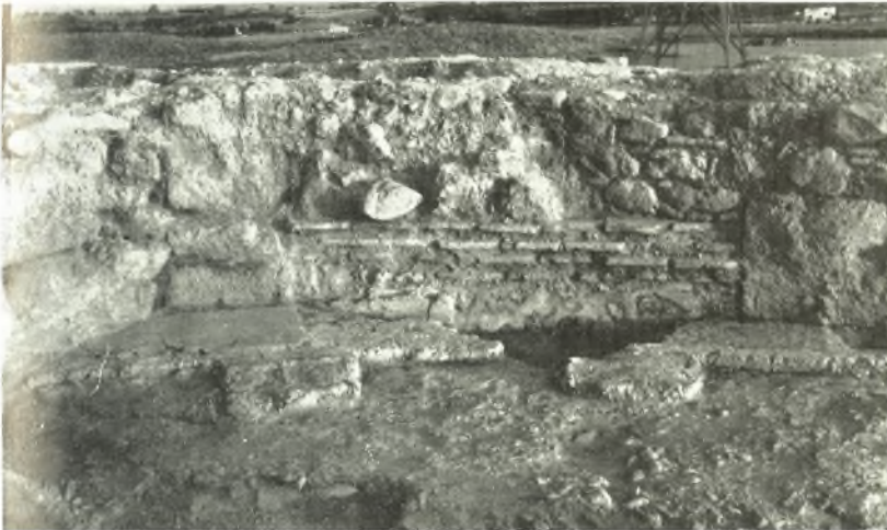
α. Δάπεδον τῆς κόγχης τοῦ βήματος (ἐκ Β.).