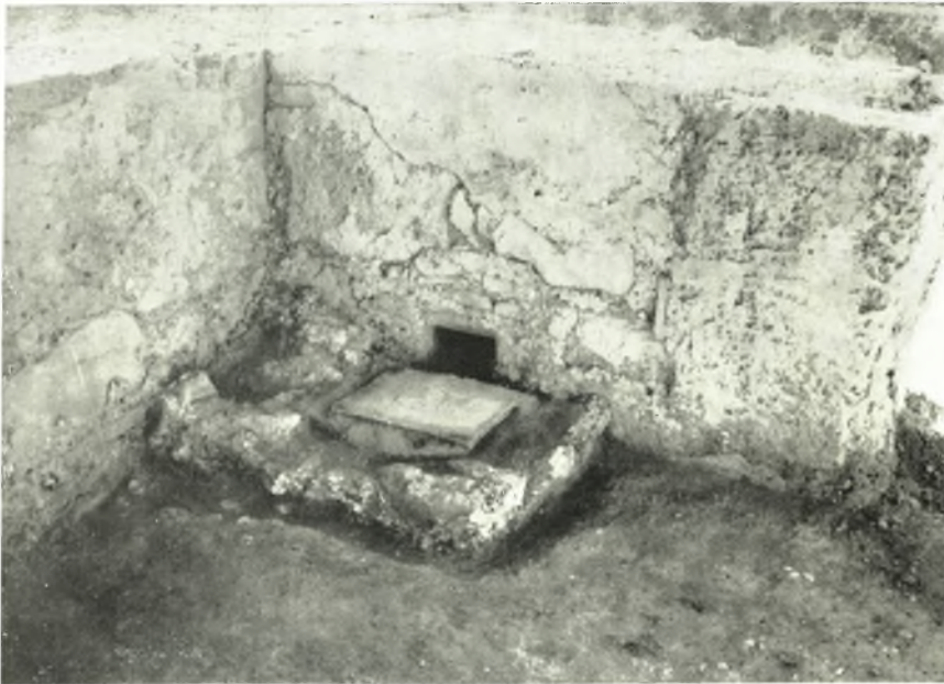
β. Κτιστόν τετρούπλευρον φρεάτιον μετὰ συστήματος ἀποχετεύσεως.