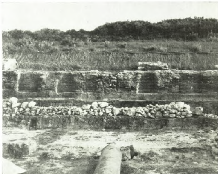
α. Ἐπομεις τοῦ Νυμφαίου ἀπὸ Δυσμῶν.