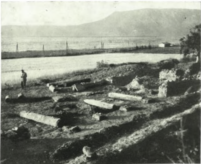
β. Ἡ πρὸ τοῦ νυμφαίου στοὰ ἀπὸ ΝΑ.