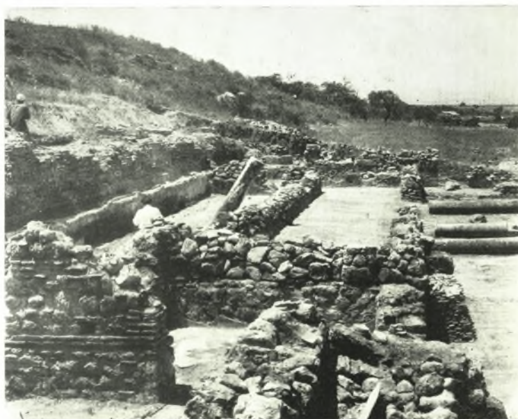
β. Ἐπομεις τοῦ Νυμφαίου ἀπὸ Ἀνατολῶν.