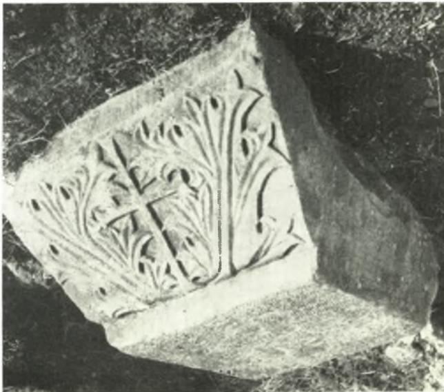
β. Παλαιοχριστιανικὸν ἐπίθημα τῆς κρήνης.