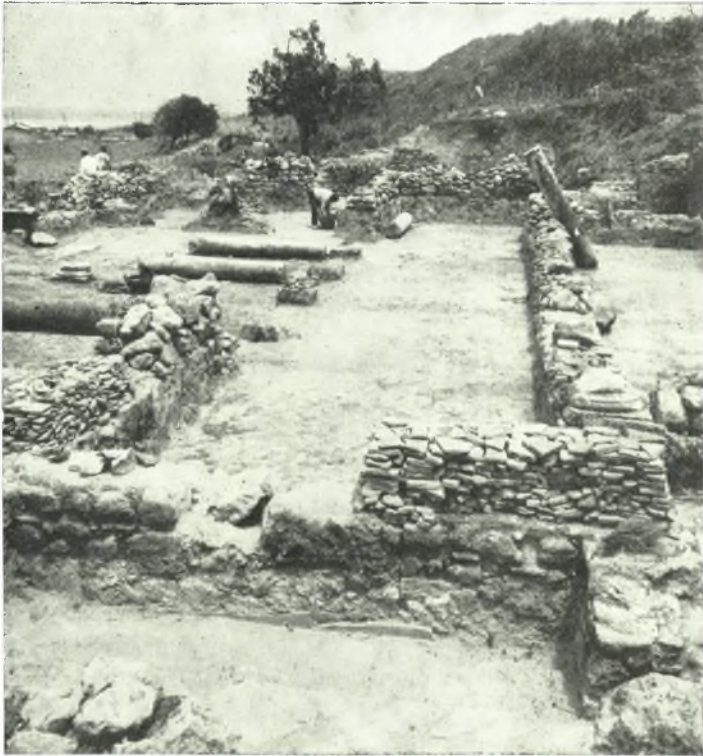
α. Ὁ πρὸ τῆς δεξαμενῆς χώρος ὁρώμενος ἀπὸ Ν.