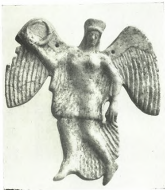
α. Περιτμητον ανάγλυφον Νίκης.