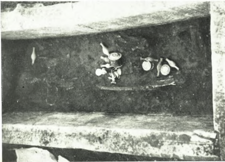
α. Τάφος 13.