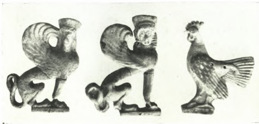
γ. Πήλινα περιτμητα ανάγλυφα τῶν παιδικῶν τάφων.