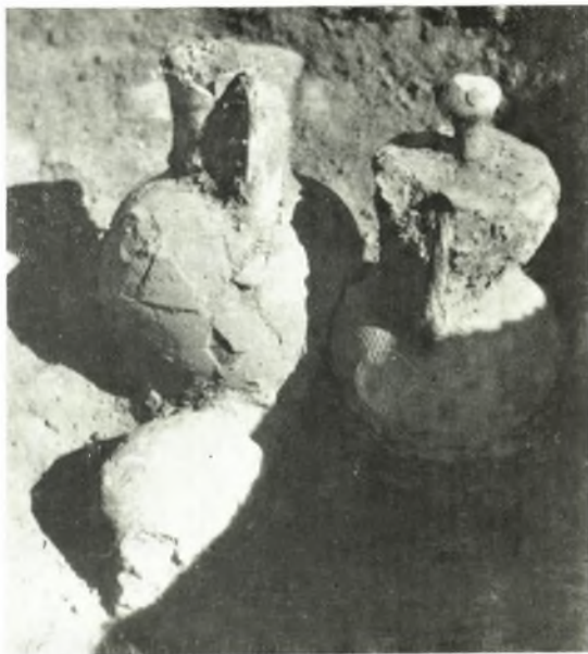
α. Τάφος 47.