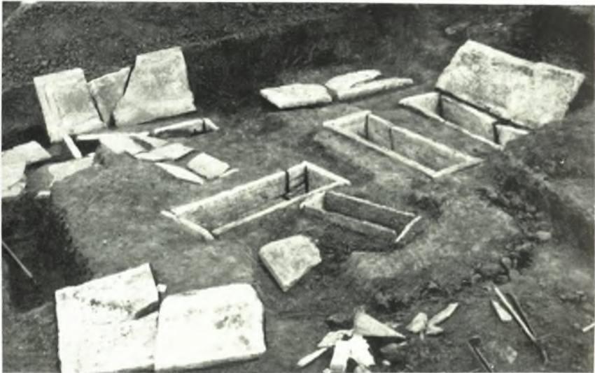
α. Συστάς τάφων Α.