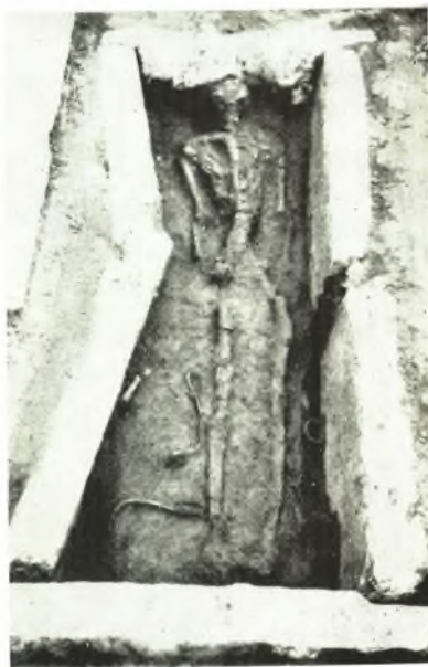
β. Τάφος δ.