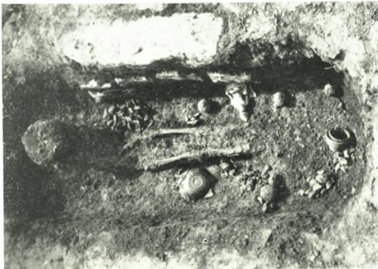
β. Τάφος 14.