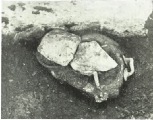
α. Ταφή εντός χαλκής υδρίας.