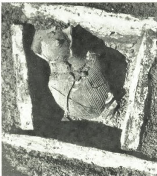
α. Θήκη 32.