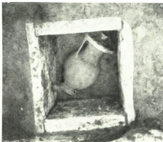
β. Θήκη 55.