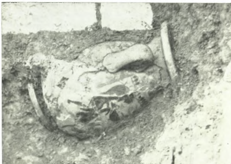
α. Μελανόμορφος πελίκη ἐξ Ἀμβρακίας.