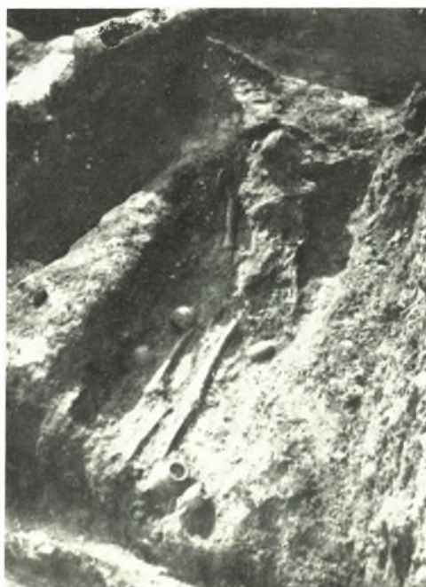
β. Τάφος 67.