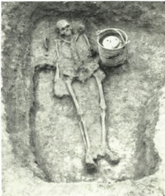
β. Τάφος 31.