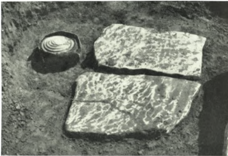
β. Χαλκοῦν ἀγγεῖον Γ 74.