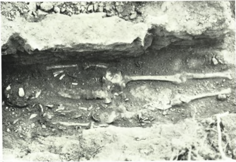
α. 'Ο λακκοειδής τάφος υπ' αριθ. 154 τῆς Ἀμφιπόλεως.