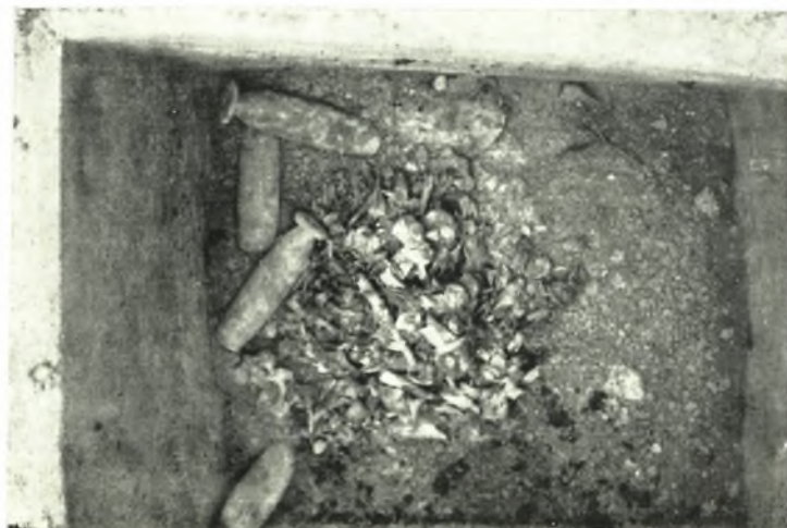
β. Ἡ θήκη τοῦ ὑπ' ἀριθ. 142 τάφου τῆς Ἀμφιπόλεως.