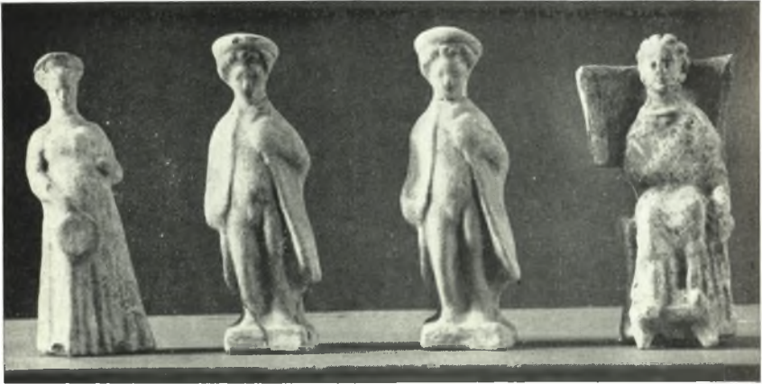
α. Ειδώλια παιδων καὶ γυναικῶν ἐκ τοῦ ὑπ' ἀριθ. 177 λακκοειδοῦς τάφου τῆς Ἀμφιπόλεως.