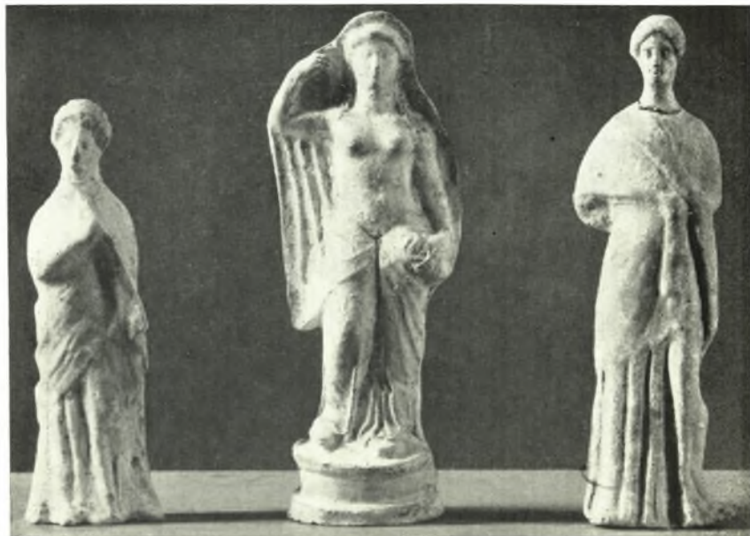
β. Εἰδώλια Ἀφροδίτης καὶ γυναικῶν ἐκ τάφου τῆς Ἀμφιπόλεως.