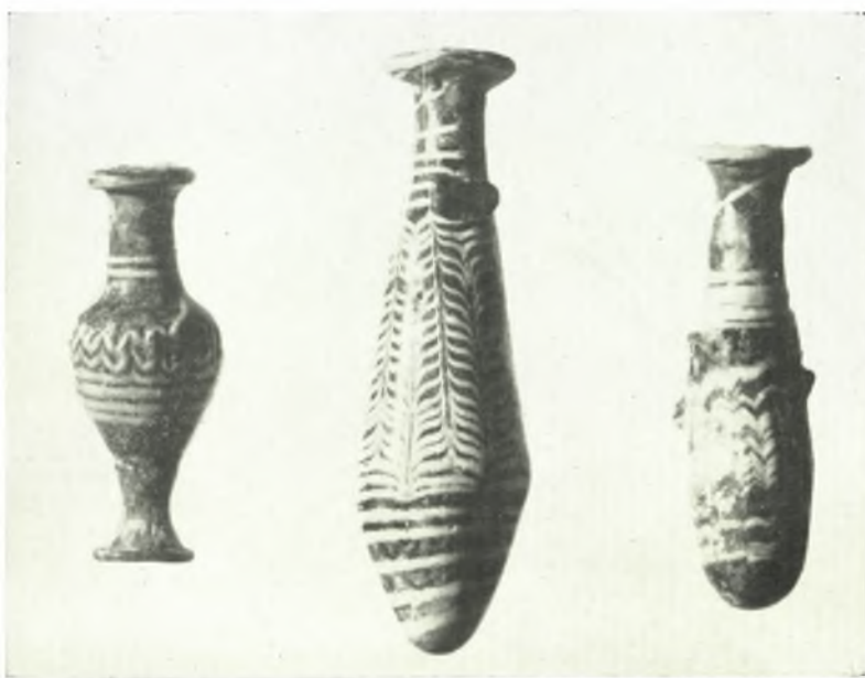
β. Ἀγγεῖα ἐλληνιστικῶν χρόνων ἐκ πολυχρώμου ὑάλου, ἀνευρεθῆντα ἐντὸς τάφων τῆς Ἀμφιπόλεως.