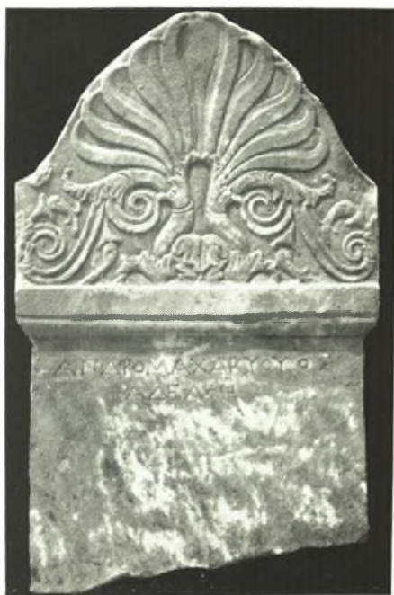
α. Ἐπιτύμβια στήλη ἐξ Ἀμφιπόλεως.