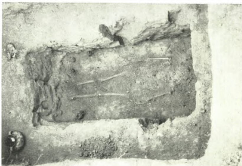
α. 'Ο λακκοειδής τάφος ύπ' αριθ. 132 τής 'Αμφιπόλεως.