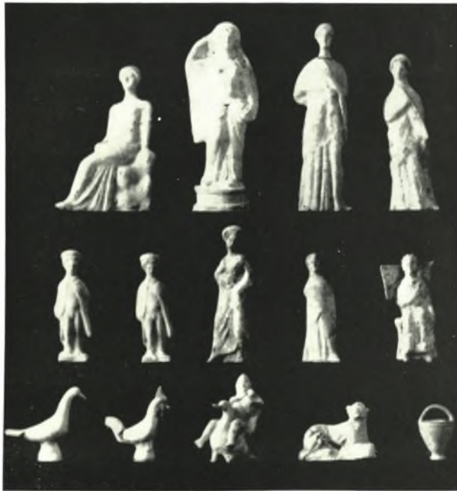
β. Ειδώλια ἐκ τοῦ ὑπ' ἀριθ. 177 λακκοειδοῦς τάφου τῆς Ἀμφιπόλεως.