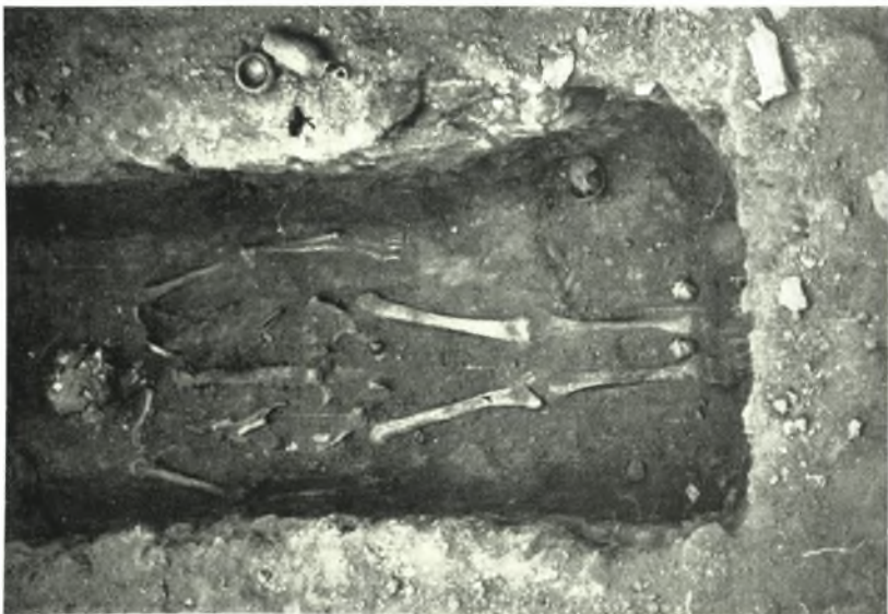
β. 'Ο λακκοειδής τάφος υπ' αριθ. 152 τῆς Ἀμφιπόλεως.