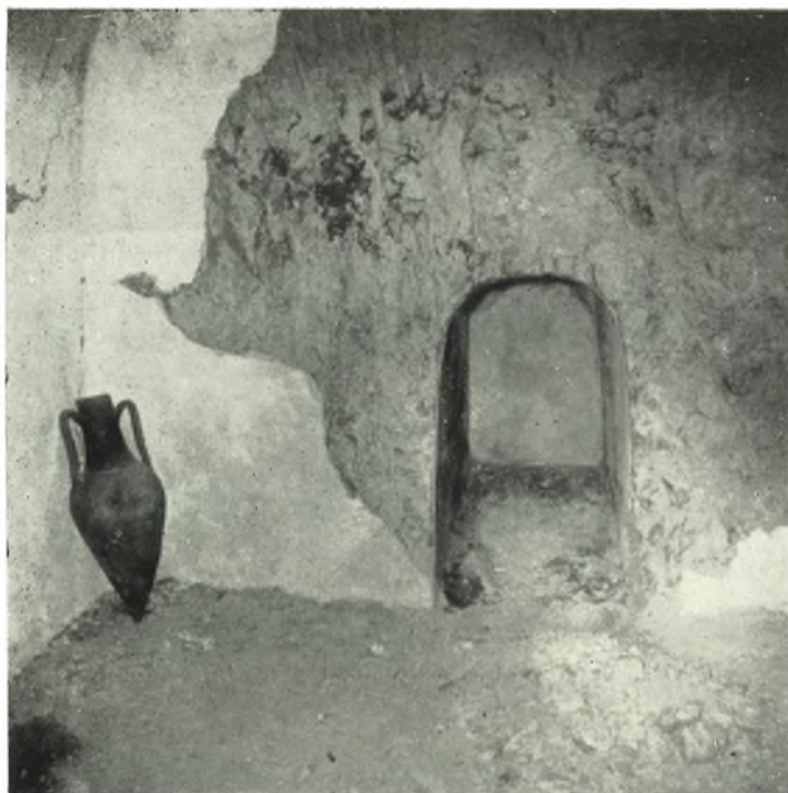
α. Ὁ νεκρικός θάλαμος τοῦ «μακεδονικοῦ» τάφου Ζ τῆς Ἀμφιπόλεως μετὰ τῆς κόγχης τῆς Β. αὐτοῦ πλευρᾶς. Εἰς τὴν ΒΔ. γωνίαν ὄξυπύθμενος ἀμφορεύς.