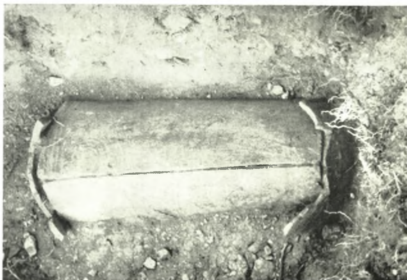
β. 'Ο ύπ' αριθ. 134 κεραμοσκεπής τάφος τής 'Αμφιπόλεως.