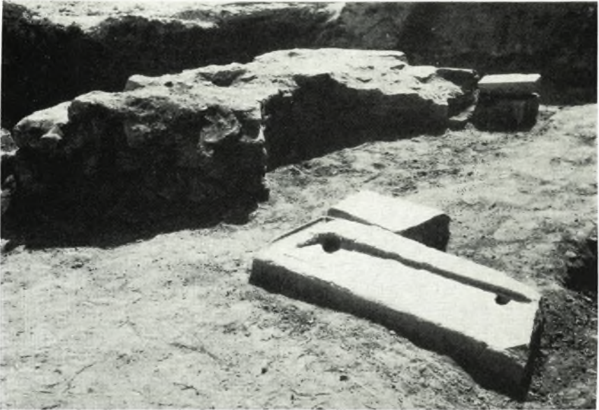
α. Τὸ κατὰ τὴν ἐξωτερικὴν πλευρὰν τοῦ αἵθριου ἀποκαλυφθὲν τμήμα τοῦ προπύλου. Ὅψις ἀπ' Ἀνατολῶν.