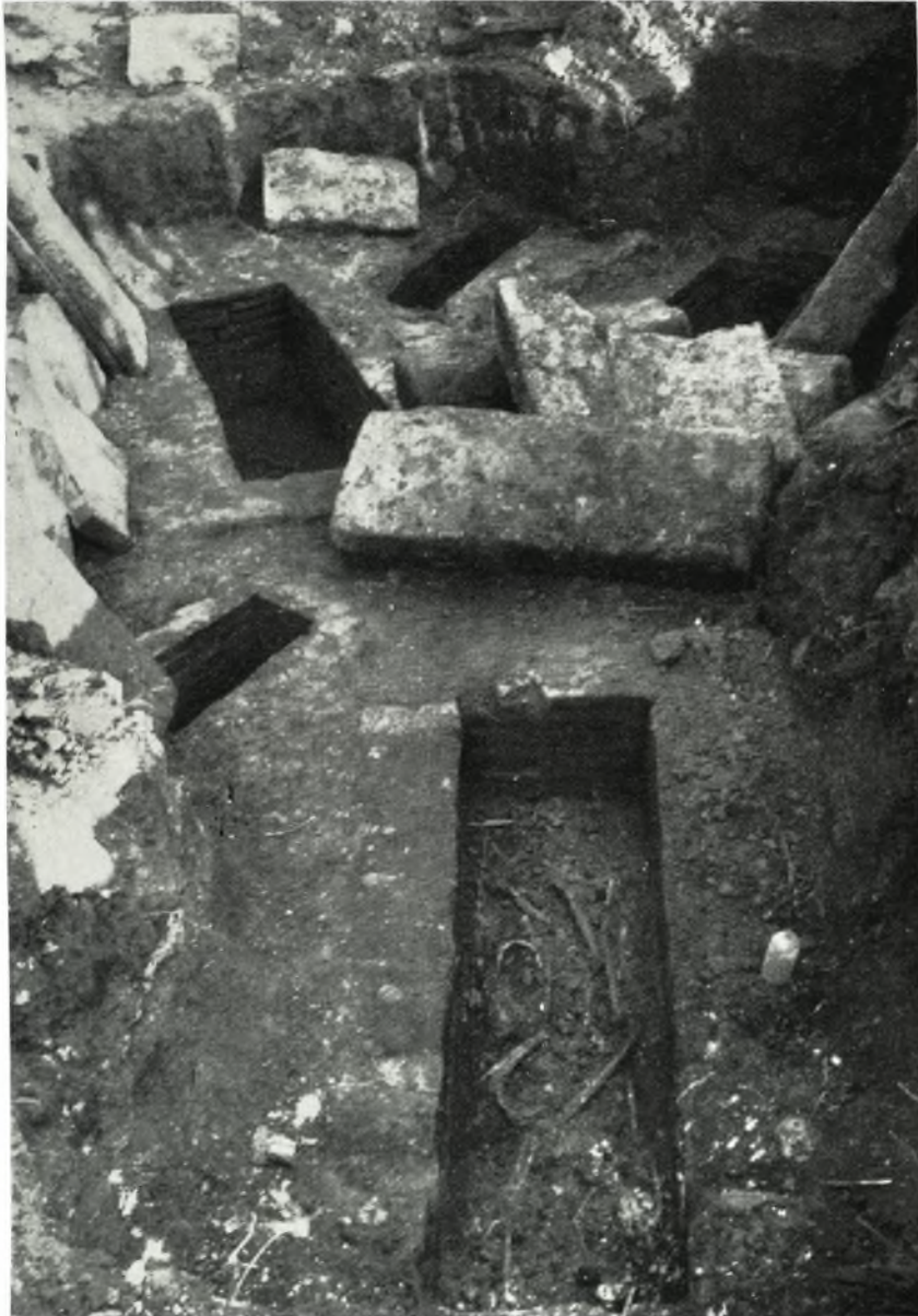
Οι πέντε κιβωτιόσχημοι Ρωμαϊκοί τάφοι τοῦ χωρίου Γαλούπι ἀρχαίας Ἡλίδος.