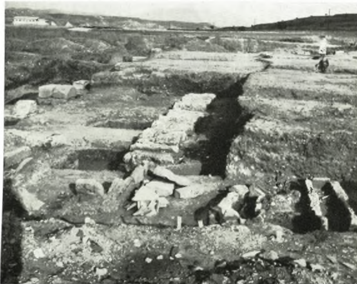
β. Τμήμα τῆς Νοτίας Στοᾶς τῆς ἀρχαίας Ἡλίδος, περιλαμβάνον τὴν σειρὰν τῶν κατακειμένων λίθων καὶ Ῥωμαϊκοὺς τάφους.