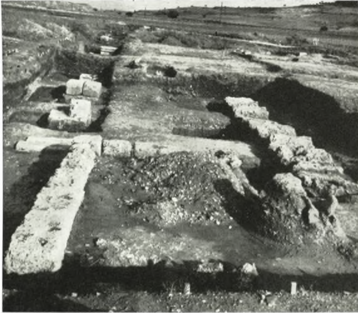
α. Ἡ Νοτιά Στοά τῆς ἀρχαίας Ἡλίδος ἀπὸ Δυσμῶν.