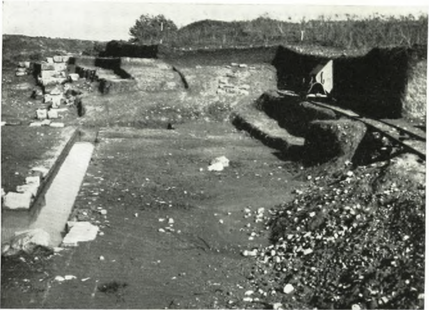
α. Τὸ θέατρον τῆς ἀρχαίας Ἡλίδος μετὰ τὸ ἀποκαλυφθῆν ἐσωτερικῶς τοῦ ἀναλήματος τῆς ἀνατολικῆς παρόδου τμήμα τοῦ κοίλου.