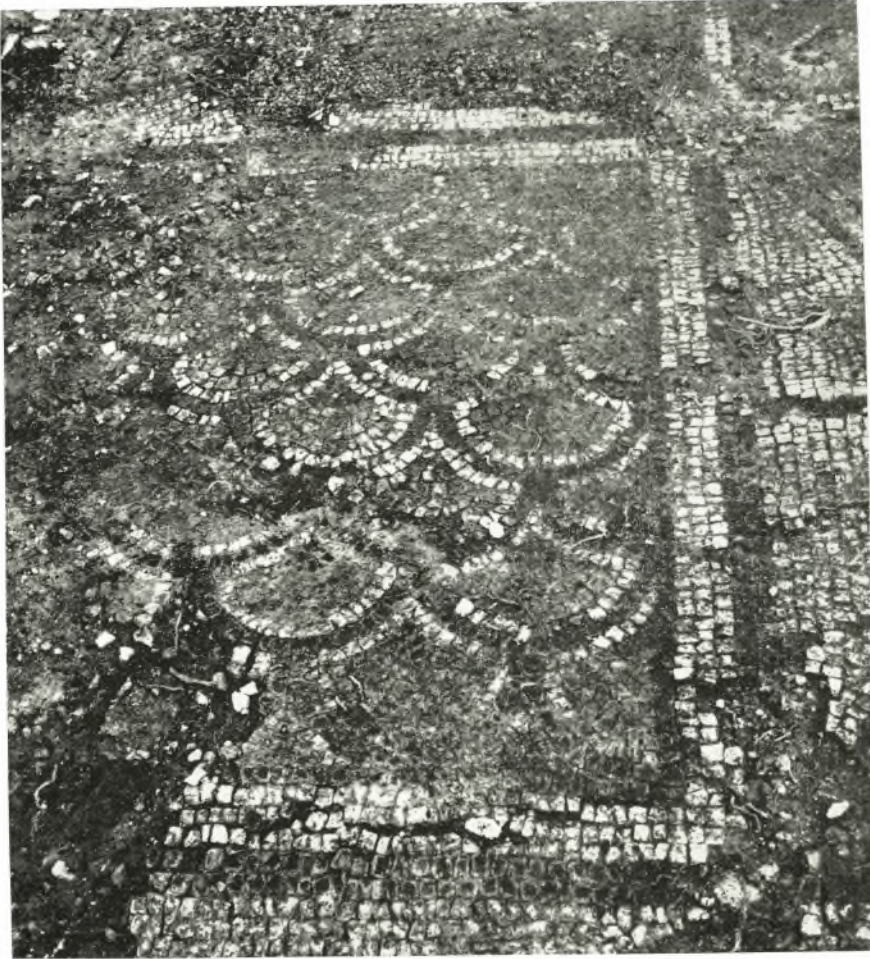
α. Ψηφιδωτὸν δάπεδον τῆς Νοτίας Στοᾶς τῆς ἀρχαίας Ἡλίδος.