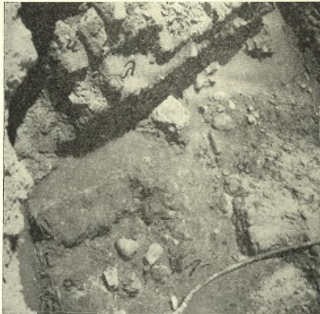
Εἰκ. 3. Τὸ νότιον τμῆμα τοῦ δωματίου Α'.