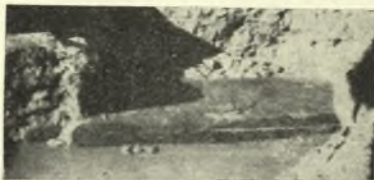
Εἰκ. 5. Τὸ κατώφλιον τῆς οἰκίας B .

0,60 μ. καὶ ὕψους 0,25 μ. Μολονότι δὲν ἀνεσκάφη εἰς ἅπαν τὸ μῆκος ὁ τοῖχος οὗτος, ὅμως ἡ ὀπωσθήποτε μικρὰ ἀπόστασις τοῦ κατώφλιου ἀπὸ τοῦ δυτικοῦ ἄκρου τοῦ τοίχου δεικνύει ὅτι τὸ κατώφλιον δὲν εὐρίσκεται εἰς τὸ μέσον τοῦ τοίχου· ὁμοίαν τοποθέτησιν ἔχομεν καὶ εἰς τὸ κατώφλιον τοῦ A (πρβ.