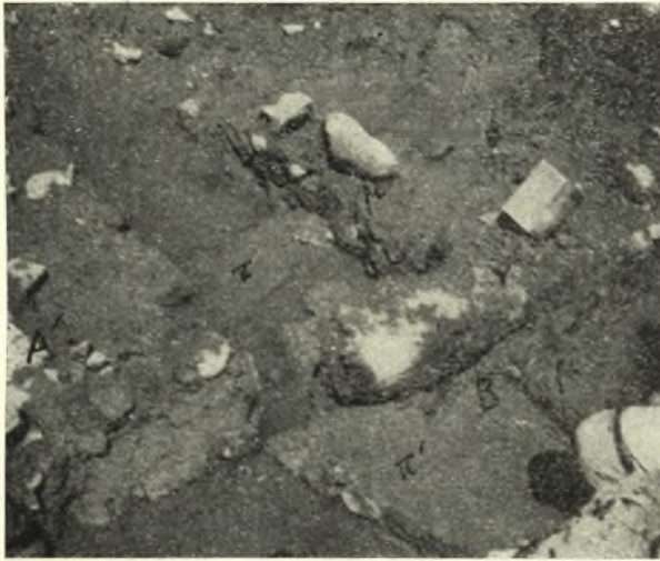
Εἰκ. 4. Ἡ ΒΑ γωνία τοῦ A' ἐπικαθημένη ἐπὶ τῆς ΝΔ γωνίας τῆς οἰκίας B , ἐφ' ἧς ἄλλοι μεταμυκηναϊκοὶ τοῖχοι.

εὖρημα ἐντὸς τοῦ A' ἦτο πηλίνη σφραγίς σχεδὸν κωνικοῦ σχήματος μετὰ σφαιρικής διατρήτου ἀπολήξεως ἄνω· ὁ δίσκος τῆς σφραγίσεως, διαμ. 2,7 ἔκ., φέρει ἐντὸς κύκλου ἐγγάρακτον διπλοῦν σταυρόν, τοῦ ὁποίου τὰ τεταρτημόρια ἐπαναλαμβανόμενα πληροῦσι τὰς τέσσαρας γωνίας. Τὸ κόσμημα τοῦτο πολὺ σύνηθες καὶ εἰς τοὺς ὑπομυκηναϊκοὺς καὶ τοὺς πρωτογεωμετρικοὺς χρόνους ἐνισχύει τὴν χρονολόγησιν τοῦ A' εἰς τοὺς μεταμυκηναϊκοὺς, πιθανώτατα τοὺς ὑπο-