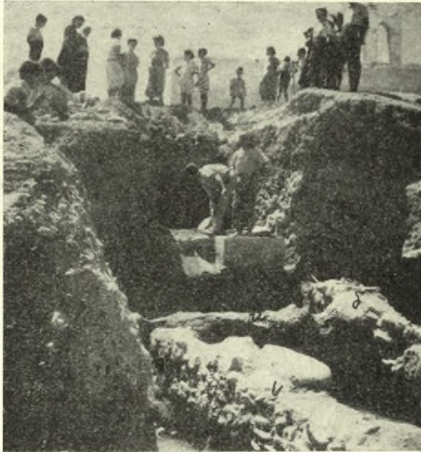
Εἰκ. 8. Ἡ μαρμαρινὴ βᾶσις τοῦ κίονος ὑπὲρ τοὺς τοίχους τοῦ J.

Ἡ πρὸς ἀνατολὰς προέκτασις τῶν τοίχων κ καὶ λ εἶχε καταστραφῆ εἰς μεσαιωνικοὺς χρόνους, καθὼς καὶ ὀλόκληρον τὸ ἀνατολικὸν πέρασ τοῦ I , διότι ἀνεφάνη ἐκεῖ τοῖχος ἐκτισμένος δι' ἀσβέστου, ἀντιθέτως δὲ πρὸς τὴν ὑπόλοιπον