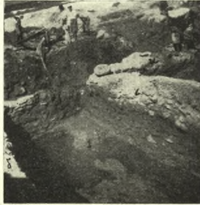
Εἰκ. 7. Οἱ τοῖχοι λ καὶ κ ἀπὸ νότου.

Εἰς μῆκος 11 μ. παρηκολουθήθη ὁ δυτικώτερος τῶν τοίχων τούτων, δ , καμπτόμενος πρὸς δυσμὰς κατὰ τὸ βόρειον αὐτοῦ πέρασ, τὸ ὁποῖον ἐπικαθίσταται λοξῶς ἐπὶ τοῦ δυτικοῦ τοίχου τοῦ δωματίου Α (ἔ.ἀ. 277 εἰκ. 9 ): ὁ τοῖχος οὗτος ἔχει πάχος 0,50 μ. σφύζεται δὲ εἰς ὕψος μέχρι 1,70 μ. κατὰ τὸ νότιον ἀνασκαφὴν πέρασ. Ἡ ἔξωτερική, δυτική, παρεῖα τοῦ τοίχου δ ἐπικαθίσταται ἐπὶ ἐτέρου παλαιότερου ὕψους 40 ἐκ. καὶ φαινομένου πάχους 42-44 ἐκ. καὶ ὁ κατώτερος οὗτος τοῖχος εἶναι μεταγενέστερος τῶν μυκηναϊκῶν, διότι ἡ κατεύθυνσις του εἶναι λοξὴ ὡς πρὸς τὴν οἰκίαν Α καὶ κυρίως τέμνει τὴν προέκτασιν τοῦ τοίχου γ . Ἡ διπλῆ χρονικὴ περίοδος εἶναι καταφανὴς καὶ εἰς τοὺς