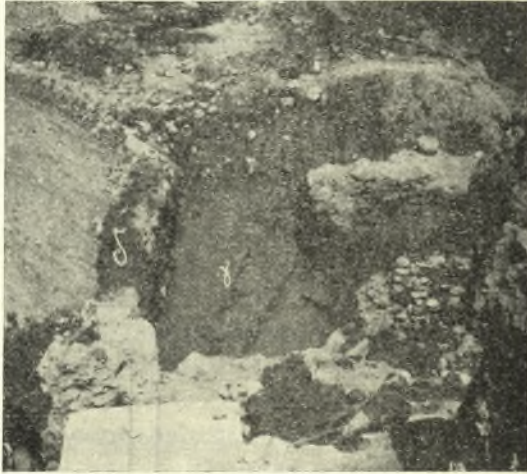
Εἰκ. 2. Ὁ μυκηναϊκὸς τοῖχος γ κατωτέρω τῶν γεωμετρικῶν.