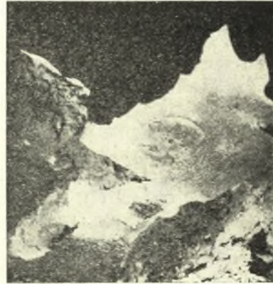
Εἰκ. 9. Ἡ πλάξ τοῦ μολύβδου ἐπὶ τῆς μαρμαρινῆς βάσεως.