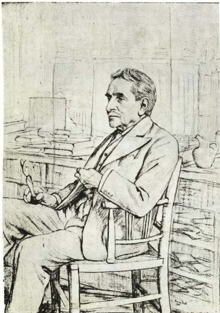
Sir ARTHUR EVANS