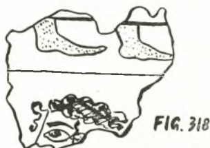
Εἰκ. 2. — Τὸ τεμάχιο τῆς εἰκό- νος 318 παρὰ Evans PM IV.

Ἡ ὑπὸ τοῦ Ἔβανς διὰ τῆς ἀνασυνθέσεώς του εἰς πίνακα προταθεῖσα λύσις ὑπ' οὐδενὸς μέχρι σήμερον μελεητοῦ ἠμφεσθητήθη, γενομένου κατ' ἀρχὴν παραδεκτοῦ ὅτι ἡ σύνθεσις παρίστανε θρησκευτικὴν τελετουργίαν μεταδόσεως τῆς ἱερᾶς κύλικος ὑπὸ ἱερειῶν καὶ ἱερέων, περιβεβλημένων εἰδικὴν ἱερὰν στολὴν καὶ κατέναντι ἐπὶ ἀναδιπλουμένων σκιμπόδων καθημένον. Ὁ σοφὸς ἀνασκαφεὺς τῆς Κνωσοῦ, ὀρμώμενος ἐκ τῆς θέσεως εἰς ἣν ἀνευρέθησαν τὰ τεμάχια, ἐνετόπισε τὴν