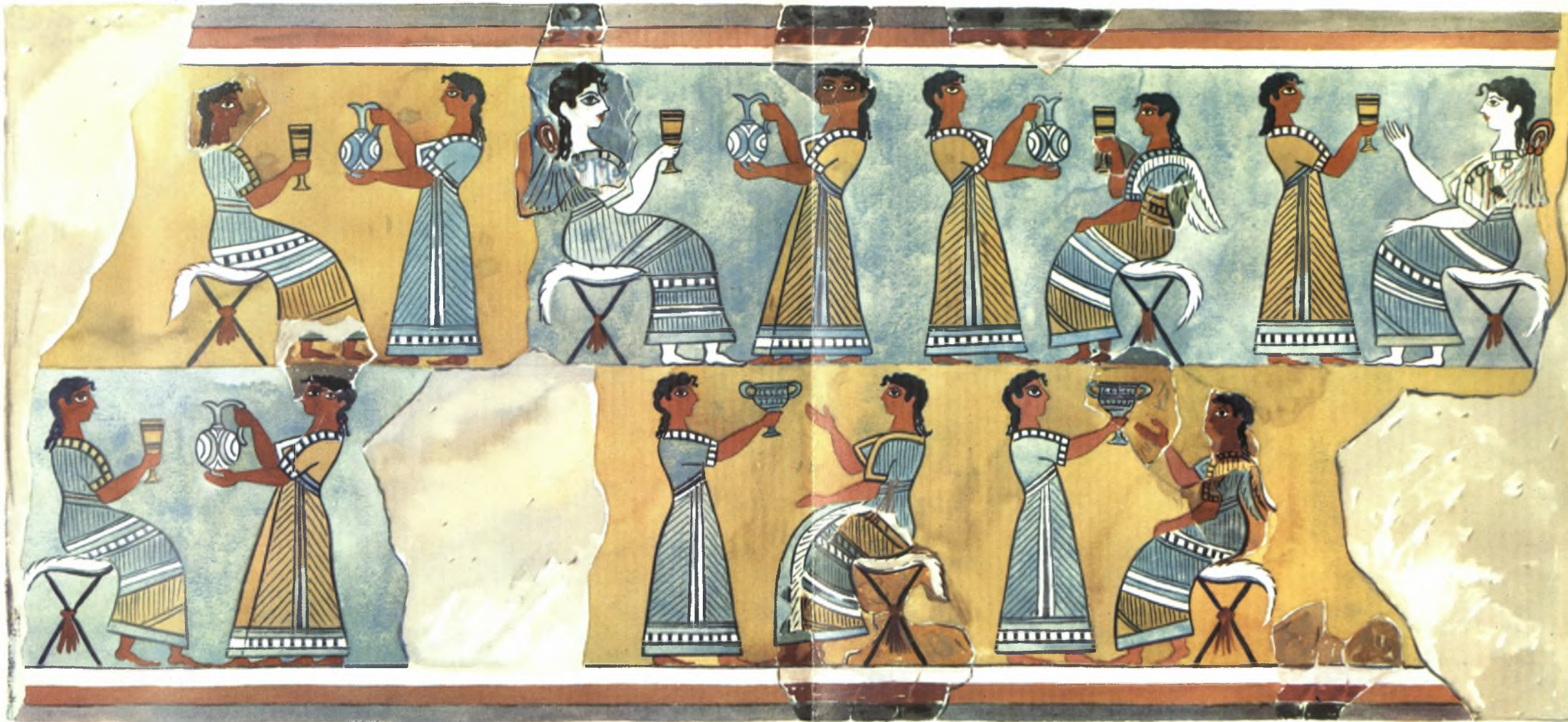
Η ΤΟΙΧΟΓΡΑΦΙΑ ΤΗΣ ΠΡΟΣΦΟΡΑΣ ΣΠΟΝΔΩΝ ΕΚ ΚΝΩΣΟΥ