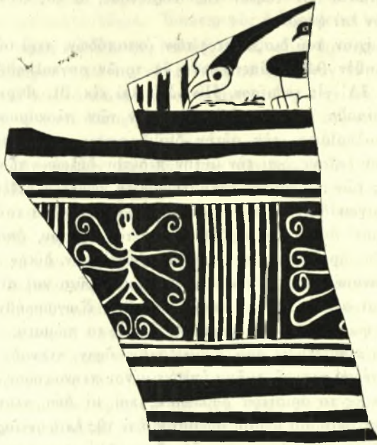
Εἰκ. 3.—Γεμάχιον κάλπης με παραστάσεις πολύποδος.

της δὲν εἶναι δυνατόν νὰ παροραθῇ. Προωθεῖ, ὥς θὰ ἴδωμεν, ἐν τῷ συνόλῳ του τὸ ἐπίμαχον ζήτημα τῶν ἐπιβιώσεων τοῦ παλαιοῦ μινωικοῦ κόσμου ἐπὶ τῆς νήσου καὶ τὸ πρόβλημα τῆς ἐκτάσεως τῶν ἀνατολικῶν ἐπιδράσεων κατὰ τοὺς πρώτους χρόνους τῆς ἀναπτύξεως τῆς ἑλληνικῆς τέχνης. Ἀλλ' εὐρισκόμεθα πράγματι πρὸ μιᾶς τοιαύτης ἐπιβιώσεως, καὶ τίνι τρόπῳ ἄραγε ἐπεβίωσε τὸ θέμα ; Ὡς σοβαρώτατον