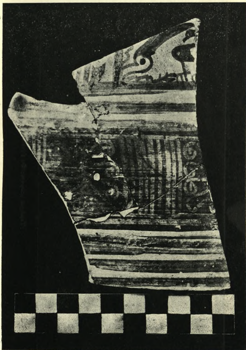
Τεμάχιον κάλπης μετὰ παρστιάσεων πολύποδος.