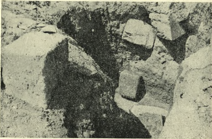
2. Οἱ ἐντὸς τοῦ θαλάμου ὀγκόλιθοι καὶ ὁ ἐπὶ τῆς ἐπιταφείας τοῦ ἐδάφους.