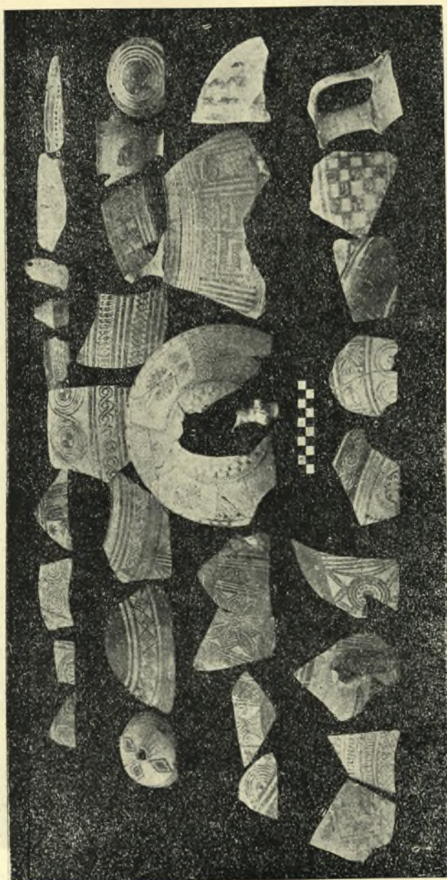
Τεμάχια γεωμετρικῶν ἀγγείων.