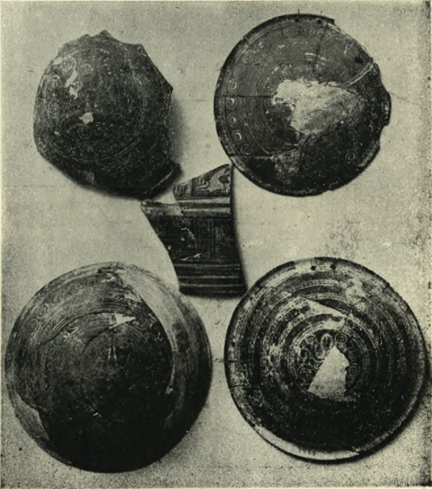
Πώματα καλπών καὶ τεμάχιον μετὰ παραστάσεων πολύποδος