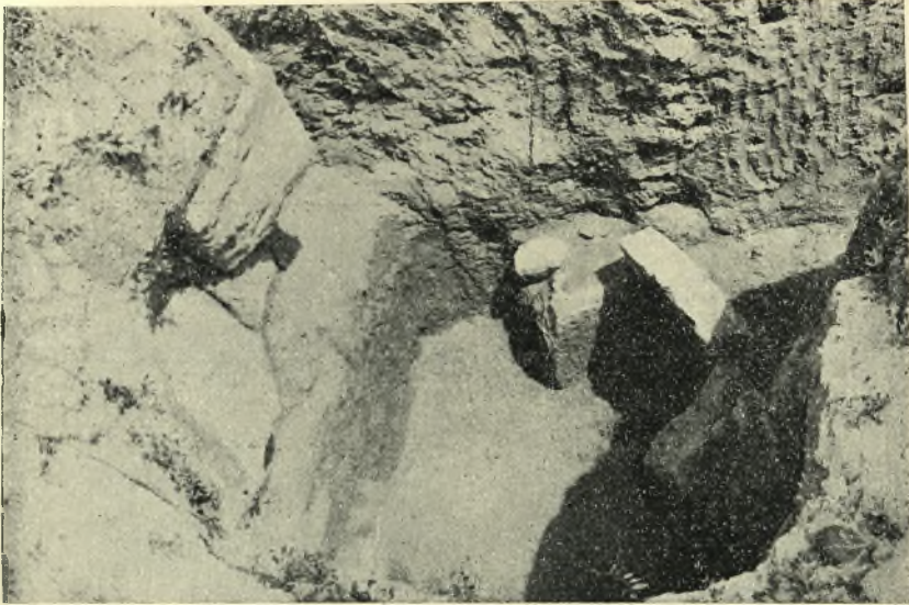
1. Τὸ ἀνασκαφέν τιμῆ α τοῦ θαλάμου καὶ ἡ εἴσοδος τοῦ τάφου.