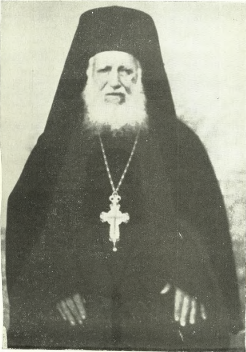
Le célèbre moine Agathangelos.