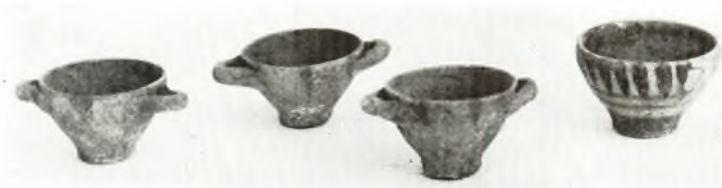
β. Ἀγγεῖα ἐκ τοῦ τάφου Ι.