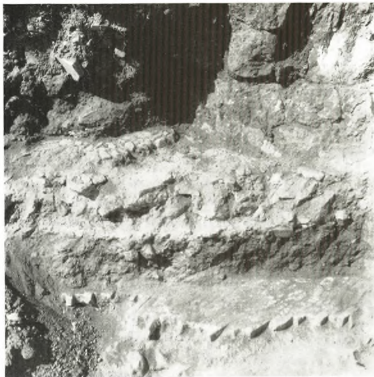
α. Τὰ δύο δάπεδα τοῦ πηγίου.