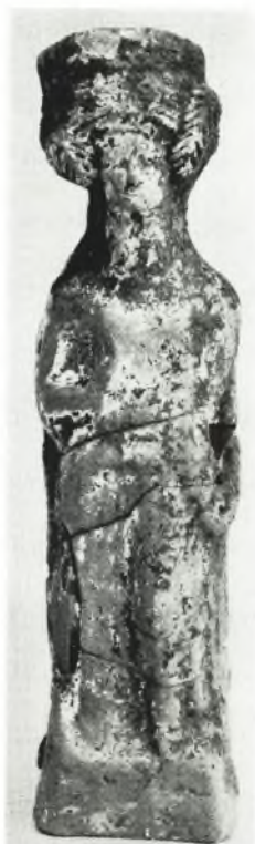
α. Ειδώλιον ἐκ τοῦ τάφου Ι.