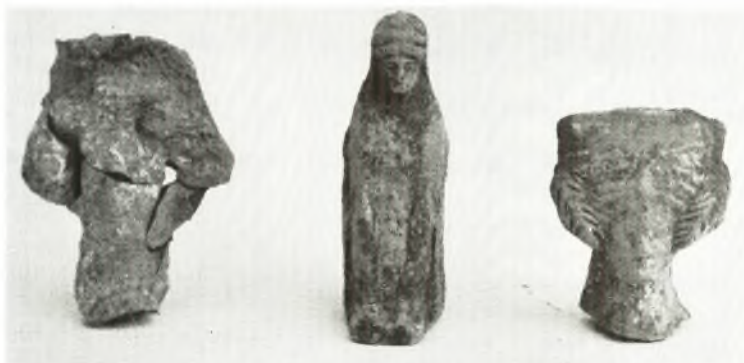
γ. Εἰδώλια ἐκ τῶν τάφων Ι καὶ VIII.