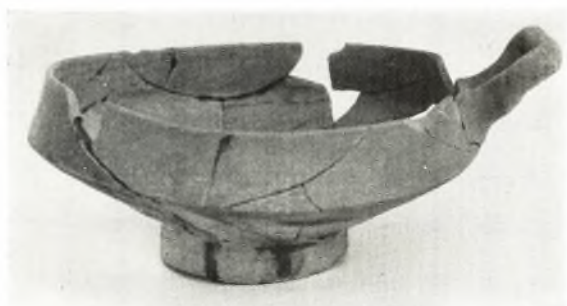
γ. Κύλιξ ἐκ τοῦ τάφου XVIII.