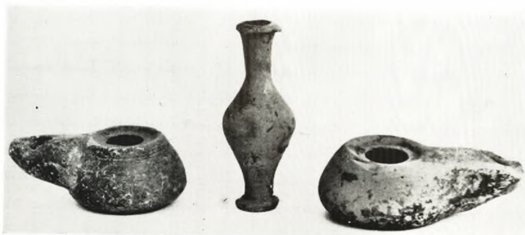
β. Λύχνοι καί δακρυδόχος ἐκ τοῦ τάφου XIV.