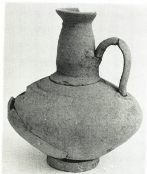
γ. Οίνοχόη ἐκ τοῦ τάφου XV.