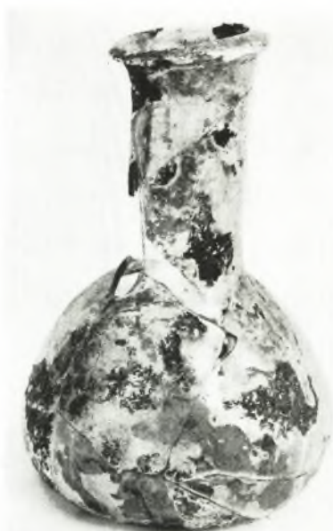
δ. Ὑάλινον ἀγγεῖον ἐκ τοῦ τάφου XV.