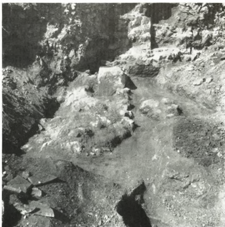
β. Αἱ δύο φάσεις τοῦ τοίχου Γ.