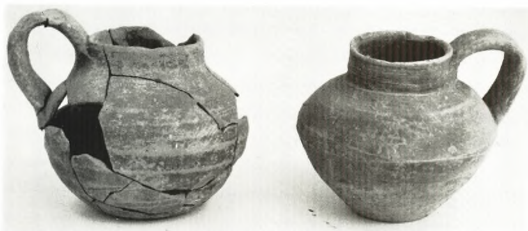
α. Οίνοχοΐσκαί ἐκ τοῦ τάφου XIV.