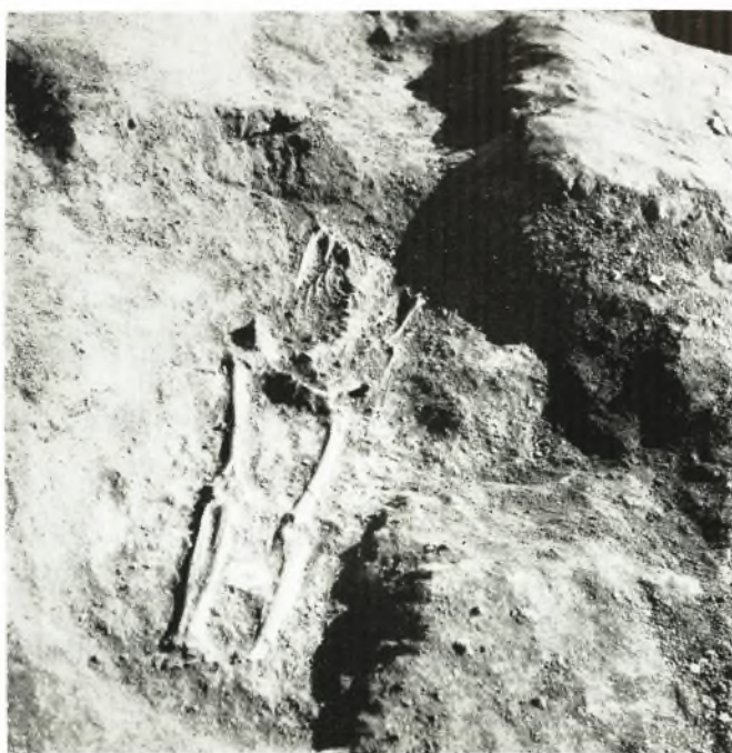
ε. Ὁ τάφος XVII.