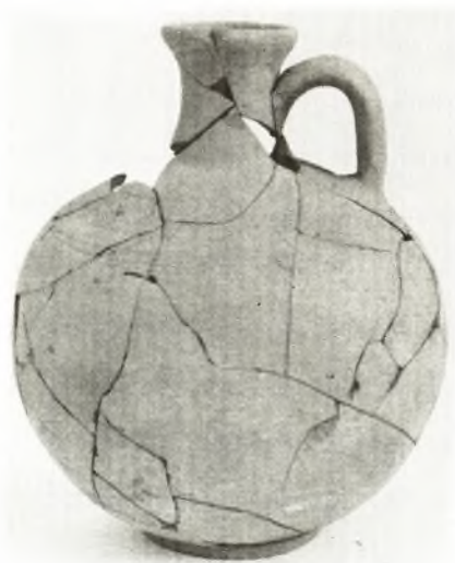
β. Οἰνοχόη ἐκ τοῦ τάφου XIX.