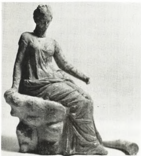
α. Ειδώλιον ἐκ τοῦ τάφου IV.