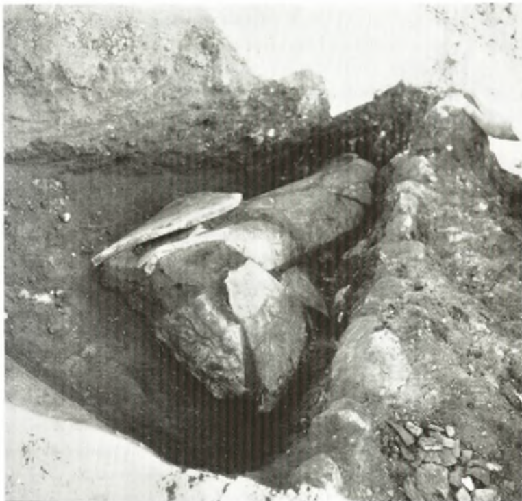
α. Ὁ τάφος ΙΙ.