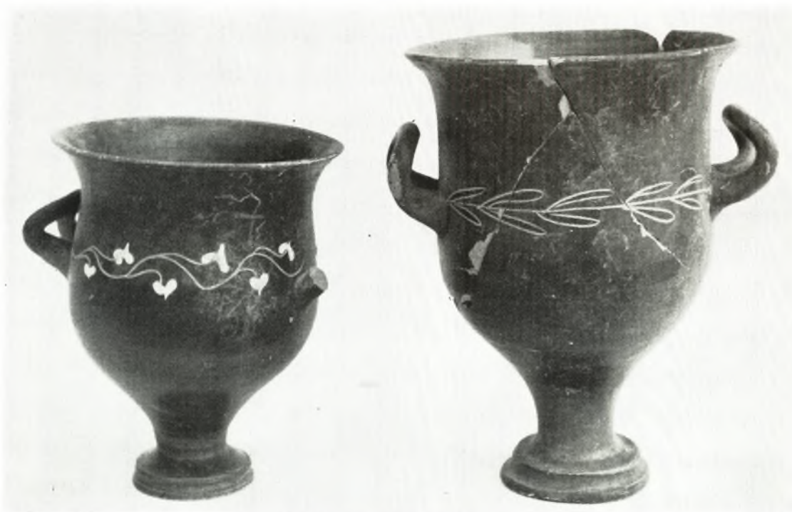
δ. Ποτήρια ἐκ τοῦ τάφου ΙΙ.