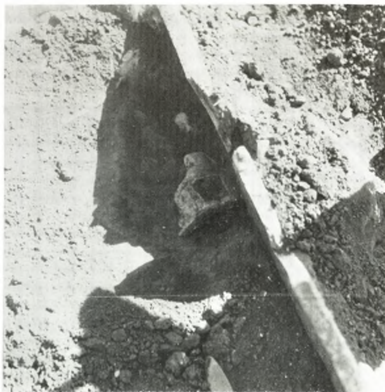
β. Τὸ εἰδώλιον κατὰ χώραν.