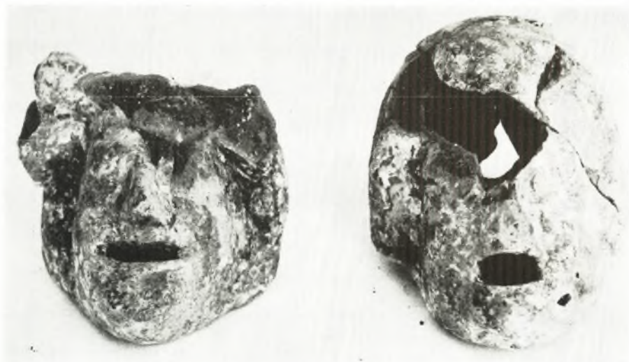
γ. Ἄθύσματα ἐκ τοῦ τάφου VIII.