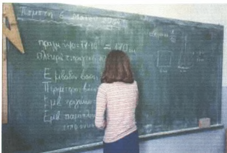
Η Στέλλα υπολογίζει το εμβαδόν της βάσης

Δ: Αν ήταν μέτρα επί μέτρα, θα έβγαине τετραγωνικά μέτρα. Το καταλάβαμε, Στέλλα;