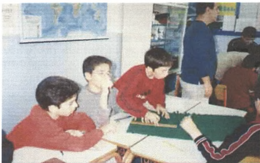
Τα παιδιά μετράνε την παράπλευρη επιφάνεια

Τα παιδιά προσπαθώντας να τυλίξουν τη σκηνή με ένα ορθογώνιο κομμάτι γκοφρέ χαρτιού, παρατηρούν ότι περισσεύει αρκετό χαρτί στο σημείο που ενώνονται τα ξυλάκια στην κορυφή και δεν τεντώνεται καλά. Ο δάσκαλος επισημαίνει αυτό το πρόβλημα που παρατηρήθηκε. Επομένως, το σχήμα που έκοψαν δεν είναι σωστό. Έτσι, ο δάσκαλος επισημαίνει ότι πρέπει να βρουν έναν τρόπο να υπολογίσουν πόσο ακριβώς χαρτί χρειάζεται για να εφαρμόζει σωστά. Ο δάσκαλος δείχνει την χάρτινη κατασκευή, την πυραμίδα που είχαν ήδη, και το ανάπτυγμά της. Εξηγεί: