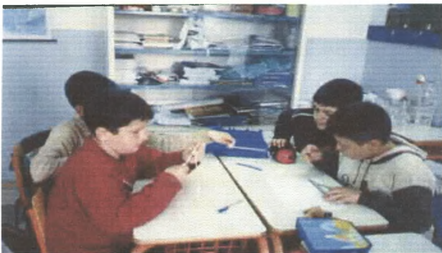
Τα παιδιά κατασκευάζουν το μοντέλο της σκηνής

Ο δάσκαλος και εγώ βοηθάμε τα παιδιά να στερεώσουν τα ξυλάκια. Πλέον, ξεκινάει η διαδικασία του υπολογισμού του γκοφρέ χαρτιού που θα χρειαστεί για να «ντύσουμε» τη σκηνή.