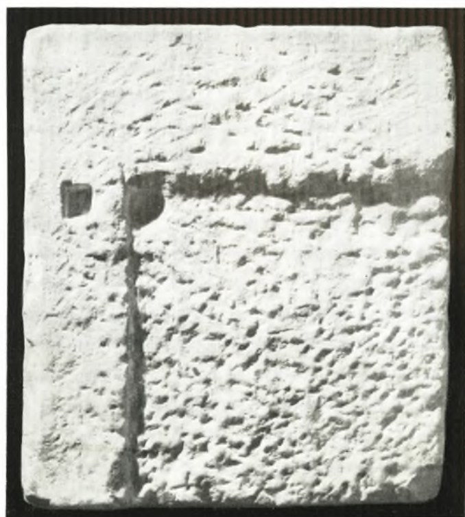
β. Ἡ κάτω ὀριζοντία πλευρὰ τῆς ἐκ Βαρκίζης βάσεως.