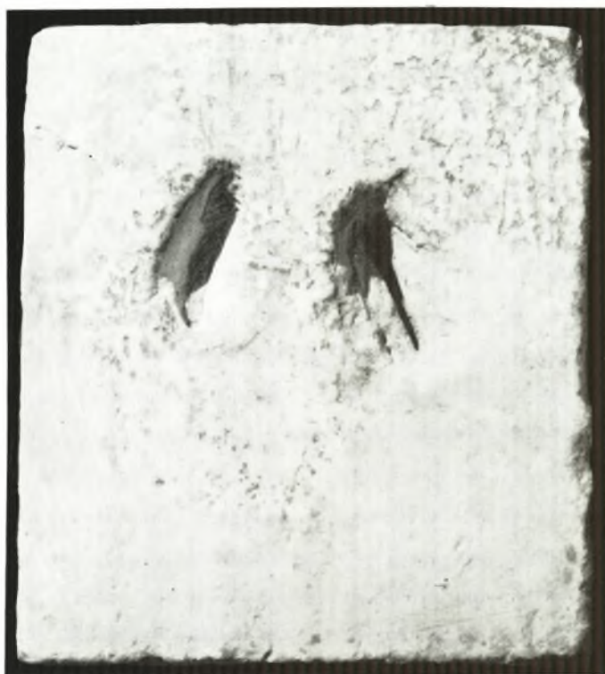
α. Ἡ ἄνω ὀριζοντία πλευρὰ τῆς ἐκ Βαρκίζης βάσεως.