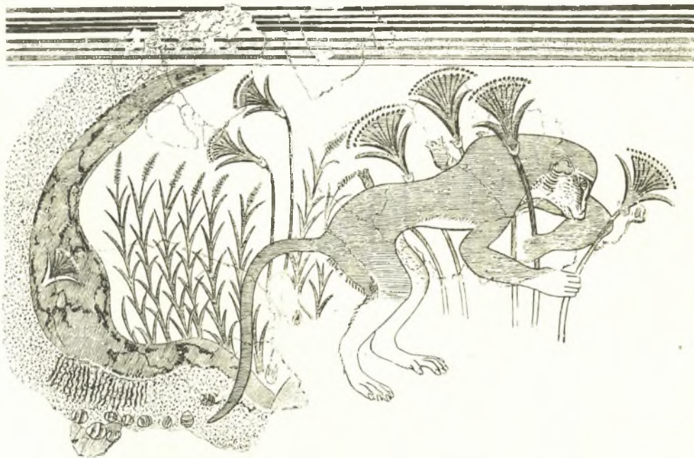
Εἰκ. 2. Ἐκ τῆς τοιχογραφίας τοῦ βηματίζοντος πιθήκου.

Παρὰ τὴν ομάδα τῶν ριπιδίων, ἀριστερὰ εἰς τὴν κάτω γωνίαν τῆς τοιχογρα-