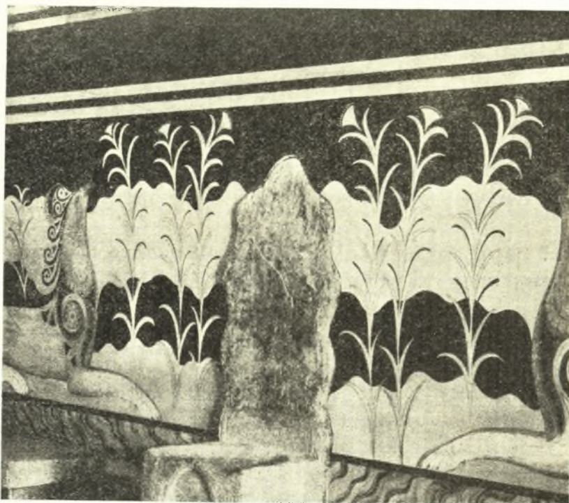
Εἰκ. 4. Ὁ θρόνος τοῦ Μίνως μετὰ τῶν τοιχογραφιῶν τῆς αἰθούσης· τὰ ἐπ' αὐτῶν φυτὰ ὁ «Διόσανθος».

Ἐκ τῶν νεωτέρων ὁ Κ. SPRENGEL 7 νομίζει ὅτι ὁ Διόσανθος τοῦ Θεοφράστου εἶναι ὁ Dianthus arboreus L. καὶ τοῦτο συνάγει ἐκ τοῦ ὅτι τόσοσιν εἰς τὴν Κρήτην ὅσον