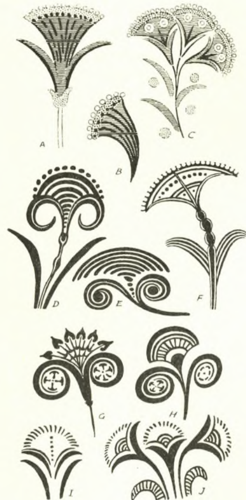
Εἰκ. 4. Διάφοροι μορφαὶ ἐξελίξεως τοῦ ὡς παπύρου χαρακτηρισθέντος φυτοῦ: Α ἐκ τῆς τοιχογραφίας μὲ τοὺς βηματίζοντας πιθήκους, Β καὶ C ἐκ τῆς τοιχογραφίας μὲ τοὺς καθημένους πιθήκους, D ἕως J ἐξ ἀγγείων τῶν διαφόρων ὑστερομινωικῶν ἐποχῶν καὶ δὴ τὰ D καὶ E τῆς YM Ia, τὸ F τῆς YM Ib, τὰ G καὶ H τῆς YM II, τὰ I καὶ J τῆς YM IIIa (EVANS, Palace of Minos, II εἰκ. 285).

Ἄς σημειωθῆ ὅτι αἱ γαλαῖ καὶ σήμερον προστρέχουν πρὸς τὸν Διόσανθον, ὡς κατ' ἐξοχὴν φάρμακον κατὰ τῶν κωλικῶν των, κατατρόγουσαι τοῦτον.