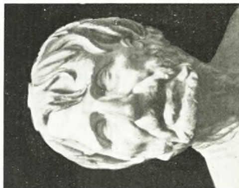
5. Marmorherme des «Pseudo-Seneca». Florenz, Uffizien (nach HEKLER, Bildniskunst der Griechen und Römer Tf. 120 b).