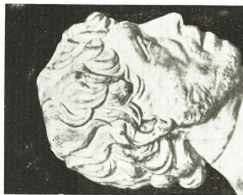
6. Marmorkopf Nr. 26. Madrid, Prado (nach VESSBERG Tf. XLVI, 2 spiegelbildlich kopiert).