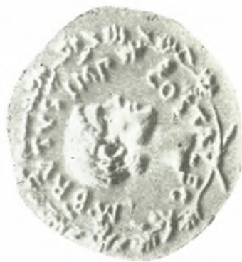
4. Aureus des Pedanius Costa ca. 43/42, London (nach VESSBERG Tf. IX, 3).