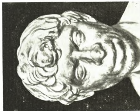
7. desgl. (nach VESSBERG Tf. XLVI, 1).