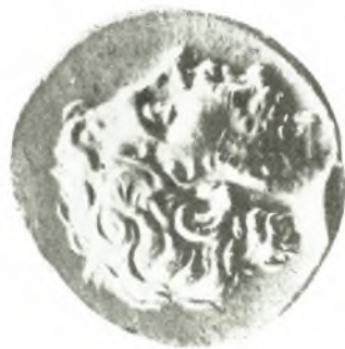
1. Aureus des T. Quinctius Flaminus von 197, früher Berlin (nach VESSBERG Tf. III, 1).