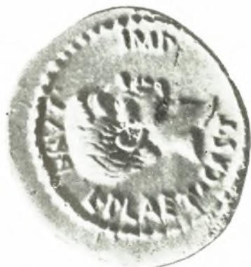
3. Denar des L. Placitorius Cestianus ca. 43/42, früher Berlin (nach VESSBERG Tf. IX, 2).