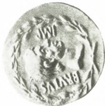
2. Aureus des Casca Longus ca. 43/42, früher Berlin (nach VESSBERG Tf. IX, 1).