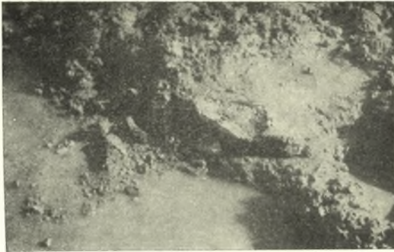
Εἰκ. 3. Τεμάχια ἐκ τοῦ κονιάματος τοῦ δαπέδου τοῦ δωματίου Α.