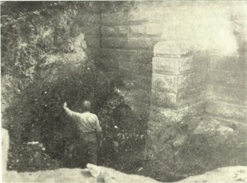
Εἰκ. 2. Ἡ βορειοδυτικὴ γωνία τοῦ ἀναλήμματος μετὰ τῶν ἀντηριδῶν.

Ὁ Ἀριστοκλῆς δὲ οὗτος εἶναι γνωστός ὡς ἱερεὺς τοῦ Ἀσκληπιοῦ ἀνα-