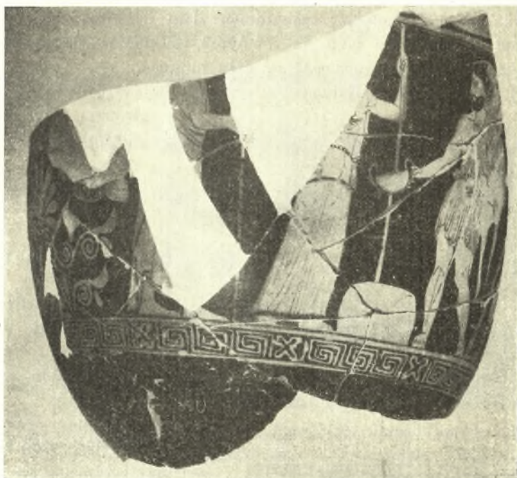
Εἰκ. 11. Ἐρυθρόμορφος κρατήρ τῶν μέσων τοῦ 5ου π.Χ. αἰῶνος.