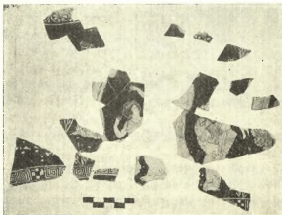
Εἰκ. 12. Ὅστρακα ἐξ ἐρυθρόμορφου οἰνοχόης τοῦ ἀγγειογράφου Μειδίου.