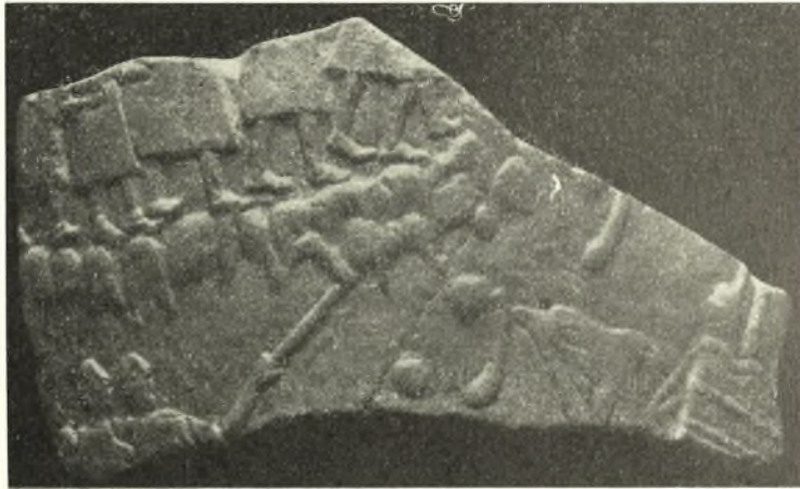
Εἰκ. 10. Τεμάχιον ρυτοῦ ἐκ στεατίτου.

λιον, παριστᾷ δύο ἀντιλόπας (εἰκ. 8), ὁ ἕτερος σκληρὸς διαβάσης, ἐκ λίθου γνωστοῦ εἰς τὴν περιοχὴν τοῦ Ἀσκληπιείου καὶ τῆς Παλαιᾶς Ἐπιδαύρου, φέρει παράστασιν λέοντος, βαίνοντος πρὸς ἄριστερά καὶ στρέφοντος τὴν κεφαλὴν πρὸς τὰ ὀπίσω (εἰκ. 9). Ὅπισθεν τοῦ σώματος τοῦ λέοντος παρίσταται ἔλαφος, τῆς ὁποίας μόνον τὸ ἥμισυ πρόσθιον μέρος μετὰ τῶν ποδῶν εἶναι ὁρατόν, ἐξερχόμενον τρόπον τινὰ ἐκ τῆς ὀσφύος τοῦ λέοντος. Τὸ ὀπί-