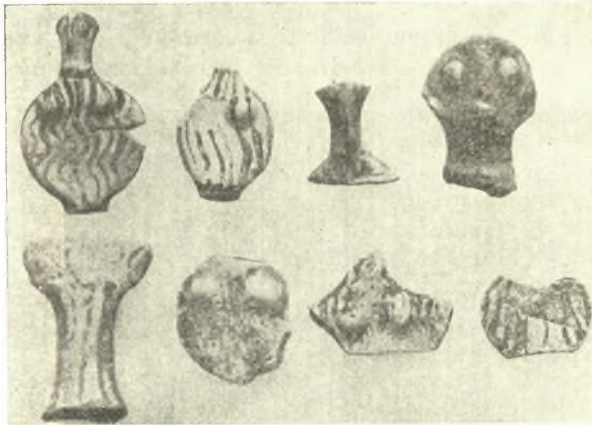
Εἰκ. 6. Μυκηναϊκὰ εἰδῶλια.

καὶ ὑστεροελλαδικῆς ἢ μυκηναϊκῆς περιόδου. Τὰ ἀνευρεθέντα ἰδιαιτέρως ὑστεροελλαδικὰ ἀγγεῖα τῆς I καὶ II κυρίως περιόδου εἶναι ἀρίστης τέχνης (εἰκ. 4), ἀνάλογα πρὸς τὰ ἐν Μυκῆναις καὶ Τίρυνθι εὑρεθέντα. Ἐπισημαντικότερα εἶναι