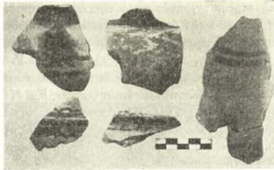
Εἰκ. 3. Ὅστρακα μεσοελλαδικῶν ἀγγείων.