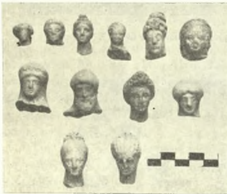
Εἰκ. 14. Πήλινα εἰδῶλια τοῦ 5ου καὶ 4ου π.Χ. αἰ.

χρυσᾶ τινὰ καὶ ἀργυρᾶ κοσμήματα, δακτυλίδιθοι χαλκοῖ μετὰ παραστάσεων καὶ ὄστρακα ἀγγείων Κορινθιακῶν καὶ Ἀττικῶν, ὡς καὶ τεμάχια ἐκ μεγάλου ἐρυθρομόρφου κρατῆρος τῶν μέσων τοῦ 5ου π.Χ. αἰῶνος μετὰ παραστάσεως τῆς Ἀθηνᾶς, τοῦ Ἡρακλέους καὶ τοῦ Διονύσου, ὄστρακα, ἐξ οἰνοχόης πιθανῶς, ὠραίου ἀγγείου τοῦ ἀγγειογράφου Μειδίου, πολλὰ πήλινα εἰδῶλια κ.ἄ.