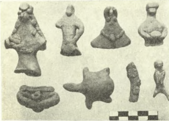
Εἰκ. 13. Πήλινα εἰδῶλια τοῦ 6ου π.Χ. αἰῶνος.

Ἡ ἀνεύρεσις τῶν πολυτίμων τούτων προϊστορικῶν ἀναθημάτων κατα-