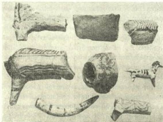
Εἰκ. 5. Εἰδώλια μυκηναϊκά.