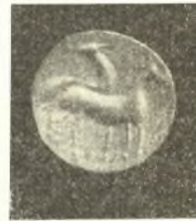
Εἰκ. 8. Μυκηναϊκὸς σφραγιδόλιθος ἐκ κορνεολίου μετὰ παραστάσεως ἀντιλοπῶν.