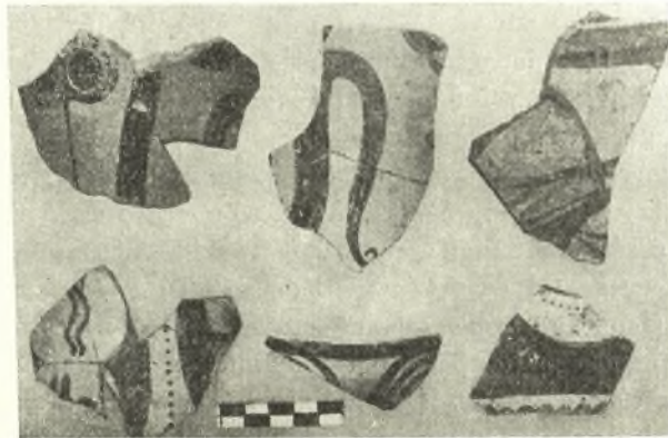
Εἰκ. 4. Ὅστρακα ἀγγείων τῆς ὑστεροελλαδικῆς I καὶ II ἐποχῆς.