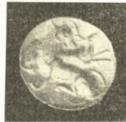
Εἰκ. 9. Μυκηναϊκὸς σφραγιδόλιθος ἐκ σκληροῦ διαβάτου.

τὰ εὑρεθέντα πῆλινα εἰδῶλια, τινὰ τῶν ὁποίων εἶναι μοναδικὰ διὰ τὸ μέγεθος αὐτῶν ἀποτελοῦντα μέρη μεγαλυτέρων συμπλεγμάτων ἀρμάτων ἢ ζυγῶν, σπανιώτατα δέ, καθ' ὅσον γνωρίζω, ἐκ τῆς ἠπειρωτικῆς Ἑλλάδος (εἰκ. 5, 6, 7). Ὅπως δὲ ἰδιαιτέρας σημασίας εἶναι μετὰ τῶν μυκηναϊκῶν εὐρημάτων δύο σφραγιδόλιθοι μετὰ παραστάσεων καὶ τρία τεμάχια ἐκ μεγάλου ἐκ στεατίτου λίθου ῥυτοῦ μετ' ἀναγλύφων παραστάσεων, τοῦ ὁποίου ἀνάλογα παραδείγματα μόνον ἐκ τῆς Μινωϊκῆς Κρήτης μᾶς εἶναι γνωστά.