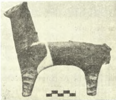
Εἰκ. 7. Μέγα μυκηναϊκὸν εἰδῶλιον