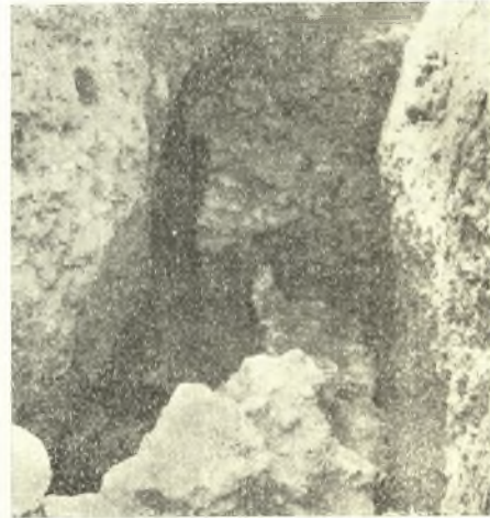
Εἰκ. 4. Τὸ βόρειον σκέλος τοῦ Β ἀπὸ Νότου, εἰς τὸ σημεῖον συναντήσεως μετὰ τὸν Δ.