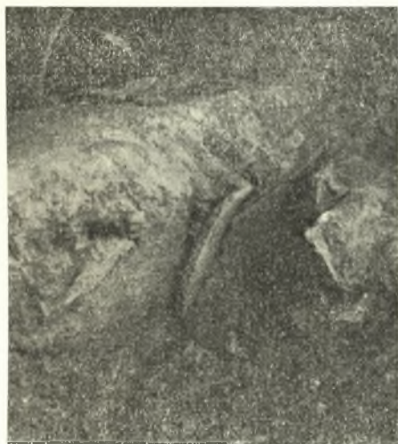
Εἰκ. 8. Ὁ τρίτος σαμμορειδῆς τάφος.

0,50 × 0,18 μ. Ἐκατέρωθεν τοῦ τάφου μικρὸν τοιχίον τὸ δὲ μεταξὺ τῶν ἐπικλινῶν πλευρῶν διάστημα πληροῦται ὑπὸ ἀσβεστοκονιάματος.