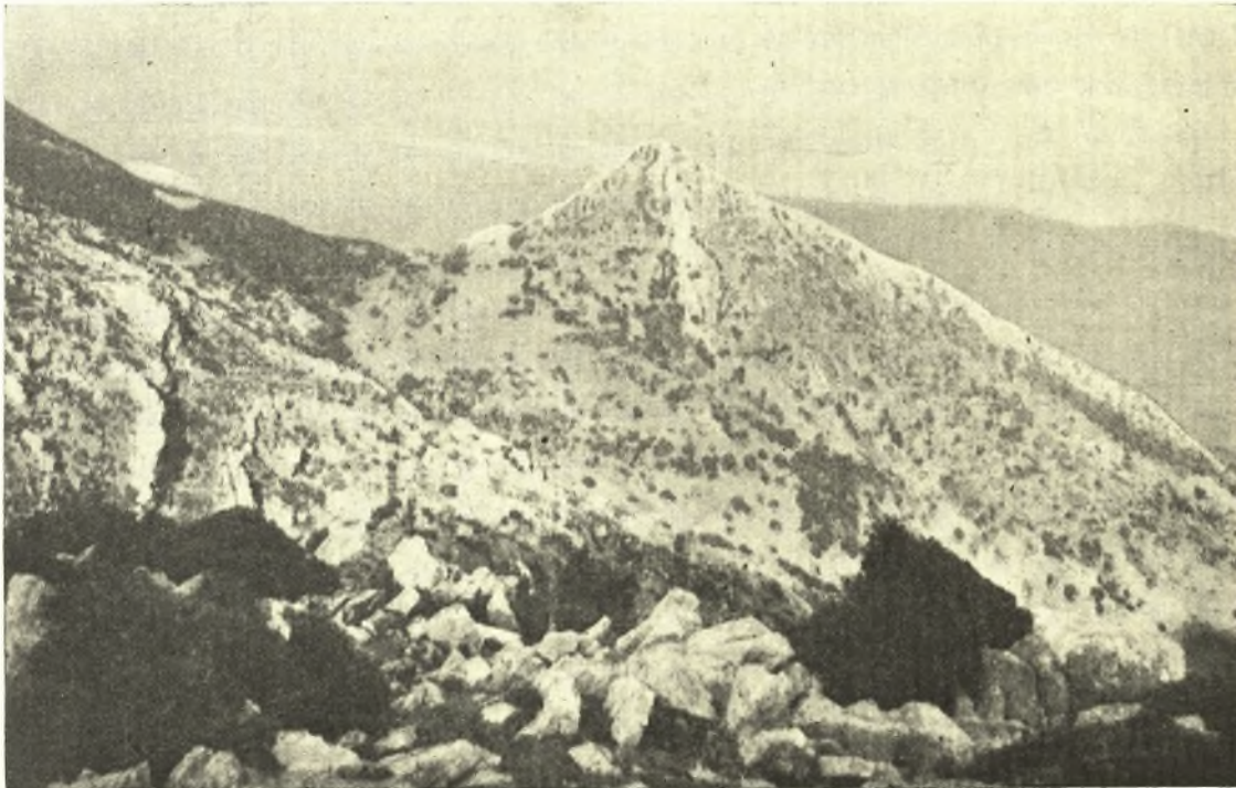
Εἰκ. 3. Τὸ δευκόρυφον ὄρος Μποβέρος, ἐφ' οὗ ἴστανται ἐν ἐρειπίοις τὸ φρούριον Beaufort. Ἄπομυς ἐξ Ἄνω Καρυῶν (Ἀραχώβης).

τοπογραφικὴν σειρὰν τῆς ἀπαριθμήσεως τῶν χωρίων τῆς ἐπαρχίας Φαναρίου ὑπὸ τοῦ D. Pierr' Ant. Pacifico (ἐν σελ. 94). Ὁ ἐν λόγῳ πίναξ περιορίζει τὴν ἐπαρχίαν Φαναρίου κατὰ τοὺς τέως δήμους τῆς ἐπαρχίας Ὀλυμπίας, πλὴν τμήματός τινος τοῦ δήμου Φιγαλείας πρὸς τὴν Νέδαν, τὸ δὲ χωρίον Βέρβена καὶ αὐτὰς μεταξὺ τῶν παρακειμένων Ζελεχόβης καὶ Κράνας. Ἐνταῦθα ἀναγκαζόμεθα νὰ παρατηρήσωμεν καὶ τὰ ἐξῆς ἐν σχέσει πρὸς τὸν δημοσιευθέντα ὑπὸ τοῦ Σπ. Λάμπρου πίνακα ἀπογραφῆς τοῦ νομοῦ Μεθώνης ὑπὸ τῶν Ἐνετῶν 1 , ἐν ᾧ τὰ Βέρβена κακῶς μετεφέρθησαν εἰς τὴν Βερβινὴν τῆς Ἡλείας. Μὴ ἀναγραφόμενων ἐν τοῖς πίναξι τῆς ἀπογραφῆς τοῦ πληθυσμοῦ τοῦ Βασιλείου τινῶν τῶν τότε