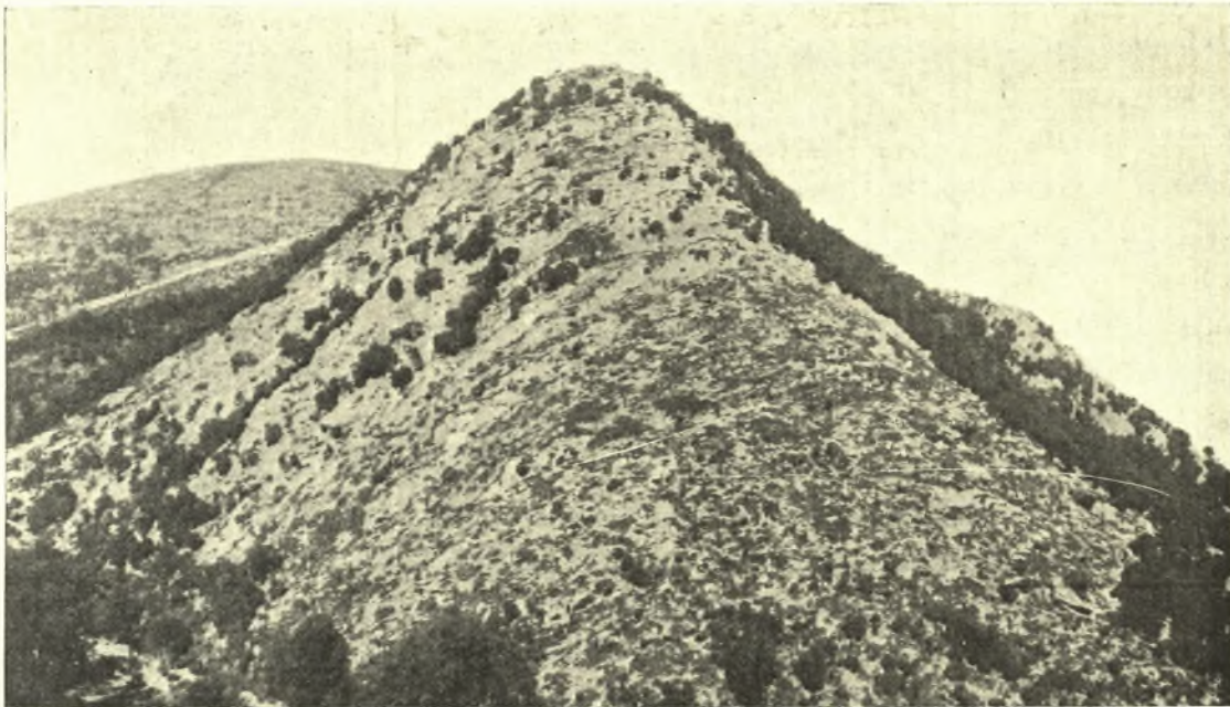
Εἰκ. 1. Τὸ «κάστρο τῆς Ἀλβαινας» (Arvano Castro) ἐπὶ κορυφῆς τοῦ ὄρους Μίνθης (Βουνούκας).

Ὡσαύτως ὁμοιότητα παρατηροῦμεν καὶ ἐν τῷδε ὅπως ὁ Ἡρόδοτος (IV, 148) ἀναφέρει ὅτι αἱ ἀρχαῖαι ἐν τῇ Τριφυλίᾳ πόλεις τῶν Μινυῶν ἦσαν διεσκορπισμέναι, ἔχουσαι κέντρον τὸν ἐν Σαμικῷ ναὸν τοῦ Ποσειδῶνος, οὕτω καὶ ἐν τῷ Ἀραγωνικῷ χρονικῷ (§ 440) περιγράφεται τὸ Ἀράκλοβον «los casales que eran en torno del castiello».