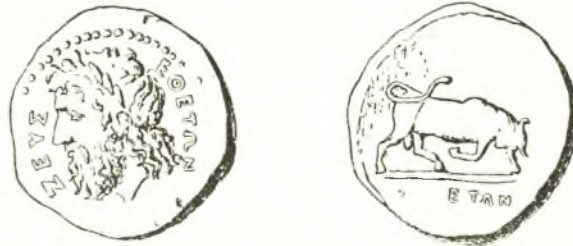
Εἰκ. 2. Χαλκοῦν νόμισμα Ἐθετῶν - Ἐθνεστῶν.

Οἱ Ἐθνεστοὶ ἢ Ἐθνεσταί 4 , ἀναφέρονται ὁμοίως ὑπὸ τοῦ αὐτοῦ: ἔθνος Θεσσαλίας, ἀπὸ Ἐθνεστοῦ τῶν Νεοπτολέμου παίδων ἐνός, ὡς Ριανὸς δ' καὶ ε' 5 . Τρία χαλκᾶ νομίσματα ἐκ τῆς περιοχῆς τῶν Ἰωαννίνων τῶν χρόνων τοῦ Ἀλεξάνδρου Α' (342-330 π.Χ.) ἢ τοῦ Πύρρου (297-272 π.Χ.), μὲ τὴν ἐπιγραφὴν ΖΕΥΞ-ΕΘΕΤΩΝ ἐκατέρωθεν δαφνοστεφοῦς κεφαλῆς Διὸς πρὸς ἀριστερά, ὀπισθεν κυρίσσων ταῦρος πρὸς τὰ δεξιὰ, ΑΡΓΕΙΩΝ (εἰκ. 2), ἀπεδόθησαν ὑπὸ τοῦ ΣΒΟΡΩΝΟΥ εἰς τοὺς Ἐθνεστάς 6 . Ἄξιον σημειώσεως εἶναι ὅτι ὁ ἐπώνυμος τῶν Ἐθνεστῶν ἀναφέρεται ὡς παῖς τοῦ Νεοπτολέμου πιθανώτατα ἐκ τῆς Λανάσσης, συμφώνως τουλάχιστον πρὸς τὴν παράδοσιν τοῦ 3ου π.Χ. αἰ., ἐκ τῆς ὁποίας ἐγεννήθησαν ὀκτὼ τέκνα (ἰδὲ κατωτ. σ. 101, 2), οὐχὶ δὲ ἐκ τῆς Ἀνδρομάχης, ἐκ τῆς ὁποίας ἐγεννήθησαν, κατὰ τὰς Ἠπειρωτικὰς πάντοτε παραδόσεις, τρία (ΠΑΥΣ. I 11,1), κατὰ δὲ μεταγενεστέρας πληροφορίας, ἀνερχομένης εἰς τὸν ἱστορικὸν τῆς αὐτῆς τῶν Αἰακιδῶν, ΠΡΟΞΕΝΟΝ (3ου π.Χ. αἰ.), τέσσαρα τέκνα 7 . Ἐνεκα τοῦ