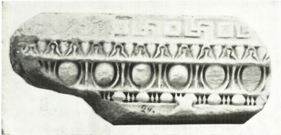
α. Ἀπότμημα σαρχοφάγου Κερκύρας.