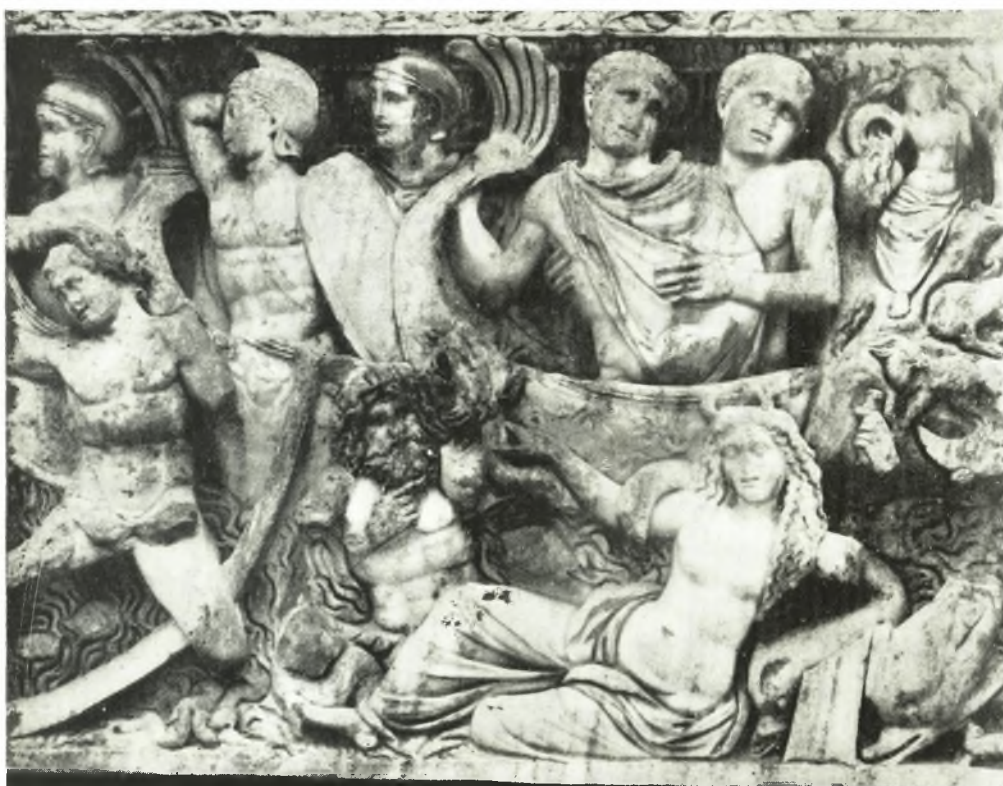
γ. Λεπτομέρεια σαρκοφάγου Θεσσαλονίκης.