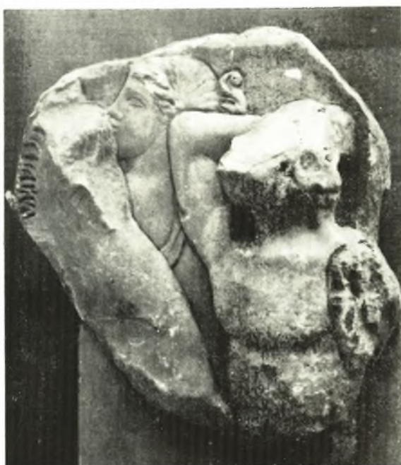
β. Ἀπότμημα σαρκοφάγου Κερκύρας.