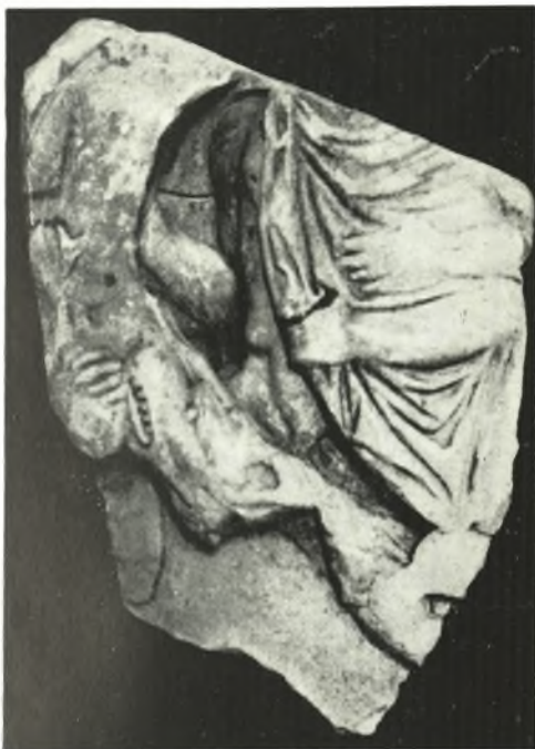
α. Ἀπότμημα σαρκοφάγου Μουσ. Τεργέστης.