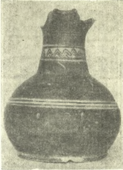
Εἰκ. 4. Πρώϊμος γεωμετρικὴ οἰνοχόη ἐκ τῆς ταφῆς ἐπὶ τῶν πλακῶν τοῦ τάφου XXI.

τῶν τεμαχίων ἀπετελέσθησαν πλήρης μὲν οἰνοχόη (τούτου μόνον τοῦ ἀγγείου τὰ τεμάχια εἶχον εὐρεθῆ ὅλα ὁμοῦ καὶ δὲν ἐνεφάνιζον διασποράν), μέρη