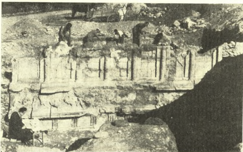
Εἰκ. 8. Καθαρισμὸς τοῦ μνημείου καὶ ἀντιγραφή τῆς ἐγχρόμου διακοσμῆσεως.

Τὴν πρόσοψιν γνωρίζομεν μόνον ἀπὸ τοῦ ὕψους τῶν δωρικῶν κιονοκράνων καὶ ἄνω. Πιθανῶς δὲν ὑπάρχει κρηπίδωμα, ἀλλὰ μόνον ταπεινὸς στυλοβάτης. Τὸ ὕψος τῶν δωρικῶν ἡμικιόνων ἐκ τῶν ἀναλογιῶν κρινόμενον πρέπει νὰ ὑπολογισθῇ εἰς 3,40 μ. περίπου. Τὸ πλάτος τοῦ ἄβακος τῶν κιονοκράνων εἶναι 0,55 μ., τῶν ἐπικράνων τῶν κατὰ τὰ ἄκρα παραστάδων 0,28 μ., ἐνῶ τὰ μετακίονια ἀπὸ ἄβακος εἰς ἄβακα μετροῦν τὰ μὲν ἀκραῖα περίπου 1,15 μ., τὸ κεντρικόν (κατὰ τὴν εἴσοδον) 1,65 μ., τὰ δύο ἐνδιάμεσα περὶ τὸ 1 μ. περίπου ἑκάτερον.