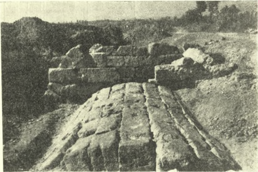
Εἰκ. 3. Μετὰ τὴν ἀπομάκρυνσιν τοῦ ὑπερθεῖν τύμβου ἄποψις τοῦ τάφου ἀπ' ἀνατολῶν.

θαλάμου ὑψούμενον μέρος τοῦ ὀπισθίου τοίχου τοῦ προθαλάμου (εἰκ. 3), εἶρον τὸν προθάλαμον πλήρη χωριάτων. Ἄλλως θὰ εἰσῆρχοντο εἰς τὸν νεκρικὸν θάλαμον διὰ τῆς μεταξὺ τῶν δύο θαλάμων θύρας καὶ δὲν θὰ εἶχον ἀνάγκην νὰ ἐπιχειρήσουν καὶ νέον ῥῆγμα τοῦ μεσοτοίχου ὑπὸ τὴν καμιάραν τοῦ θαλάμου ὑπὲρ τὴν εἴσοδον (εἰκ. 4). Συνεπῶς ἢ μεταξὺ τῶν δύο θαλάμων θύρα καὶ δὴ καὶ τὸ δάπεδον τοῦ προθαλάμου τοὐλάχιστον, ἂν μὴ καὶ τοῦ θαλάμου, εὐρέθησαν κεχωσμένα καὶ πιθανῶς παρέμειναν ἀπρόσιτα εἰς τοὺς ἐπιχειρήσαντας τὸ ῥῆγμα τῆς εἰκ. 4. Ἄλλὰ τότε ἐχώσθη τὸ ἐσω-