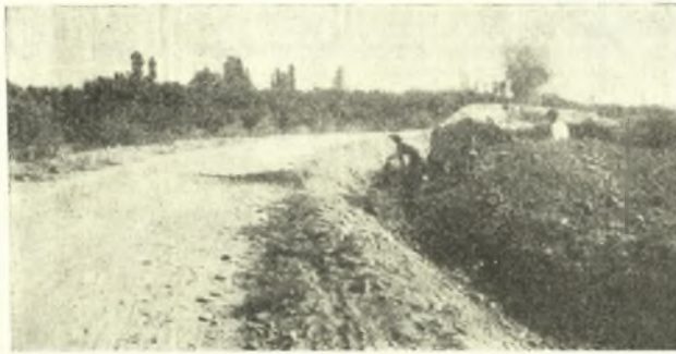
Εἰκ. 1. Ἄποψις ἀπὸ δυσμῶν κατὰ τὴν ἔναρξιν τῆς ἀνασκαφῆς.

Τὰ πρὸ τῆς ἐνάρξεως τῆς ἀνασκαφῆς φανέντα καὶ βλαβέντα μέρη τοῦ μνημείου ἦσαν παραστάς ἀριστερᾶ, εἶτα εἰκονικὴ θύρα καὶ ἰωνικὸς ἡμικίων δεξιᾶ. Εὐλόγως, νομίζω, ἐφαντάσθημεν τότε τὴν προσόψιν τοῦ μνημείου ὡς ἀποτελουμένην μόνον ἀπὸ δύο ἡμικίονας ἐκατέρωθεν εἰσόδου, ἀνὰ μίαν εἰκονικὴν θύραν δεξιᾶ καὶ ἀριστερᾶ καὶ παραστάδας κατὰ τὰ ἄκρα. Τοιοῦτος τάφος ἤρμοζεν ἄλλωστε εἰς τὸν σχετικῶς μικρὸν τύμβον (εἰκ. 1). Εἰς τὴν περίπτωσιν αὐτὴν τὸ μνημεῖον ἔπρεπε νὰ θεωρηθῆ κατὰ