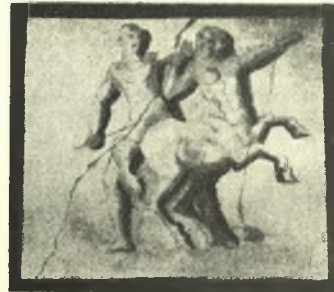
Εἰκ. 6. Τμήμα κοσμοφόρου καὶ γραπταὶ μετόπαι κατ' ἀντιγραφὴν τοῦ κ. Λεφάκη.

λῆς καὶ ὑπὲρ ταύτην δι' ἐρυθροῦ χρώματος ἐπιγραφὴ μὲ γράμματα τοῦ 3ου αἰ. π.Χ. ΡΑΔΑΜΑΝΘΥΣ. Ὁ πειρασμὸς ἦτο ἀκατανίκητος. Ὅθεν διὰ προχείρου ἀνασύρσεως τῶν χωμάτων ἐβεβαιώθη καὶ κατὰ τὸ ἐπόμενον μετακίονιον γραπτὴ παράστασις μετ' ἐπιγραφῆς ΑΙΑΚΟΣ. Πέραν τοῦ ἀνοίγματος τῆς εἰσόδου, κατὰ τὸ ἐπόμενον μετακίονιον, ἐβεβαιώθη ἐπίσης γραπτὴ παράστασις ἑτέρας μορφῆς, ἄνευ ἐπιγραφῆς, ἀλλὰ μὲ τὸ χαρακτηριστικὸν τοῦ Ἑρμοῦ κηρύκειον. Ἡ κατὰ τὸ ἄκρον ἀριστερὸν μετακίονιον μορφή τέλος δὲν φέρει ἐπιγραφὴν οὔτε χαρακτηριστικὸν σύμβολον. Πιθανῶς εἶναι ὁ νεκρός, τὸν ὁποῖον ὁ ψυχοπομπὸς Ἑρμῆς ὁδηγεῖ εἰς τὸν Ἄδην, ὅπου ἀναμένουν δίκαιοι κριταί, ὁ Αἰακὸς καὶ ὁ Ραδάμανθυς.