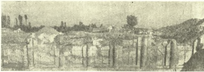
Εἰκ. 2. Τὸ σωζόμενον μέρος τοῦ ἄνω ὀρόφου τῆς προσόψεως.

νάλογον πρὸς τὸ πλάτος τῆς προσόψεως (περὶ τὰ 9 μέτρα). Ἐνεκα τούτου ὑπέθεσα δευτέρου θαλάμιου χαμηλότερον κατὰ τὸ γνωστὸν παράδειγμα τοῦ τάφου τοῦ Λαγκιδᾶ. Πράγματι διὰ δοκιμαστικῆς σκαφῆς ὄπισθεν τοῦ τύμβου ἐβεβαίωσα τὴν ὑπαρξίν τοῦ δευτέρου θαλάμου καὶ συγχρόνως τὸ ὄλικόν μῆκος τοῦ μνημείου (περὶ τὰ 9 μέτρα). Ὁ ὑπὲρ τὸν τάφον τύμβος λοιπὸν ἦτο ἀνάγκη νὰ ἀπομακρυνθῆ ἔξ ὀλοκλήρου, ἵνα ἀποκαλυφθῆ ἐπαρκῶς τὸ μνημεῖον. Τοῦτο καὶ ἐγένετο (εἰκ. 3 καὶ 7). Ἀπεκαλύφθη οὕτω, ὅτι πλὴν τοῦ ἀετώματος καὶ ἡ καμάρα τοῦ προθαλάμου εἶχε καταπέσει. Τὸ ἔσωτερικὸν ἐπληρώθη ἐκ τῶν χωμάτων τοῦ ὑπερθεῖν τύμβου. Ἡ ἐργασία τῆς ἀποχωματώσεως τοῦ προθαλάμου ἦτο οὐ μόνον δυσχερὴς καὶ δαπανηρά, ἀλλὰ καὶ ἐπικίνδυνος. Λιότι ἐνῶ προηγουμένως εἶχε βεβαιωθῆ καθ'