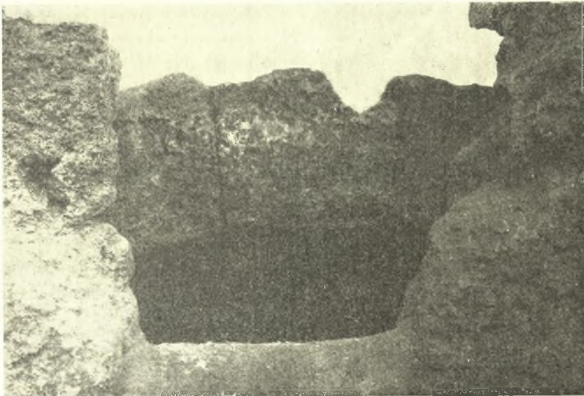
Εἰκ. 4. Ἀνοίγμα τυμβωρούχων εἰς τὸν μεσότοιχον, ἀμέσως ὑπὸ τὴν καμάραν τοῦ νεκρικοῦ θαλάμου.

Γὸ ἐκ τοῦ μερικοῦ καθαρισμοῦ τῶν θαλάμων δίδαγμα περὶ τῆς καθ' ἕψος διαστάσεως τοῦ τάφου ἦτο πρόδηλον: ἡ ἀνασκαφὴ ἔπρεπε νὰ συνε-