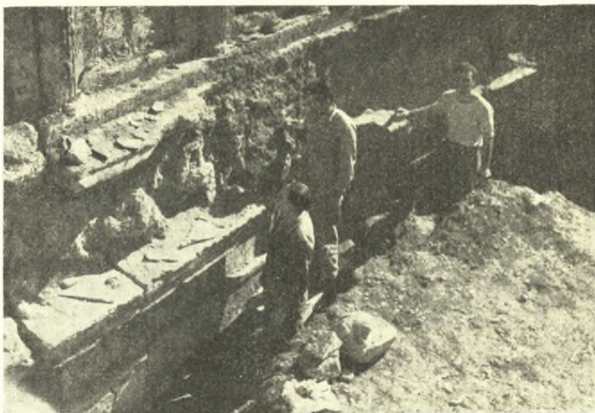
Εἰκ. 5. Καθαρισμὸς τῆς ζωοφόρου.

Εἰς νέον τηλεγράφημά μου ἀμέσως ἀνταποκριθεῖσα ἡ Διεύθυνσις