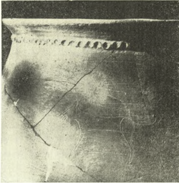
Εἰκ. 8. Τὸ ἄνω μέρος ΠΕ. III πίθου μετὰ παραστάσεως κυνός.

Οἱ πίθοι εἶναι ἐπίσης ἀξιοσημεῖοι, ἰδίως ὁ ἐντὸς τοῦ θαλάμου τῆς οἰκίας Ε εὐρεθεῖς, ὅστις φέρει οκιαγραφίαν κυνός , χαραχθεῖσαν πρὸ τῆς ὀπτήσεως. Τὸ ζῶον ἀπεδόθη μὲ καταπλήσσοσαν λιτότητα καὶ φυσιοκρατικὴν ἀντίληψιν, ἢ παρουσία του δὲ ἐπὶ τοῦ πίθου, ὡς φύλακος τρόπον τινὰ τοῦ οἰκογενειακοῦ ταμιεύματος, εἶναι ἐπίσης εὐστοχος καὶ γραφικὴ (εἰκ. 8).