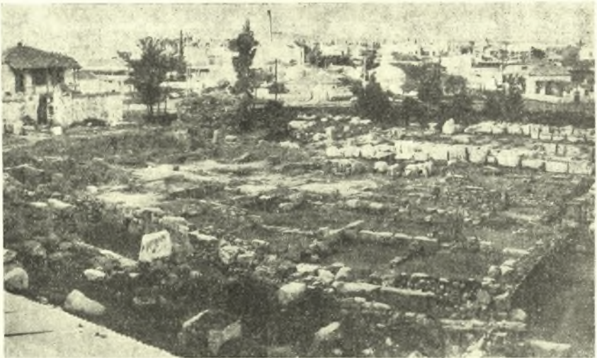
Εἰκ. 3. Ὁλόκληρος ὁ χώρος Α, ὡς φαίνεται σήμερον μετὰ τὰς ἀνασκαφάς. Ἄποψις ἐκ τοῦ λόφου τῆς Ἀκροπόλεως.

Τὰ οἰκοδομήματα τοῦ βοηθητικοῦ χώρου πρέπει νὰ εὐρίσκωνται ἑκατέρωθεν τῆς μεταξὺ τῶν Μεγάλων καὶ τῶν Μικρῶν Προπυλαίων σχηματιζομένης μικρᾶς αὐλῆς. Ἦδη ἔχομεν προσδιορίσει τὸν οἶκον τῶν Κηρύκων καὶ τοὺς ρωμαϊκοὺς σιρούς, παραμένουν δὲ πρὸς ταύτισιν μόνον οἱ χώροι Α καὶ Β, ἐντὸς τῶν ὁποίων πρέπει νὰ ζητήσωμεν τὰ ὑπὸ τῆς Ἑλευσινιακῆς ἐπιγραφῆς τοῦ 329/28 π.Χ. μνημονευόμενα κτήρια: τὴν οἰκίαν τῆς ἱερείας, τὸ ἐπιστάσιον, τὸ νεωκόριον, τὸ ὀπτάνιον, τὴν κρήνην, τὴν οἰκίαν τοῦ δαδούχου, τὸ ἐσχαρεῖον καὶ τὴν ἱματιοθήκην.