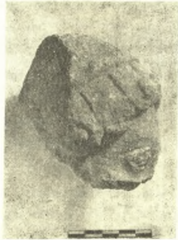
Εἰκ. 4 καὶ 5. Ἀρχαϊκὴ κεφαλὴ ἀνδρὸς ἐξ Ἐλευσινιακοῦ λίθου.