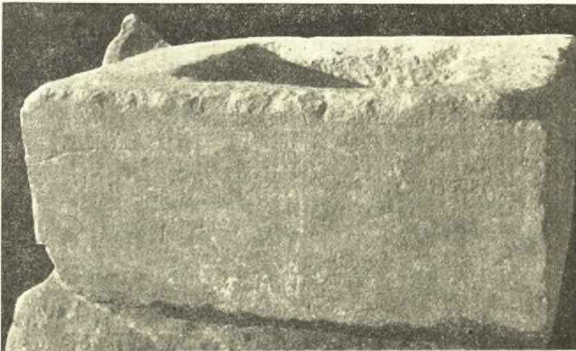
Εἰκ. 6. Ἐφηβικὴ ἐπιγραφὴ τῆς Κεκρολίδος φυλῆς τοῦ ἔτους 333/32 π. Χ. νῶς τῶν τελευταίων χρόνων τῆς Τουρκοκρατίας, βαθύτερον ὅμως, μέχρι τῆς συνέταξε καὶ μοι παρέδωσε πλήρη χρονολογικὸν κατάλογον αὐτῶν. Τὴν κ. Βαρούχα θερμῶς εὐχαριστῶ καὶ ἐνταῦθα διὰ τὴν πολύτιμον βοήθειάν της.