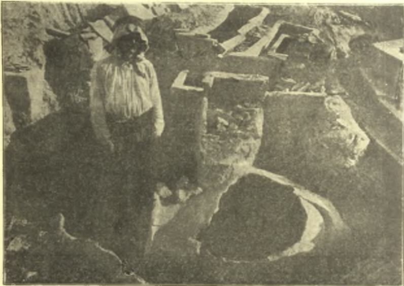
Εἰκ. 2. Τάφοι Κλαζομενῶν.

κίλη. Συχνή εἶναι ἢ ἀπλή κυματοειδῆς γραμμὴ ἐπὶ τῶν μακρῶν πλευρῶν, διπλῆ δὲ ἐπὶ τῶν στενῶν. Ἐπειτα ἔχομεν τρίγωνα, μαιάνδρους, ζωοφόρους ἐναλλασσομένων ἀνθέων καὶ καλύκων λωτοῦ καὶ τέλος συμπλέγματα σφιγγῶν, λεόντων καὶ βοῶν. Κτερίσματα δὲν εὐρέθησαν ἐντὸς τῶν ἀδιαταράκτων σαρκοφάγων, ἀλλ' εὐρέθησαν πολλὰ τεμάχια ἀγγείων ἐκτὸς τῶν σαρκοφάγων καὶ ἐντὸς τῶν πέριξ χωμάτων. Σκελετοὶ περιείχοντο ἀνά εἰς ἐν ἐκάστη. Μία δὲ μόνη εἶχε δύο. Ὡς καλύμματα ἐχρησίμευον πλάκες πύρινοι. Μία τῶν σαρκοφάγων εἶχε κάλυμμα ἐπίσης πῆλινον πάχους δύο περίπου ἑκατοστῶν τοῦ μέτρου μονοκόμματος.