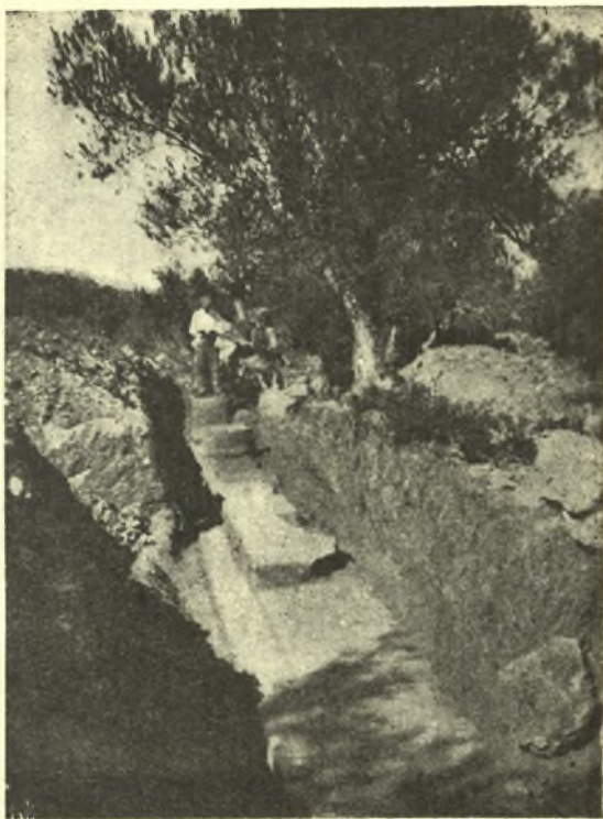
Εἰκ. 1. Λείψανα ἀρχαικοῦ ναοῦ Κλοπεδῆς Λέσβου.

Κατ' ἀρχὰς ἐπεχείρησα τὴν περαιτέρω ἐσκαφὴν τῶν θεμελίων ἀρχαικοῦ ναοῦ, τὸν ὁποῖον ἀπεκάλυψα ἐν θέσει Κλοπεδῆ τῆς περιφερείας Καλλονῆς