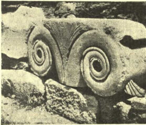
Εἰκ. 3. Αἰολικὸν κιονόκρανον ἀρχαϊκοῦ ναοῦ Λέσβου.

κίονος, ὅστις εἶναι ἀρράβδωτος (εἰκ. 2). Ἐπὶ τοῦ παρακειμένου ἀγροῦ εὐρέθη καὶ κιονόκρανον «αἰολικόν» τοῦ γνωστοῦ τύπου. Αἱ βάσεις καὶ τὰ κιονόκρανα εἶναι τῆς αὐτῆς μορφῆς καὶ ἔχουσι τὰς αὐτὰς διαστάσεις πρὸς τὰ εὐρεθέντα πλησίον τῶν προηγουμένων θεμελίων. Φαίνεται ὅτι ἡ στενὴ πλευρὰ εἶχεν ὀκτὼ κίονας (διάμ. βάσ. 0,82, διάστυλον 1,27), ἄγνωστον δὲ πόσους ἢ μακρὰ πλευρὰ, ἣτις δὲν ἀπεκαλύφθη εἰσέτι κατὰ τὴν ἐφετινὴν περίοδον. Λεῖψανα ἐπίσης τοῦ τοίχου τοῦ σηκοῦ εὐρέθησαν, ἀλλ' οὐχὶ ἱκανὰ ὥστε νὰ φαίνεται