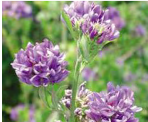
Εικόνα 28: Μηδικές ( Medicago Sativa )