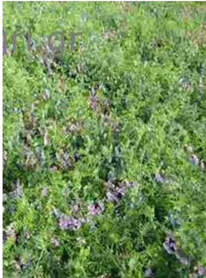
Εικόνα 27: Βίκος ( Vicia Sativa )