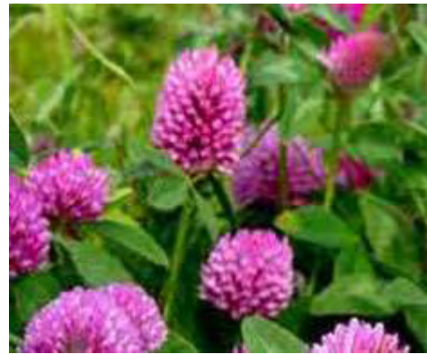
Εικόνα 26: Τριφύλλι (Trif. Pratensis)