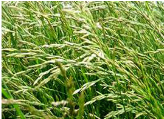
Εικόνα 25: Φεστούκα (Festuca Arundinacea)