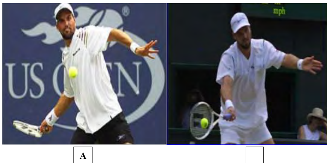
Εικόνα 5: Forehand στην προετοιμασία (A) και κατά το χτύπημα της μπάλας (B) ( www.itf.com )

με κακώσεις των άνω άκρων (Genevois et al., 2015;King et al. 2012). Ωστόσο, το forehand έχει συνδεθεί με την τενοντίτιδα του ωλένιου εκτεινόντος, αλλά αποτελεί και τον πιο διαδεδομένο τρόπο χτυπήματος, πιθανώς λόγω της δυσκολίας εκτέλεσης του backhand (Chung and Lark, 2017). Το forehand απαιτεί 31% μεγαλύτερη γωνιακή ταχύτητα του καρπού την χρονική στιγμή που πραγματοποιείται πρόσκρουση με την μπάλα (Chung and Lark, 2017). Συνεπώς, οι επαναλαμβανόμενες πιέσεις που δέχεται ο καρπός στην ωλένια πλευρά αυξάνουν σημαντικά τον κίνδυνο τραυματισμού. Κατά την εκτέλεση χτυπημάτων με two-handed backhand, έχουν καταγραφεί τραυματισμοί στο μη κυρίαρχο χέρι, γεγονός που αποδίδεται στην έντονη απόκλιση του ωλένιου εκτεινόντος κατά το χτύπημα της μπάλας και για την εκτέλεση του απαιτείται διαδοχικός συντονισμός πέντε τμημάτων σώματος, συγκεκριμένα των μηρών, των ώμων, του άνω βραχίονα, του αντιβραχίονα και του (Chung and Lark, 2017; Reid and Elliott, 2002). Για την αποφυγή τραυματισμών είναι απαραίτητη η ελαστικότητα των μυών του καρπού κατά την εκτέλεση του χτυπήματος και η χρήση τρόπων λαβής της ρακέτας που επιβαρύνουν λιγότερο τους εκτεινόντες του καρπού. Όσον αφορά παίκτες σε παιδική ηλικία, πολλοί από αυτούς δε διαθέτουν απαραίτητη δύναμη και αντοχή προκειμένου να ανταπεξέλθουν στις απαιτήσεις του αθλήματος και για αυτό το λόγο υιοθετούν συχνά λάθος τεχνική, με αποτέλεσμα να αυξάνεται σημαντικά ο κίνδυνος τραυματισμού τους (Kibler and Safran, 2005).