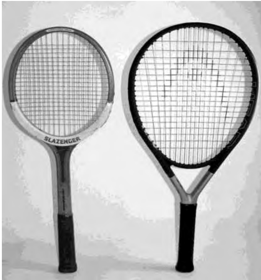
Εικόνα 1: Ρακέτες από ξύλο και γραφίτη

Η ρακέτα είναι ίσως το πιο διάσημο κομμάτι του εξοπλισμού και έχει προσελκύσει την μεγαλύτερη προσοχή όσον αφορά την τεχνολογική ανάπτυξη και αυτό διότι είναι το μοναδικό εργαλείο που δεν μοιράζονται οι παίκτες και μπορεί να προσαρμοστεί στη φυσιολογία και το στυλ παιχνιδιού του ατόμου. Τα υλικά που χρησιμοποιούνται για τις ρακέτες έχουν αλλάξει στο πέρασμα των χρόνων, ξεκινώντας με ξύλινα πλαίσια, στη συνέχεια με κράματα μετάλλων και φτάνοντας σε σύνθετα υλικά από ανθρακονήματα (γραφίτης). Μια τυπική σύγχρονη ρακέτα είναι περίπου 25 με 40% πιο ελαφριά από εκείνες που χρησιμοποιούνταν παλαιότερα και έχει μεγαλύτερη κεφαλή ( Εικόνα 1 ).