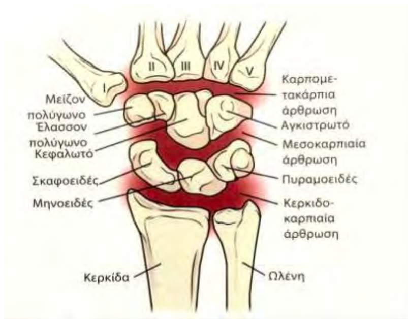
Εικόνα 3: Αρθρώσεις καρπού (Brunnstrom Κλινική Κινησιολογία, 2005).

Οι σύνδεσμοι καλύπτουν την παλαμιαία, τη ραχιαία, την κερκιδική και την ωλένια πλευρά του καρπού και διακρίνονται σε ετερόχθονες και αυτόχθονες. Οι ετερόχθονες σύνδεσμοι συνδέουν την κερκίδα και την ωλένη με τα καρπιαία οστά, ενώ οι αυτόχθονες συνδέουν τα καρπιαία οστά μεταξύ τους. Οι δύο στοιχείοι των καρπιαίων οστών ενώνονται μεταξύ τους, αλλά και με την κερκίδα και τον ωλένιο ινοχόνδρινο δίσκο μέσω έσω και έξω πλάγιων συνδέσμων σε σχήμα V. Οι ετερόχθονες σύνδεσμοι εκτείνονται από την κερκίδα και την ωλένη και συγκλίνουν στο κεφαλωτό και το μηνοειδές οστό, ενώ ο αυτόχθων σύνδεσμος σχήματος V προσφύεται στο πυραμοειδές και το σκαφοειδές και συγκλίνει προς το κεφαλωτό οστό. Δεν παρατηρούνται σύνδεσμοι μεταξύ του κεφαλωτού και του μηνοειδούς οστού γεγονός που επιτρέπει σημαντική κινητικότητα.