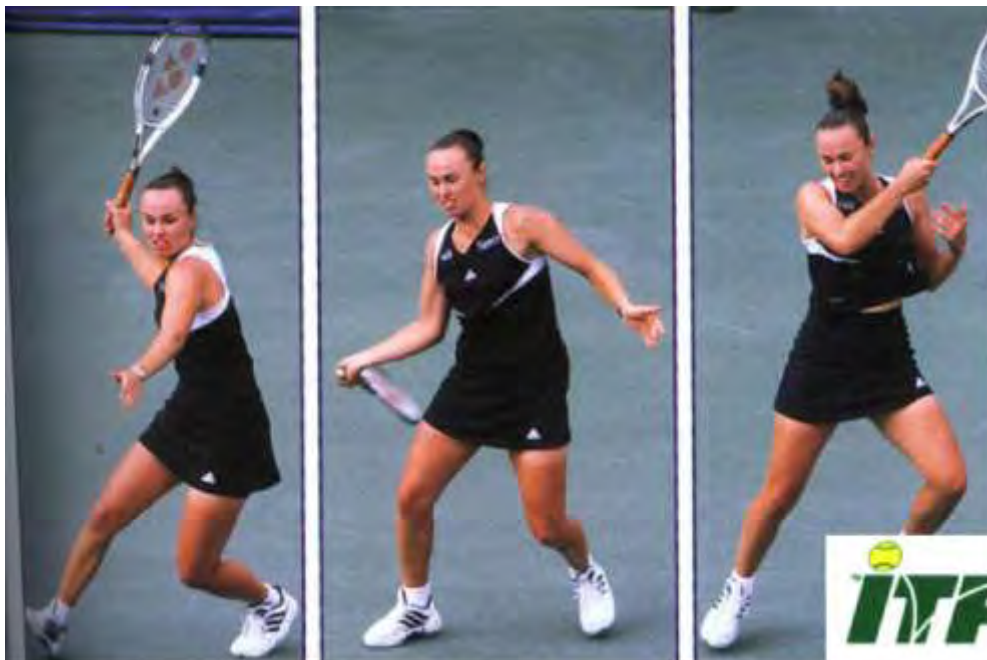
Εικόνα 7: Η κινησιολογία του μυοσκελετικού συστήματος κατά την εκτέλεση ενός χτυπήματος

Η επιτυχία στο τένις απαιτεί ένα συνδυασμό ικανότητας, καλής προπόνησης, κατάλληλου εξοπλισμού και κατανόησης των μηχανικών πτυχών που σχετίζονται με το άθλημα. Η τεχνική που χρησιμοποιούν οι παίκτες διαδραματίζει σημαντικό ρόλο στη διαμόρφωσή τους και ο τρόπος με τον οποίο εκτελούν τα χτυπήματα μπορεί να αναλυθεί σε μηχανικό επίπεδο, προκειμένου να βρεθεί η αιτία πρόκλησης κάθε τραυματισμού (Elliott, 2006). Η ανάλυση των χτυπημάτων σε μηχανικό επίπεδο παρέχει στους αθλητές, τους προπονητές και τους επιστήμονες της αθλητικής ιατρικής το κατάλληλο υπόβαθρο για να αναπτύξουν κατάλληλες στρατηγικές αποφυγής των τραυματισμών. Έχει παρατηρηθεί ότι υπάρχουν ορισμένοι τρόποι χτυπήματος οι οποίοι είναι πιο αποτελεσματικοί και προκαλούν λιγότερη πίεση στο σώμα (Kibler and Safran, 2005). Με την αξιοποίηση της κινητικής αλυσίδας από το έδαφος μέχρι τον καρπό μπορεί να προκύψει βέλτιστη δύναμη με τη λιγότερη επιβάρυνση των άνω άκρων κατά το χτύπημα της μπάλας(εικόνα 5). Ωστόσο, μία μικρή καθυστέρηση μεταξύ των φάσεων της κίνησης μειώνει την ενέργεια. Ο αποτελεσματικός τρόπος χτυπήματος, με μέγιστη απόδοση και ελάχιστο κίνδυνο τραυματισμού, απαιτεί τη βέλτιστη ενεργοποίηση όλων των συνδέσεων στην κινητική αλυσίδα. Οι τραυματισμοί συνδέονται με τη μεταφορά ενέργειας στα τμήματα της κινητικής αλυσίδας καθώς εάν ένα τμήμα της αλυσίδας αφαιρεθεί, τότε η απώλεια αυτή πρέπει να αποκατασταθεί από τα υπόλοιπα τμήματα, γεγονός που οδηγεί σε αυξημένη επιβάρυνση των ιστών (Elliott, 2006).