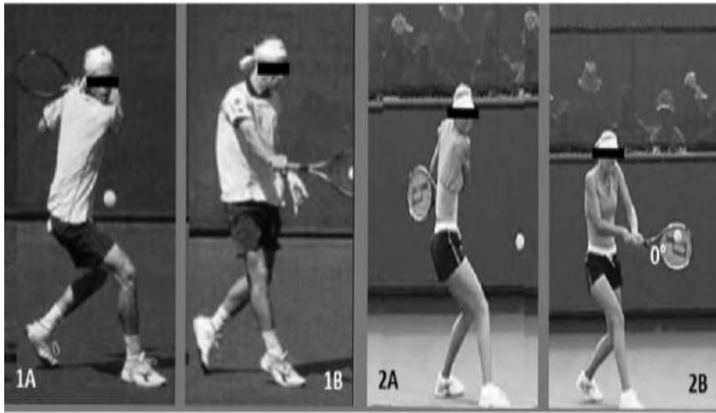
Εικόνα 6: 1.Backhand με την χρήση ενός χεριού στην προετοιμασία (A) και κατά το χτύπημα της μπάλας (B). 2.Two-handedbackhand στην προετοιμασία (A) και κατά το χτύπημα της μπάλας (B). (Genevoisetal., 2015)

Οι στρεσογόνοι παράγοντες σχετίζονται με την επίδοση των αθλητών και με τη συχνότητα τραυματισμών. Αναφορικά με την ψυχολογική κατάσταση ενός αθλητή, έχει παρατηρηθεί ότι η ικανότητα διαχείρισης του άγχους βελτιώνει την επίδοσή του (Davis, 1991) και μειώνει την συχνότητα τραυματισμών (Mechelen et al., 1992). Ο ανταγωνισμός που παρατηρείται στο σύγχρονο τένις ωθεί τους παίκτες σε υψηλής έντασης κινήσεις και σκληρή προπόνηση γεγονός που επιβαρύνει το μυοσκελετικό σύστημα με βαριά μηχανικά φορτία (Maquigaiin and Ghisi, 2006). Κάθε μέρος του μυοσκελετικού συστήματος χαρακτηρίζεται από συγκεκριμένα όρια ανοχής στα επίπεδα δυνάμεων/στρεσογόνων που μπορεί να δεχτεί δίχως να προκληθεί κάκωση (Nigg, 1985). Σε επίπεδο φυσιολογίας, κατά τη διάρκεια ενός αγώνα αυξάνονται τα επίπεδα κορτισόλης, εξαιτίας είτε του άγχους είτε των φυσικών απαιτήσεων που ορίζει το άθλημα, γεγονός που οφείλεται σε μειωμένη επίδοση του αθλητή (Filaire, etal., 2009). Τα παιδιά έχει παρατηρηθεί ότι εμφανίζουν υψηλότερη συχνότητα τραυματισμών που οφείλονται σε στρεσογόνους παράγοντες (Abrams, Renstrom and Safran, 2012), γεγονός που υπογραμμίζει την αναγκαιότητα προπόνησης προσαρμοσμένης στις ανάγκες αυτής της ηλικίας, για τη διαμόρφωση παικτών με σωστή τεχνική και κατ' επέκταση μειωμένου κινδύνου τραυματισμού.