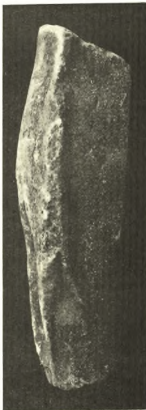
Εἰκ. 7. Ἀριστερὰ πλευρὰ τῆς κόρης τῆς εἰκ. 6.

γ') Χαλκᾶ . Ἐν ἀφθονίᾳ εὐρέθησαν γεωμετρικαὶ πόρπαι διαφόρων